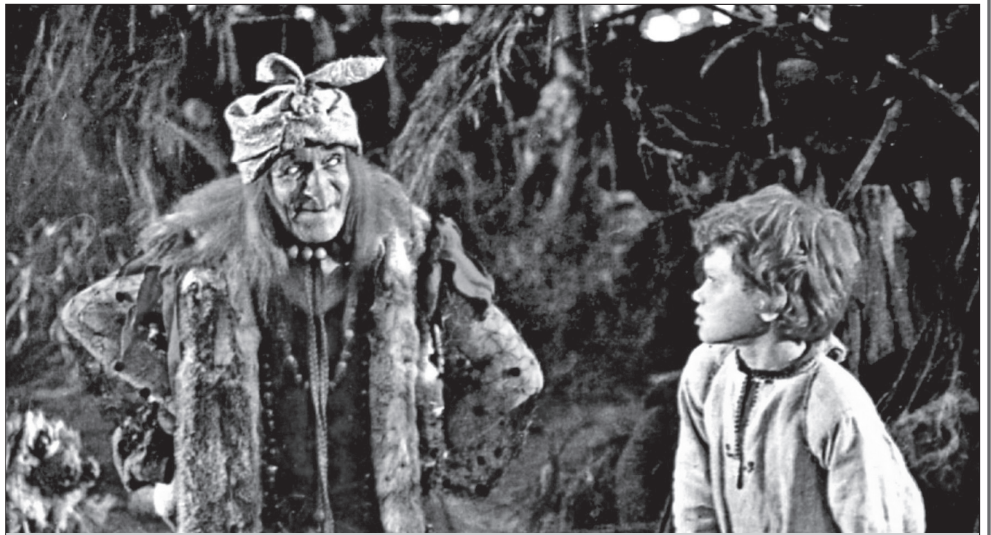
Фильм «Золотые рога»

Советский кинематограф подарил детям еще множество замечательных