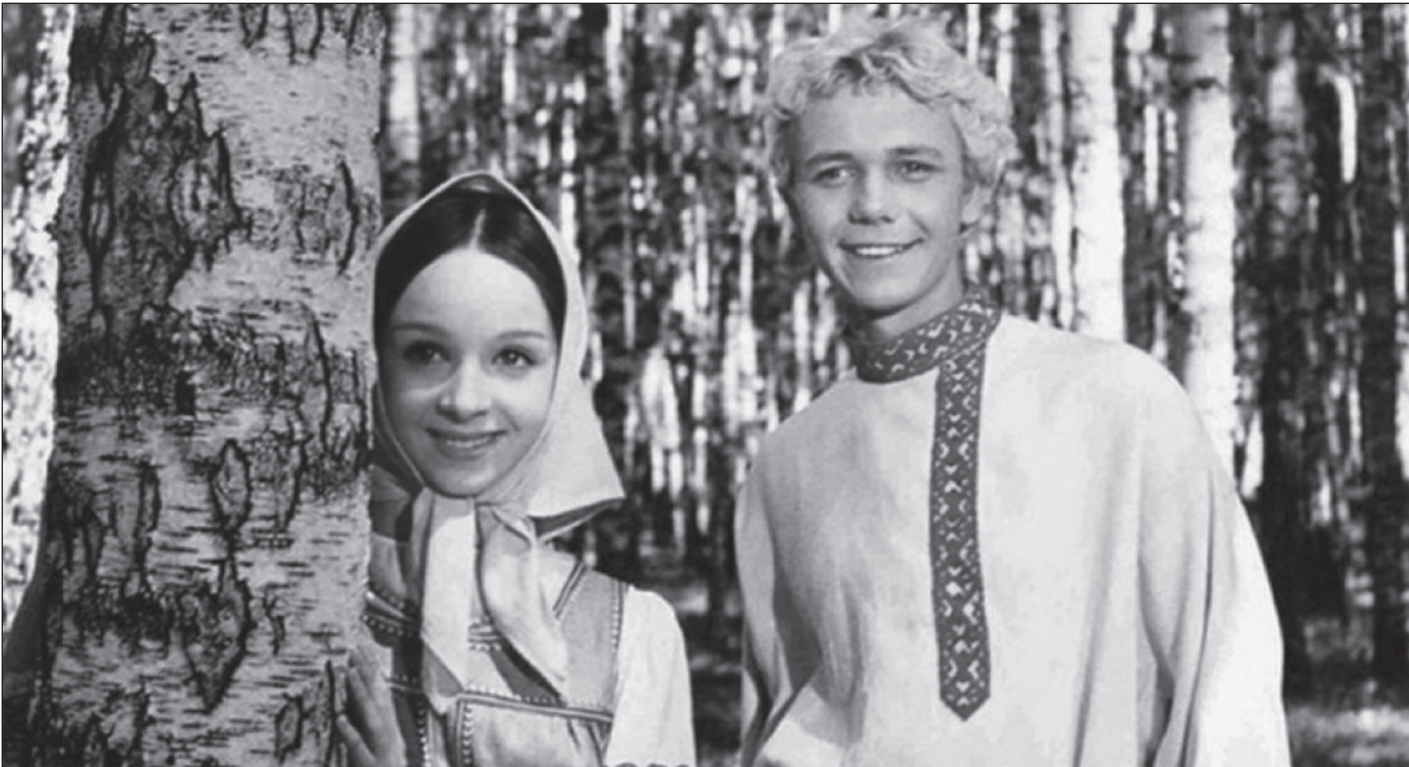
Фильм «Огонь, вода и медные трубы»

«Тайна горного озера», как и «Пленники Барсова ущелья», снятые по произведениям Вахтанга Ананяна, были популярны в 50-е годы XX века, но оказались основательно забыты сейчас. На мой взгляд, напрасно.