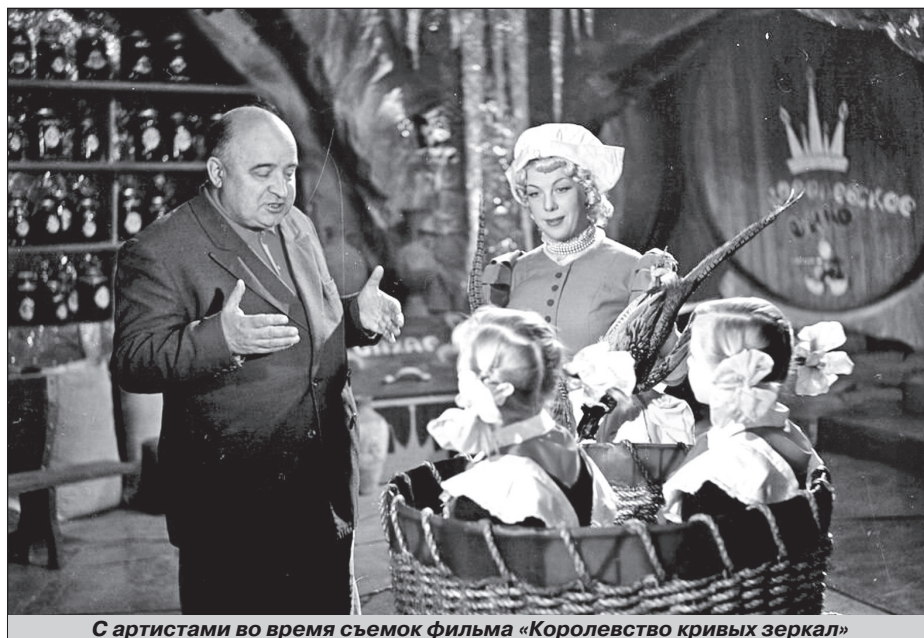
С артистами во время съемок фильма «Королевство кривых зеркал»

Картина «По щучьему велению», вопреки ожиданиям кино-чиновников, имела феноменальный успех у зрителей. Самоходная печь, шагающие сами ведра, пятающиеся гуси, говорящая щука и волшебное превращение зимы в лето - все выглядело реалистично, вызывая восхищение мастерством режиссера и съемочной команды. Специалисты знали, что Роу категорически отказался от использования анимации для создания спецэффектов, стремясь к максимальной натуралистичности в каждом кадре и применяя для этого новаторские идеи. За дебютной лентой последовали «Ва-