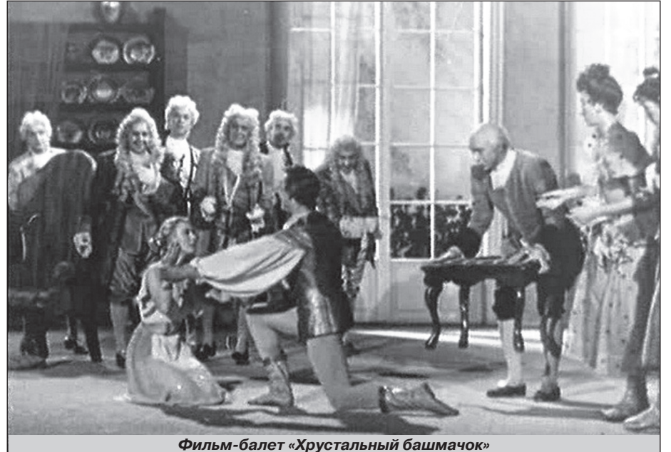
Фильм-балет «Хрустальный башмачок»

Недаром он утверждал, что именно такие фильмы нужны детям: