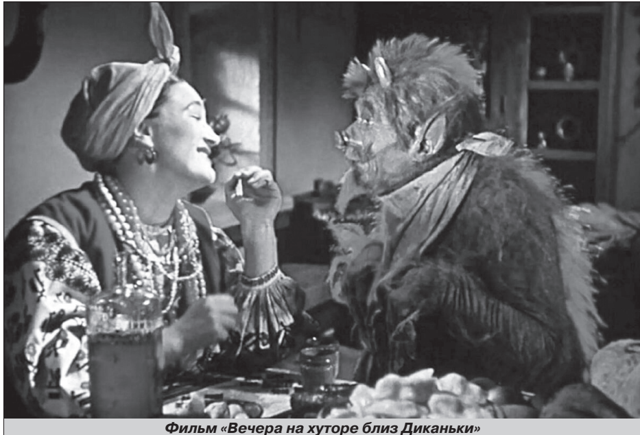
Фильм «Вечера на хуторе близ Диканьки»