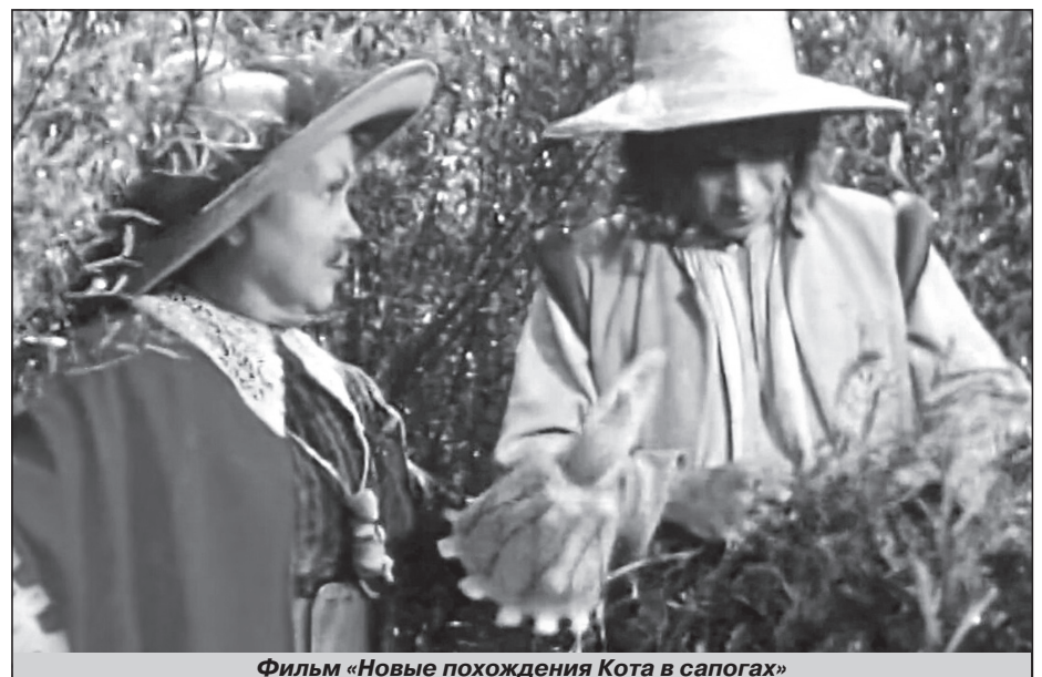
Фильм «Новые похождения Кота в сапогах»

В послевоенные годы приоритетным для бюджета было восстановление страны. Люди увлеченно отстраивали новую мирную жизнь на месте разрушенных городов и поселков. Финансирование кинематографа соответствовало духу