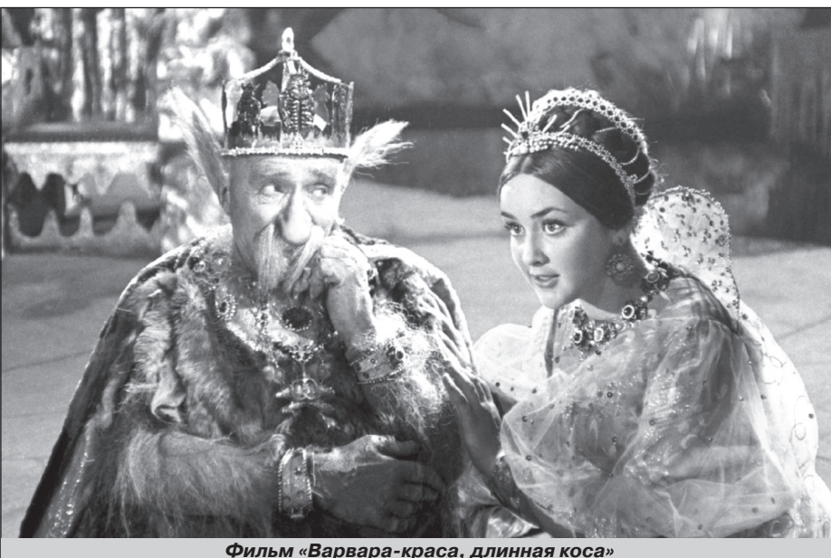
Фильм «Варвара-краса, длинная коса»

фильмов, в том числе, и сказок. Но картины Александра Роу остались неизменными, став отдельной эпохой.