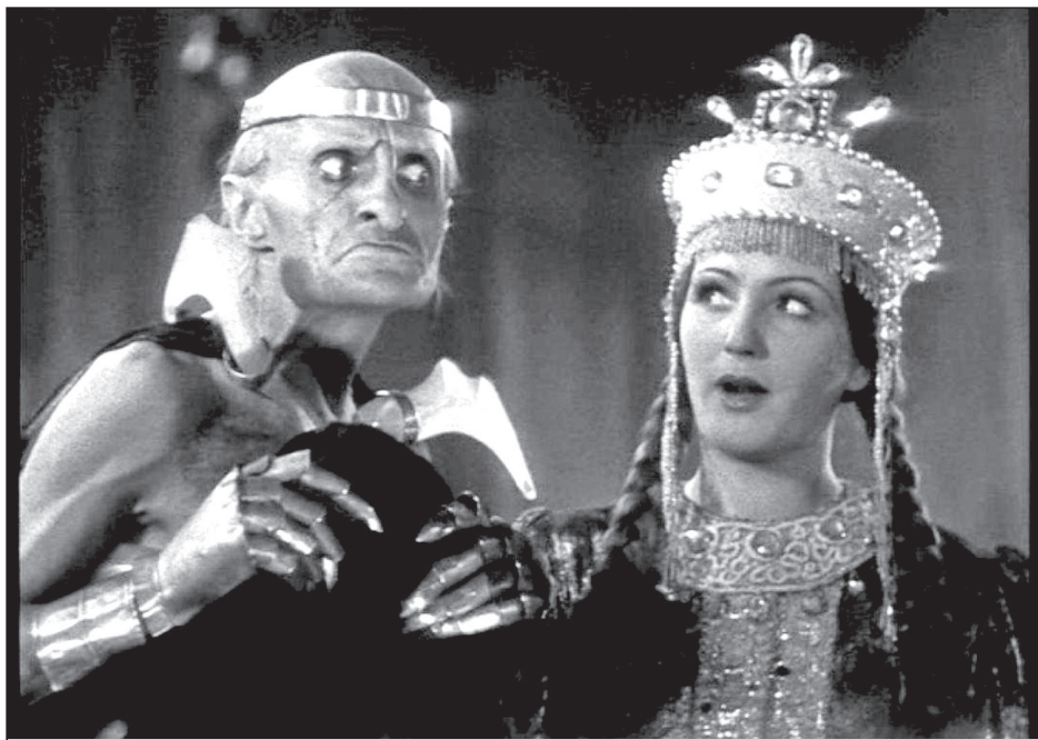
Фильм «Кашей Бессмертный»