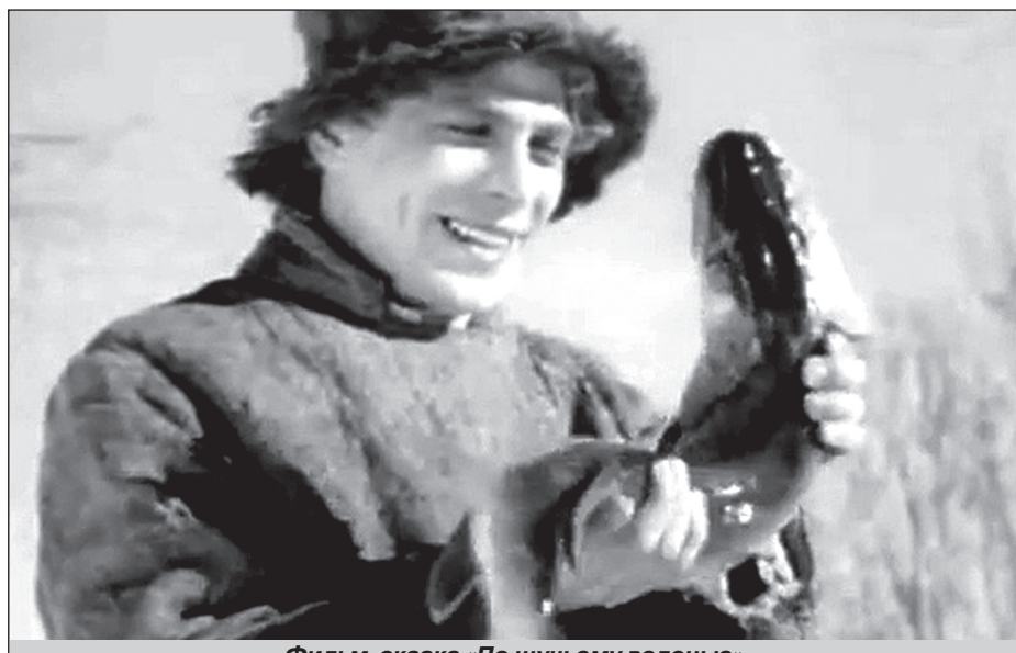
Фильм-сказка «По щучьему велению»

Рассказ о вечной борьбе добра со злом был актуален в трудное военное время.