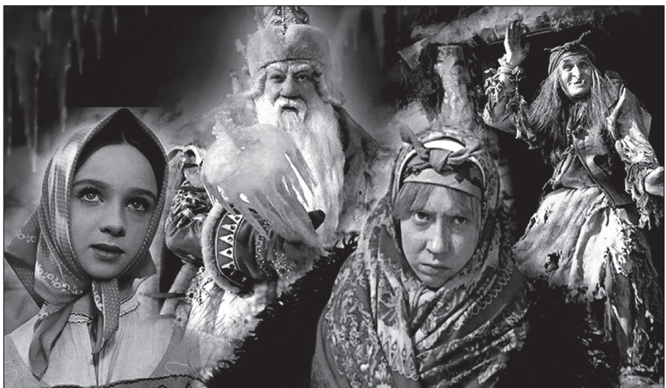
Главные персонажи фильма «Морозко»

ным. Он умудрялся договориться со всеми, достать все необходимое, уладить любой конфликт. Александр Артурович одинаково легко находил общий язык и с маститыми актерами, и с работниками массовки. В то же время Роу, как губка, впитывает в себя все мастерские приемы и методы работы Протазанова, одновременно формируя вокруг себя круг друзей и единомышленников.