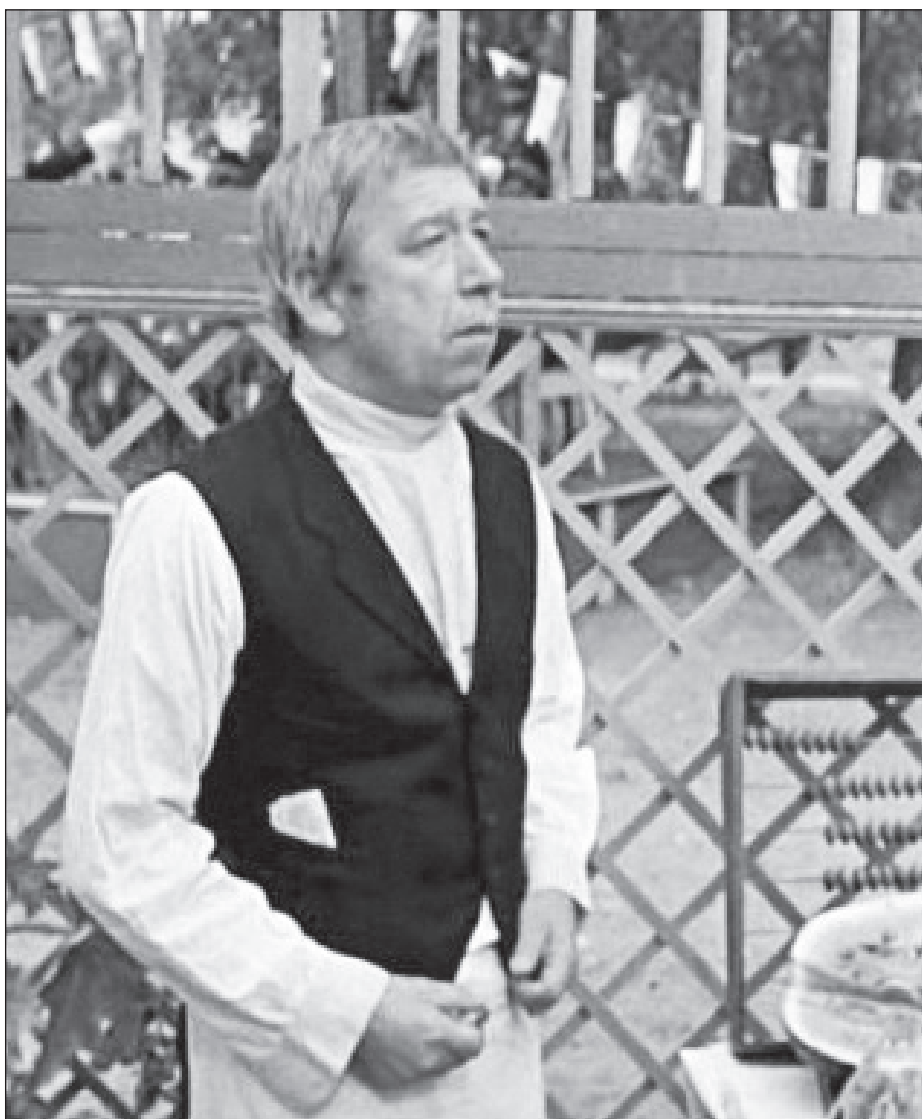
В фильме «Жестокий романс» (1984)