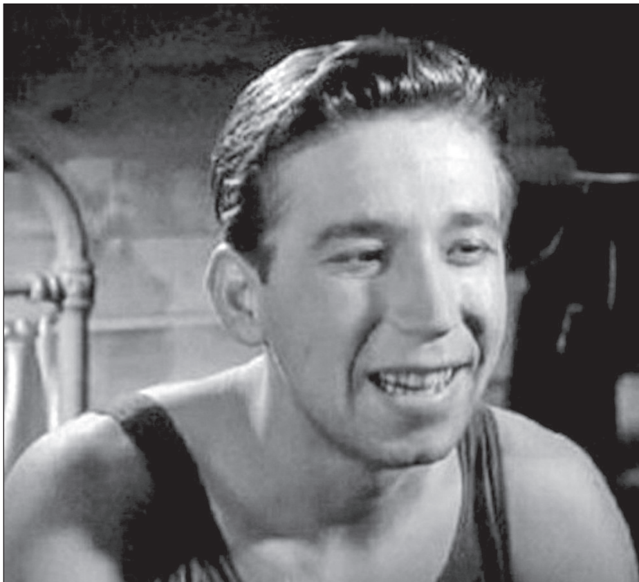
В фильме «Цветок на камне» (1962)