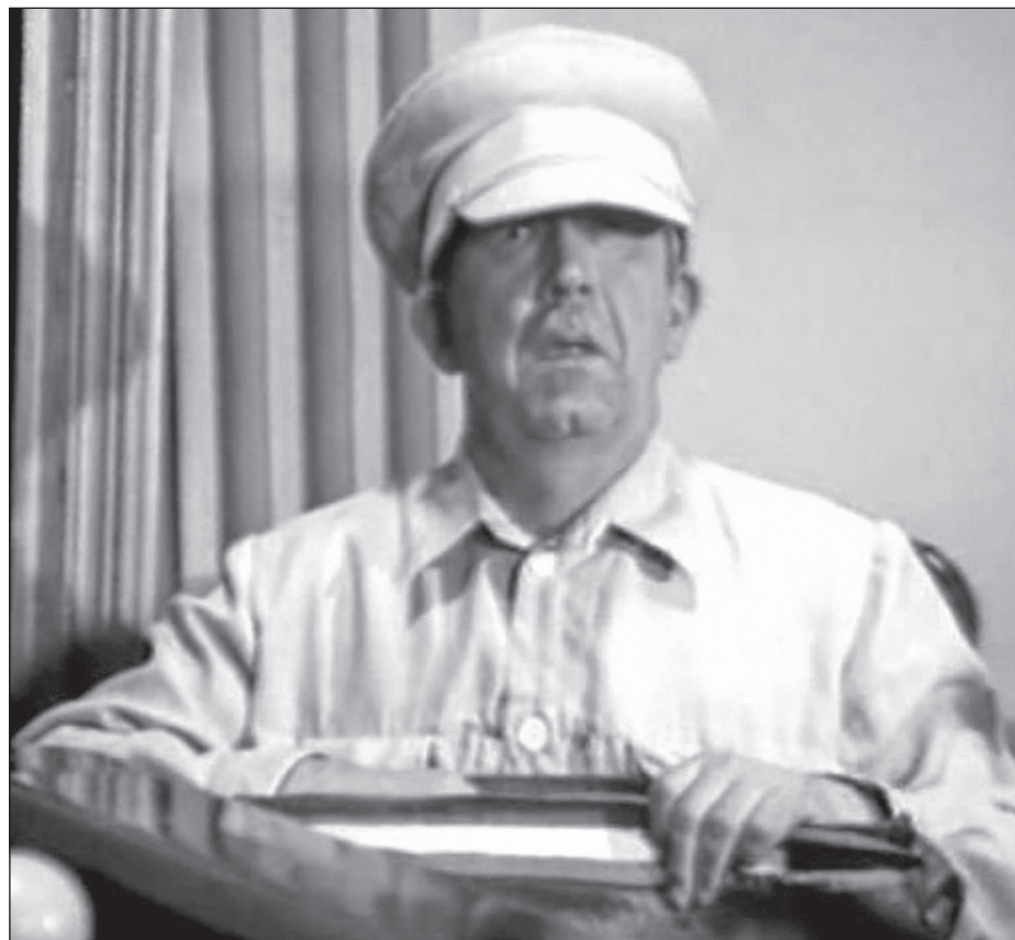
В фильме «Светлая личность» (1989)

Страна развалилась, а вместе с ней рухнула и киноиндустрия. В украинском кино денег практически не было, но какие-то картины ставили, и Брондуков работал за еду. Но к концу 1990-х работы совсем не стало. Он приходил на Бессарабский рынок, чтобы попросить кости для своих собак. Его узнавали, и вместо костей под-