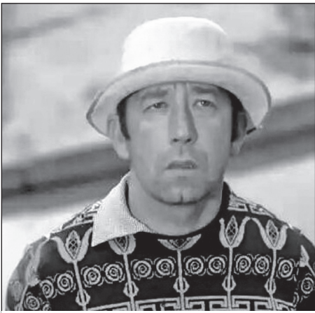
В фильме «Афоня» (1975)