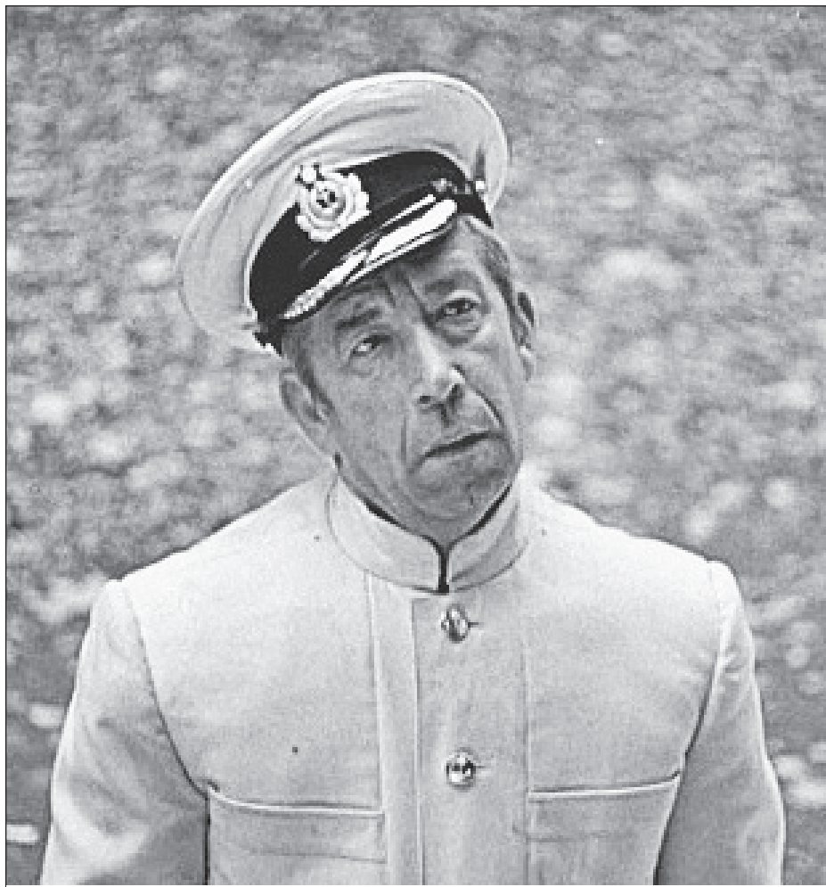
В фильме «Мы из джаза» (1983)

Брондуков упорно пытался восстановить речь, но ежедневные занятия с логопедом результата не дали. Сниматься он продолжал, но его герои говорили не его голосом.