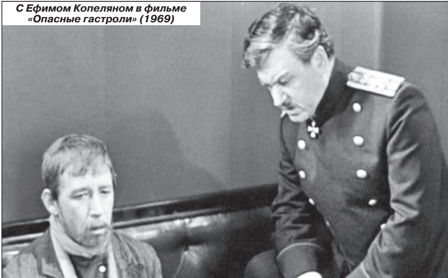
С Ефимом Копеляном в фильме «Опасные гастроли» (1969)

его не пустили в ресторан, где снимали один из эпизодов.