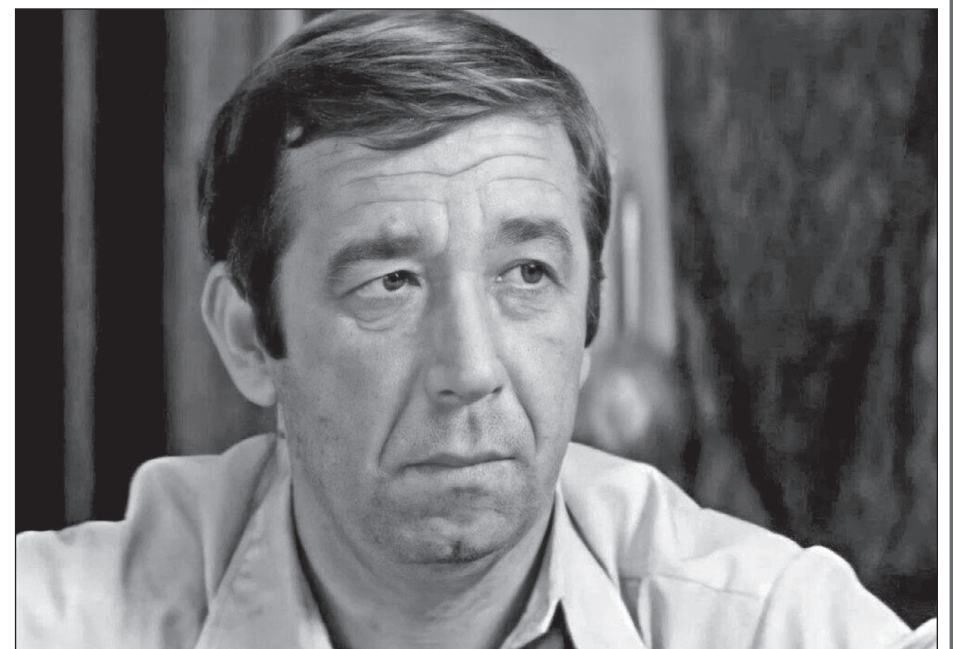
В фильме «Вас ожидает гражданка Никанорова» (1978)

Во время работы над «Гаражом» отношения у них сложились далеко не безоблачные: Брондуков считал, что играть нужно иначе, а Рязанов не уступал, но,