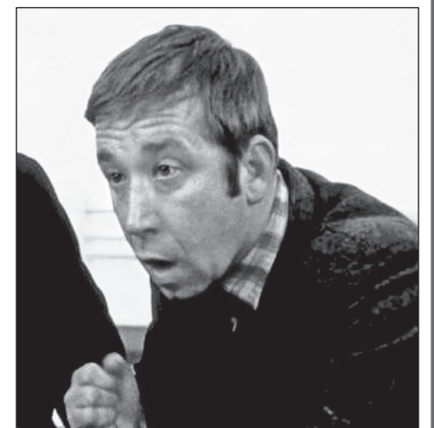
В фильме «Здравствуй и прощай» (1972)

После первого инсульта Брондуков на некоторое время совсем перестал пить, но когда более-менее пришёл в себя, стал пропускать рюмку-другую.