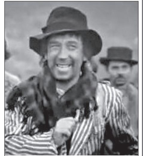
В фильме «Табор уходит в небо» (1976)

Брондуков почти всегда импровизировал на съёмках. Иногда режиссёры эти вольности пресекали на корню, а иногда шли на поводу у актёра, чтобы он не придумал чего-нибудь похлеще.