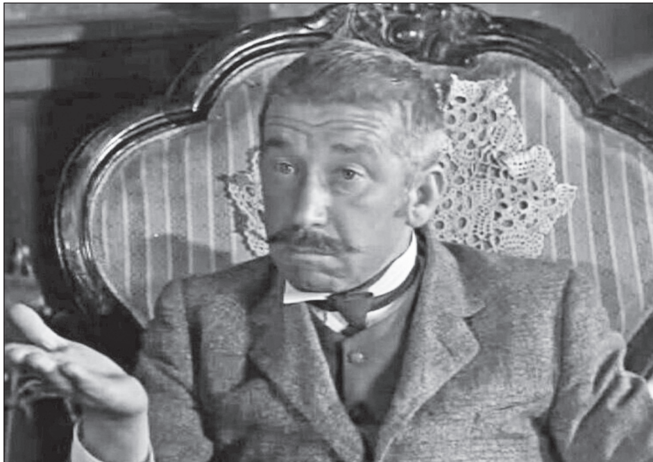
В фильме «Приключения Шерлока Холмса и доктора Ватсона» (1979-1986)

Роль была много, но все они были чуть длиннее эпизода. Лишь в 1977-м