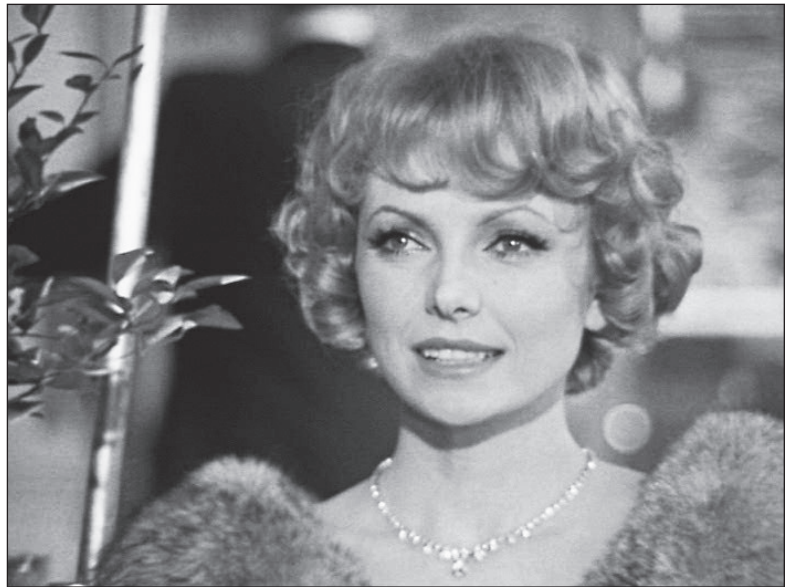
В фильме «Крах инженера Гарина» (1973)