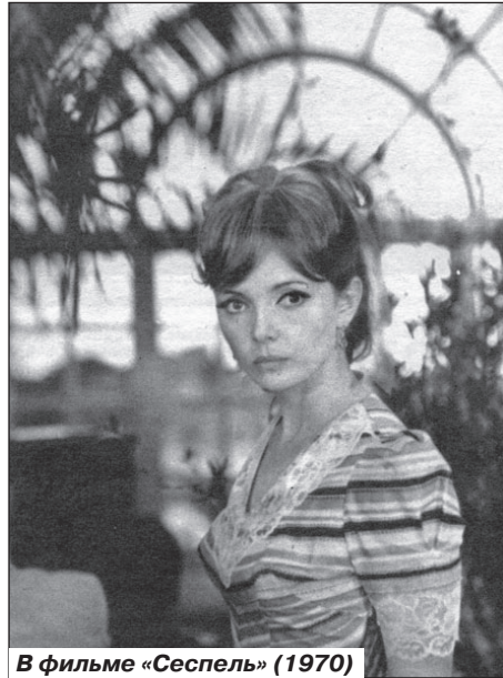
В фильме «Сеспель» (1970)

Нонна Николаевна Терентьева (девичья фамилия Новосядлова) родилась в феврале 1942 года в Баку. Папа артистки, военный, дал дочери звучное имя, в котором заключалось три буквы «Н», как и в получившихся инициалах. Знаменитость росла творческим ребенком, что неудивительно. Мама служила актрисой, и маленькая Нонна имела перед глазами пример для подражания.