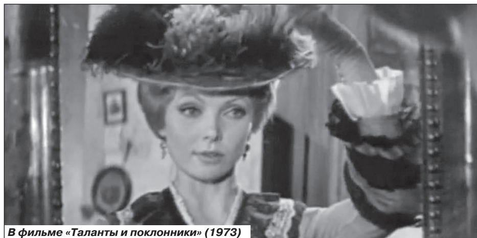
В фильме «Таланты и поклонники» (1973)