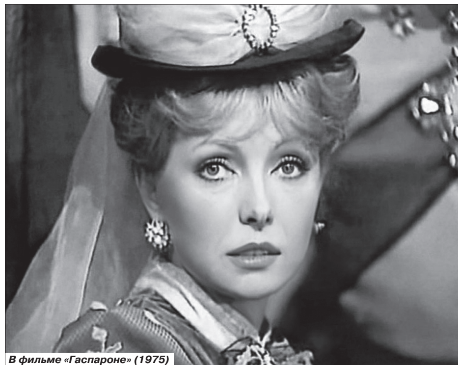
В фильме «Гаспароне» (1975)