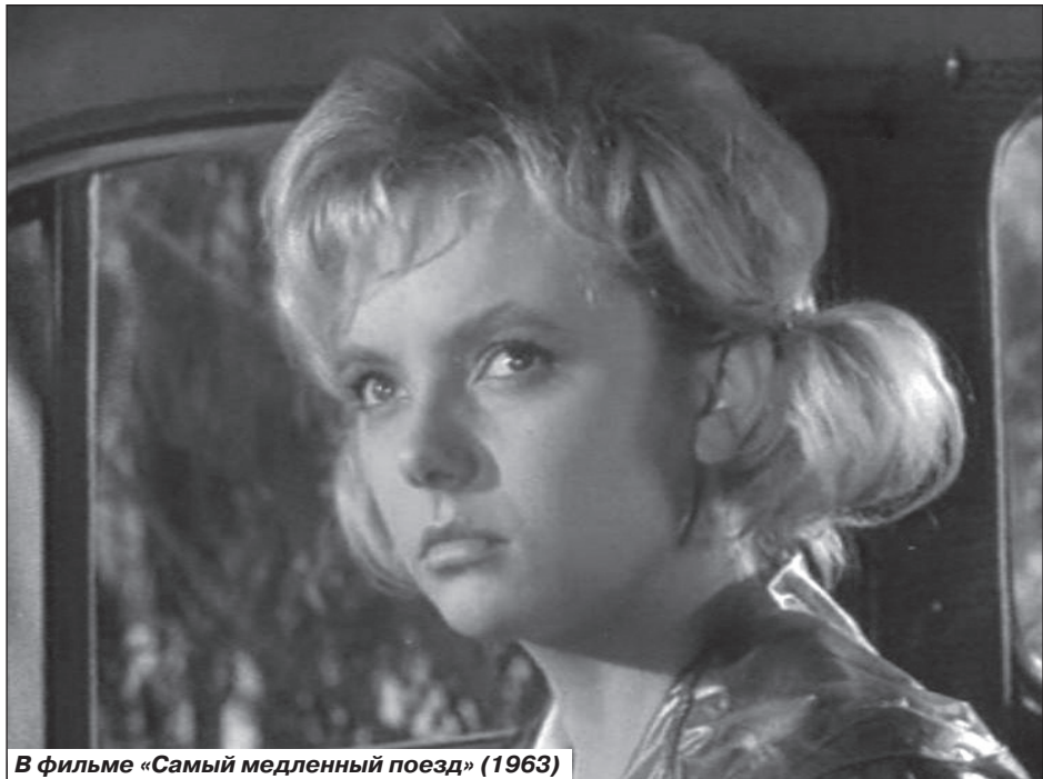
В фильме «Самый медленный поезд» (1963)