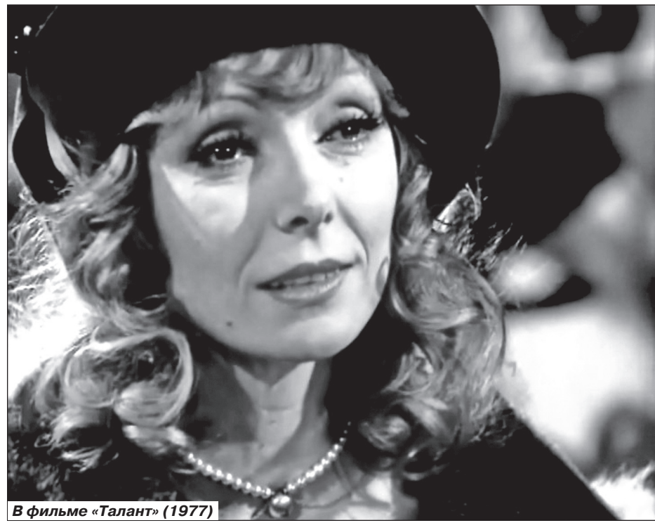
В фильме «Талант» (1977)