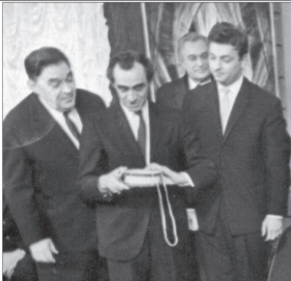
Леонид Утёсов, Зиновий Гердт, Николай Гриценко и Михаил Державин, телепередача «Театральные встречи. В гостях у Леонида Утёсова», 1966

дружеских отношениях, но браки исчерпали себя, поэтому их «роман никому не причинил боли».