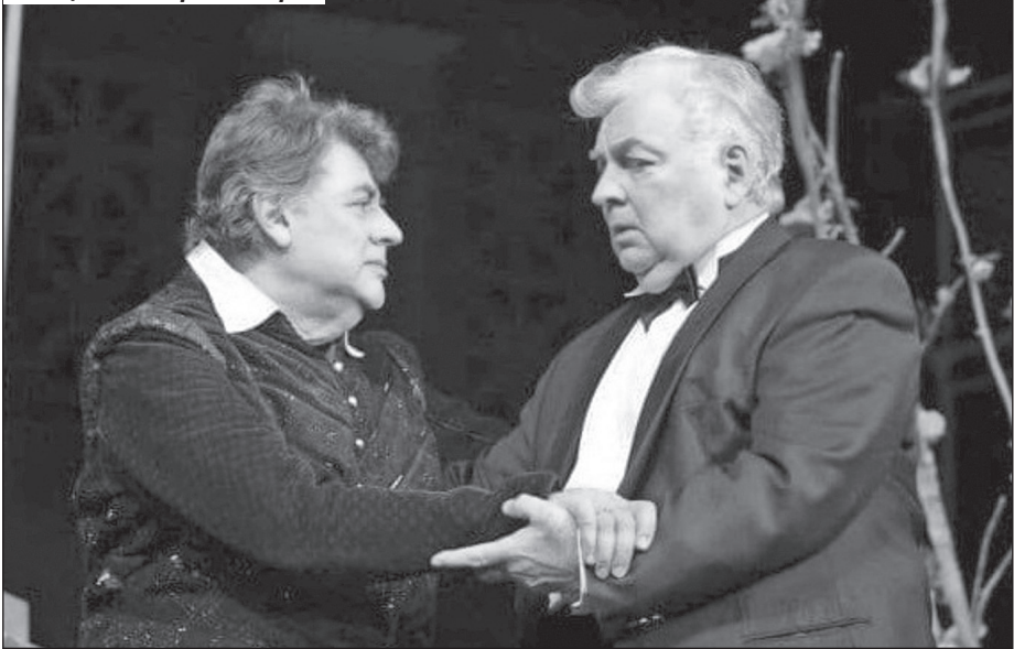
На сцене Театра Сатиры