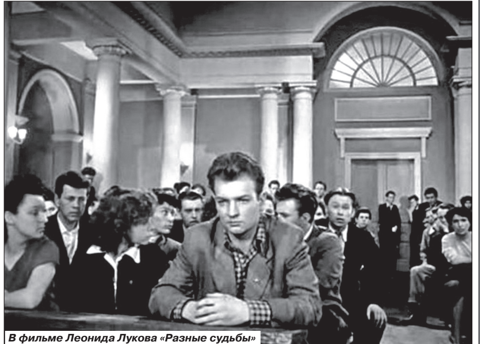
В фильме Леонида Лукова «Разные судьбы»

Когда в 1951-м умер отец, Михаилу было всего пятнадцать. Чтобы помочь