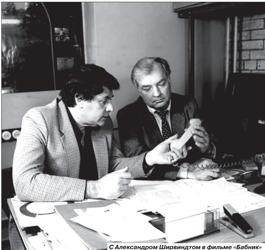
С Александром Ширвиндтом в фильме «Бабник»

- Ты даже не представляешь, какой я плохой могу быть! Просто, не люблю я быть таким, сдерживаюсь. Если вдруг кто-то нахамит, нагрубит, поворачива-