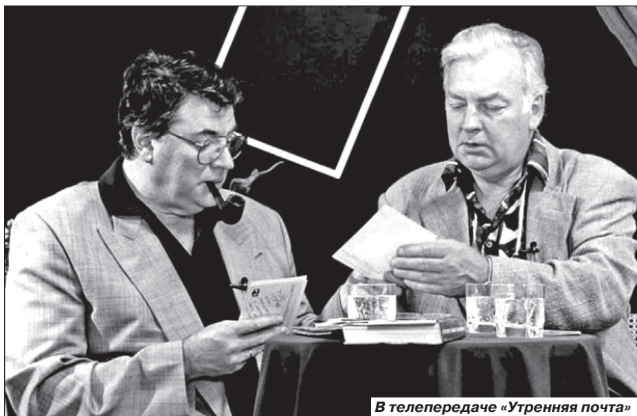
В телепередаче «Утренняя почта»

Картину снимали в экстремальных условиях: актерам приходилось нырять в Неман, изображавший Темзу, в ноябре. Актеры активно грелись, и не только горячей водой, так что в некоторых сценах они действительно пьяны.