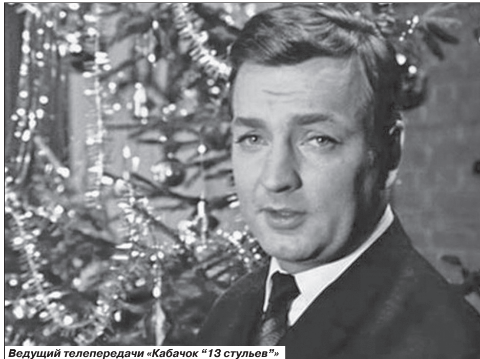
Ведущий телепередачи «Кабачок "13 стульев"»

Первый раз артист женился еще в студенческие годы: 21-летний Михаил влюбился в 19-летнюю однокурсницу Катю, дочь Аркадия Райкина. Когда приезжал в столицу знаменитый папа, то всегда останавливался в гостинице «Москва».