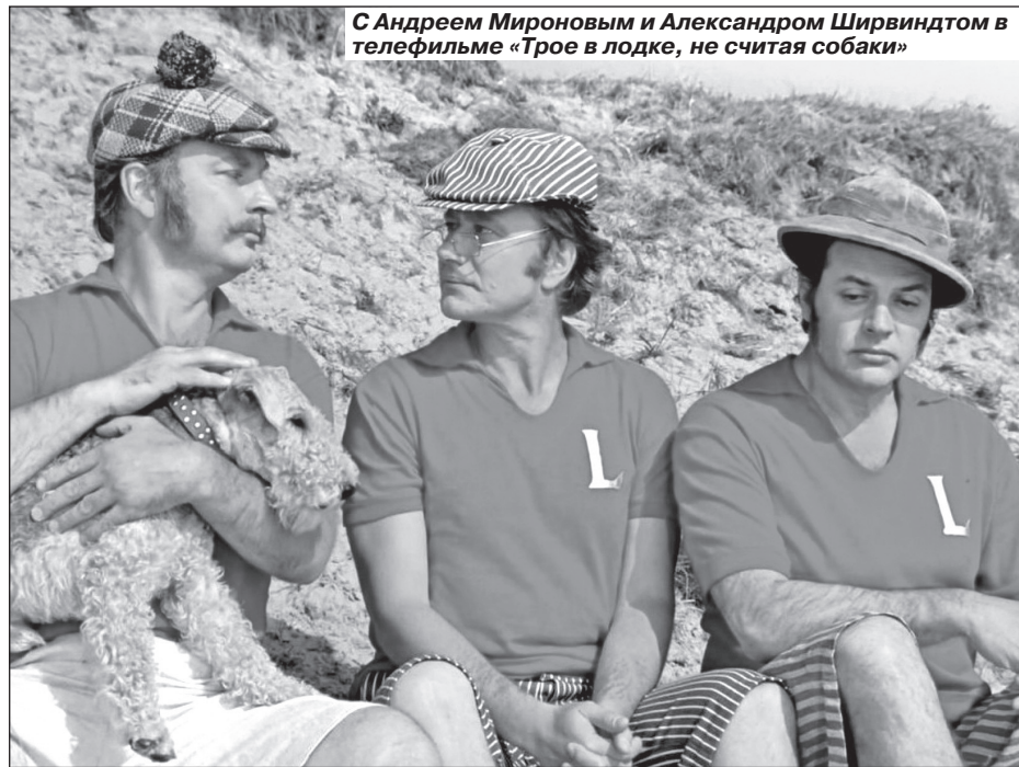
С Андреем Мироновым и Александром Ширвиндтом в телефильме «Трое в лодке, не считая собаки»

Третий брак артиста оказался самым продолжительным. С супругой Роксаной Бабаян, которую он называл Рокочкой, Михаил Михайлович жил с 1980 года. Они познакомились во время гастролей. На тот момент оба были в су-