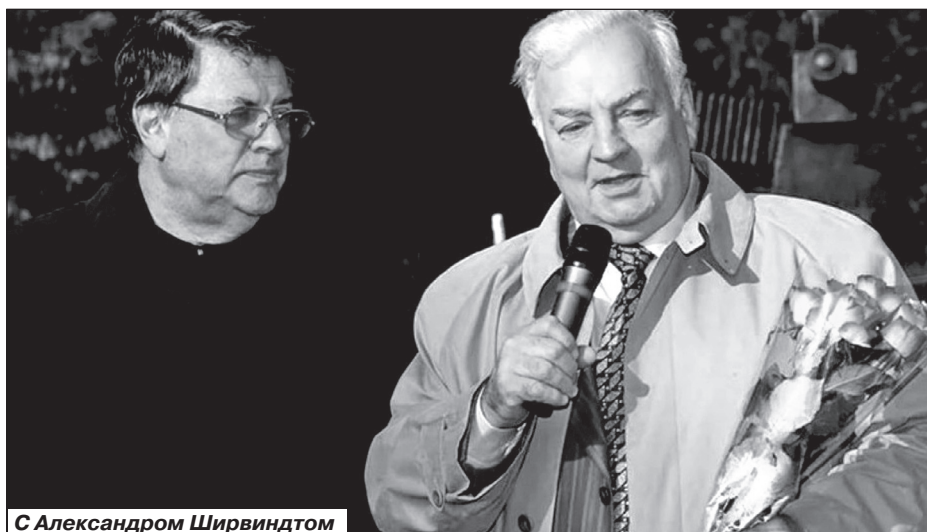
С Александром Ширвиндтом

армии! А позже меня захватил в плен Театр сатиры. Вскоре туда пришел мой друг Александр Анатольевич Ширвиндт. Вот мы вместе и работаем. Я уже под его началом. Он - художественный руководитель театра, а у него простой старательный артист.