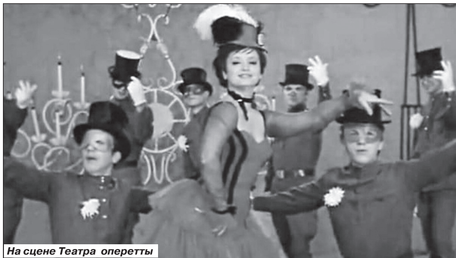
На сцене Театра оперетты