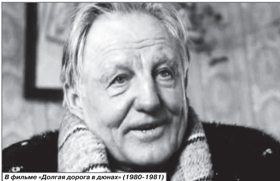
В фильме «Долгая дорога в дюнах» (1980-1981)

На могиле актёра выбита справедливая надпись: «Николай Крюков. Истинно народный».