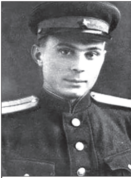
Во время службы в армии