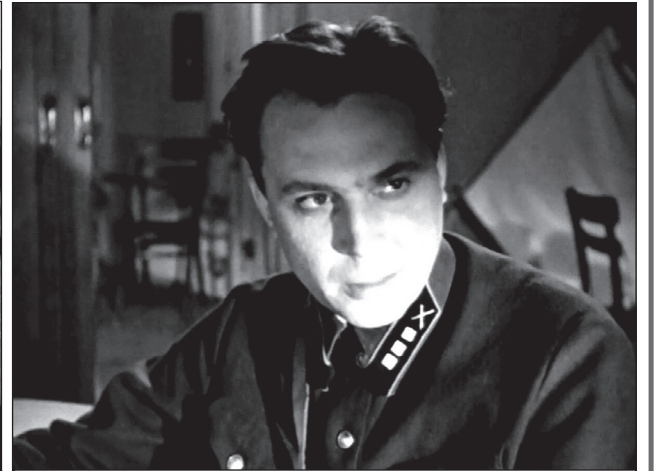
В фильме «Дом, в котором я живу»