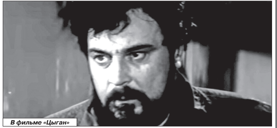
В фильме «Цыган»

В 1941 году 19-летний Матвеев пришел в военкомат, чтобы попасть на фронт. Его направили на учебу в Тюмен-