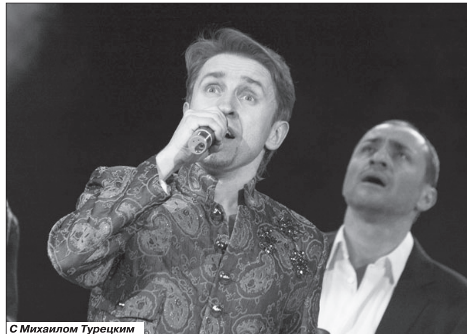
С Михаилом Турецким