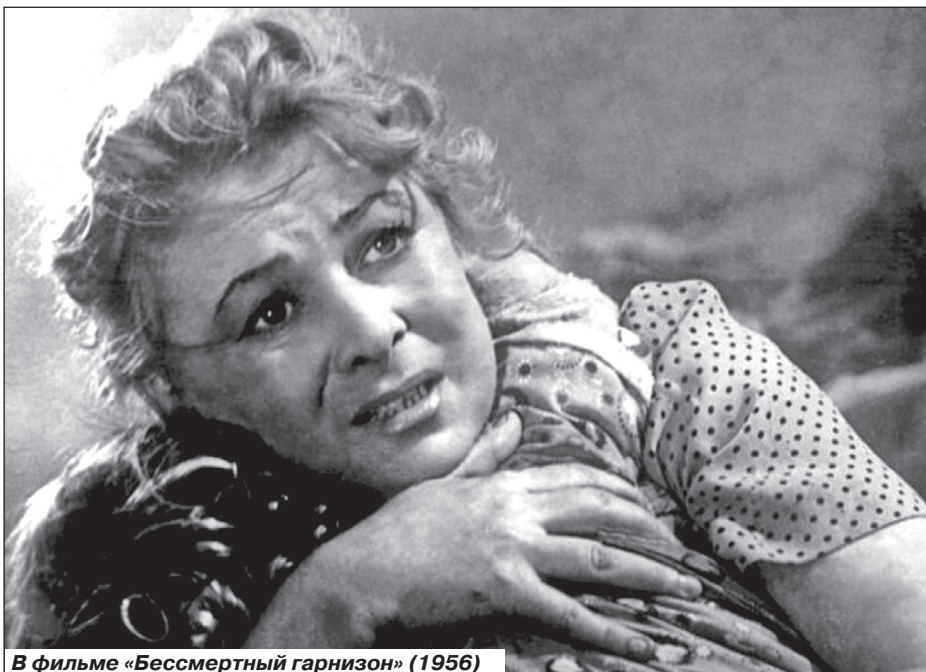
В фильме «Бессмертный гарнизон» (1956)

лицо, ставшее знаменем 1940-х годов, а в гробу лежала измученная женщина, совсем непохожая на ту, что была на портрете.