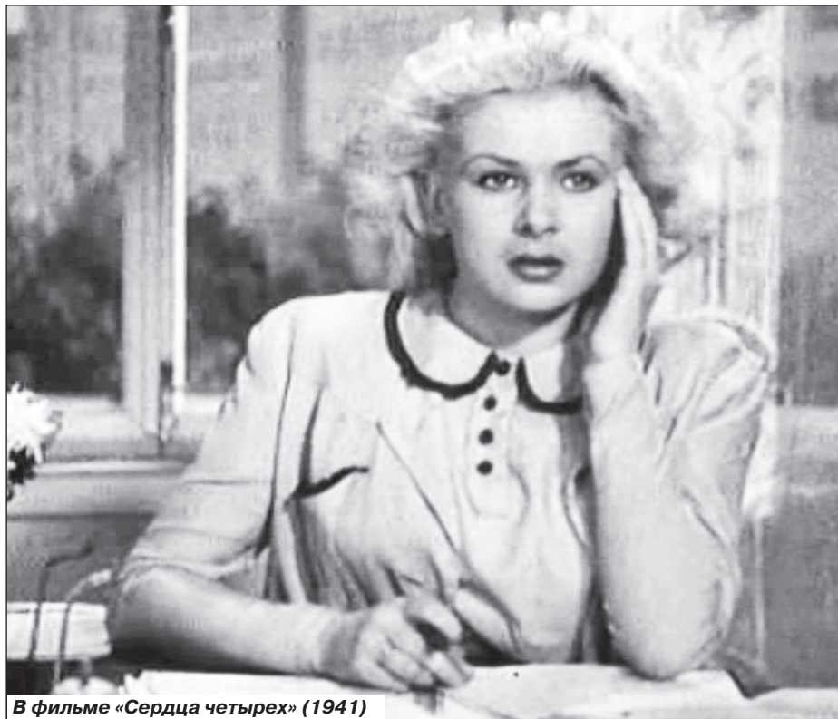
В фильме «Сердца четырех» (1941)