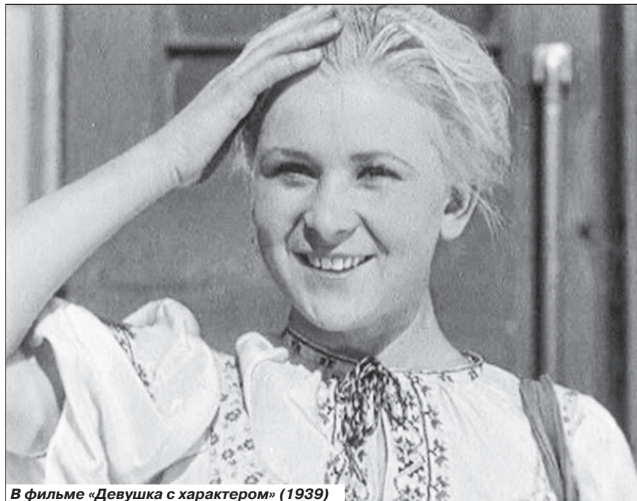
В фильме «Девушка с характером» (1939)