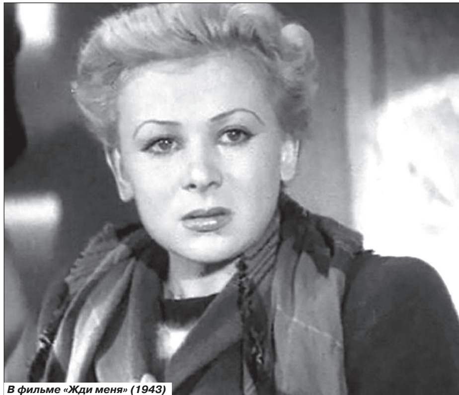
В фильме «Жди меня» (1943)