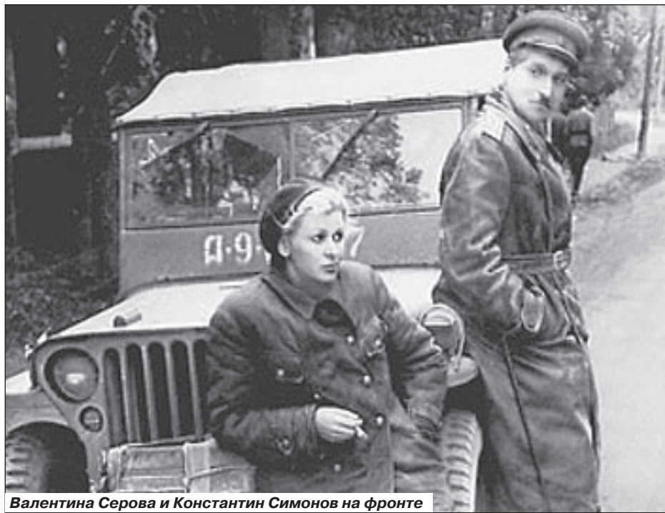
Валентина Серова и Константин Симонов на фронте

Страсть? Да, конечно. Но опять-таки, вопреки расхожим представлениям, не только ночь и постель связывали этих двоих. Страсть, как жажда, проходит после утоления. Просто красивая, просто сексапильная женщина вряд ли стала бы единственной для такого человека, как Константин Симонов. Он