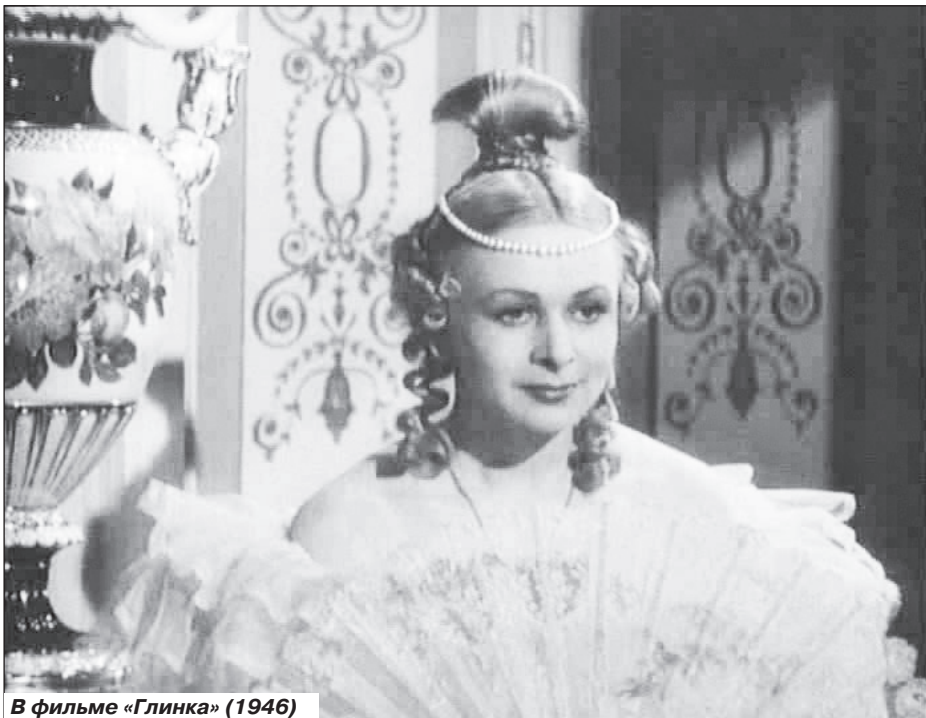
В фильме «Глинка» (1946)