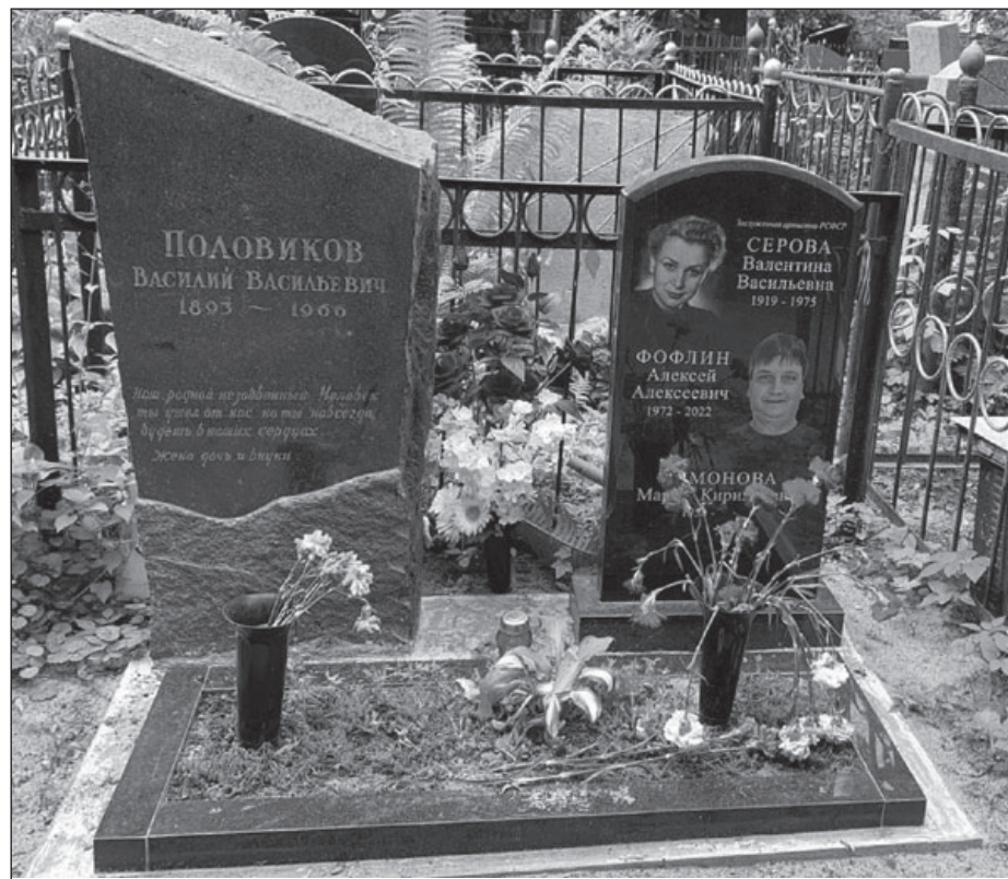
Памятник на могиле Валентины Серовой на Головинском кладбище Москвы