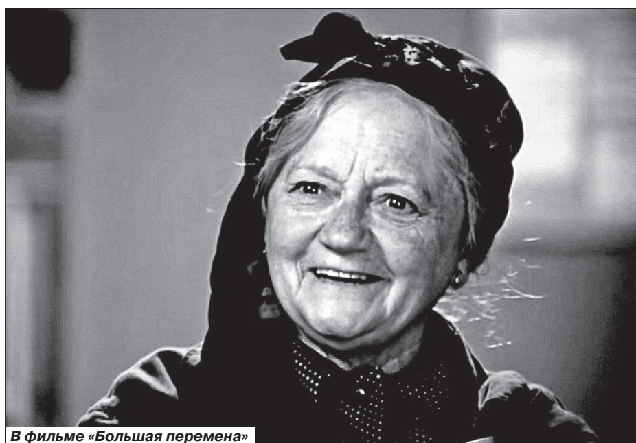
В фильме «Большая перемена»

тире. Особенно ее прославила очень популярная в 1940-1970-е годы детская передача «Клуб знаменитых капитанов», где актриса исполняла роль Дика Сенда из «Пятнадцатилетнего капитана» Жюль Верна.