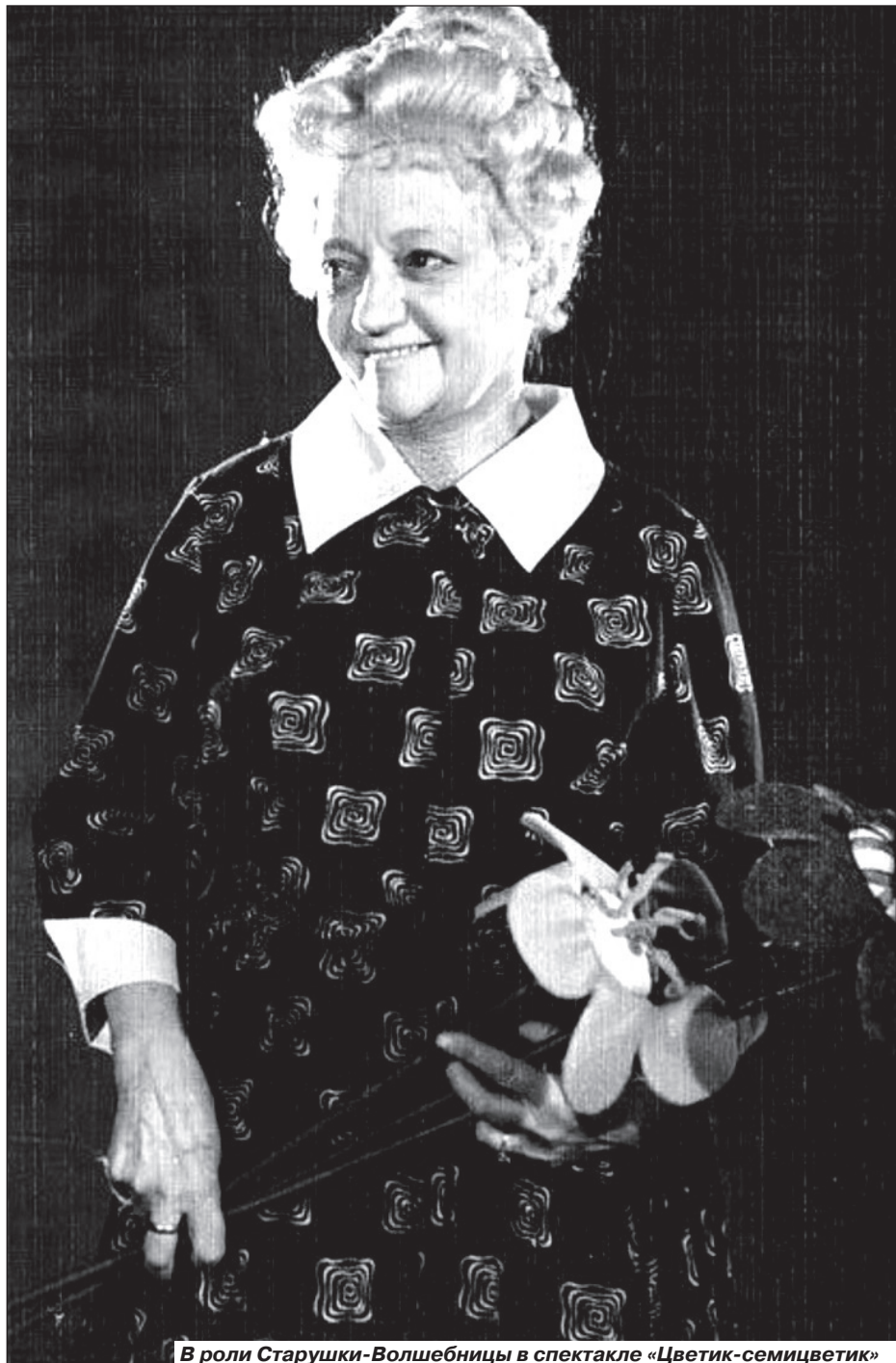
В роли Старушки-Волшебницы в спектакле «Цветик-семицветик»