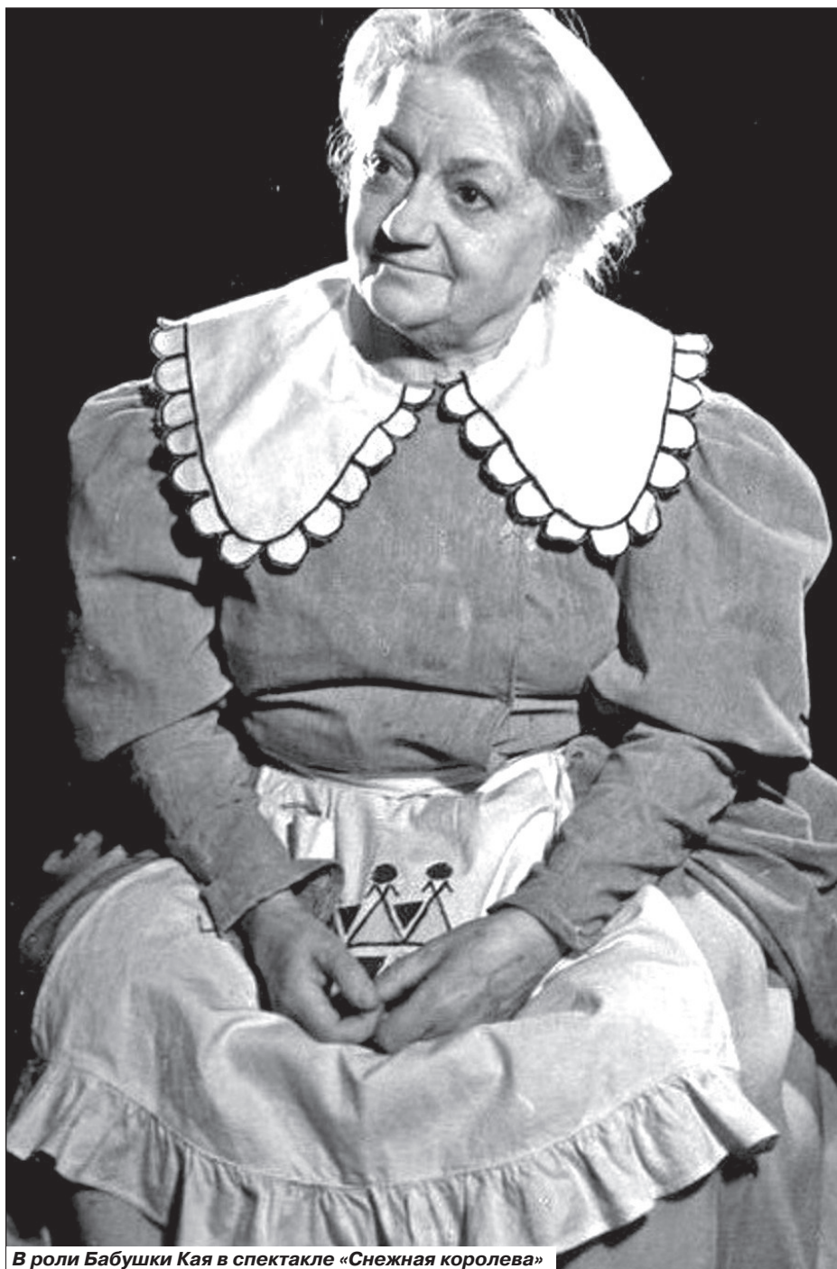
В роли Бабушки Кая в спектакле «Снежная королева»