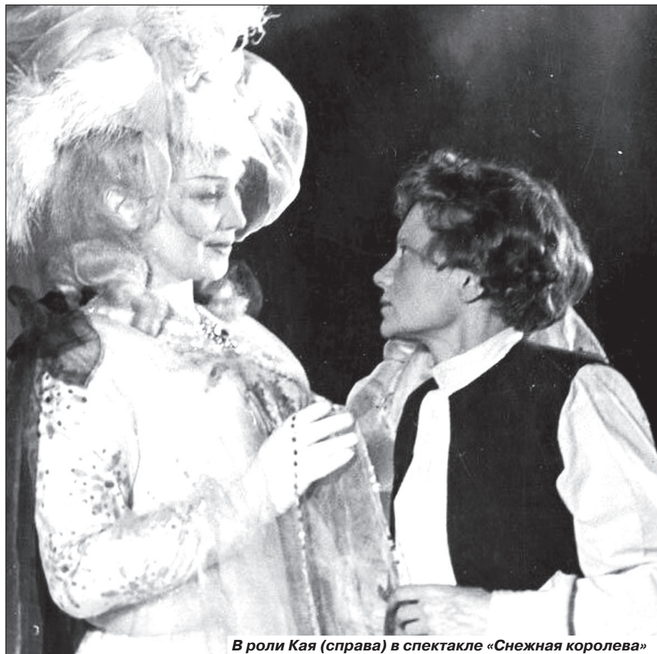
В роли Кая (справа) в спектакле «Снежная королева»