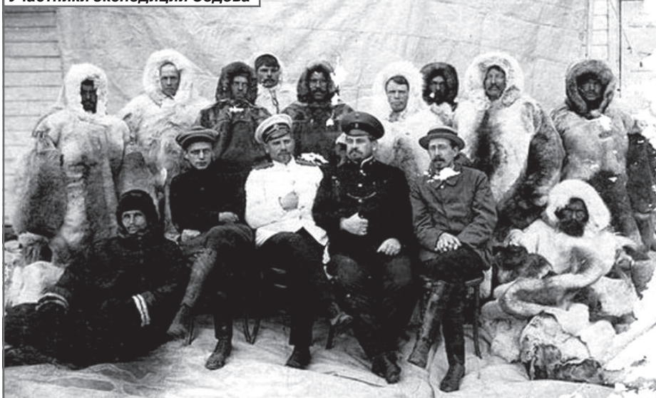
Участники экспедиции Седова