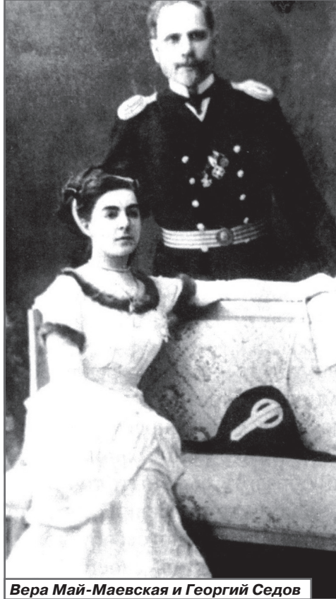
Вера Май-Маевская и Георгий Седов