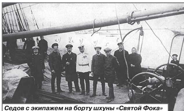
Седов с экипажем на борту шхуны «Святой Фока»