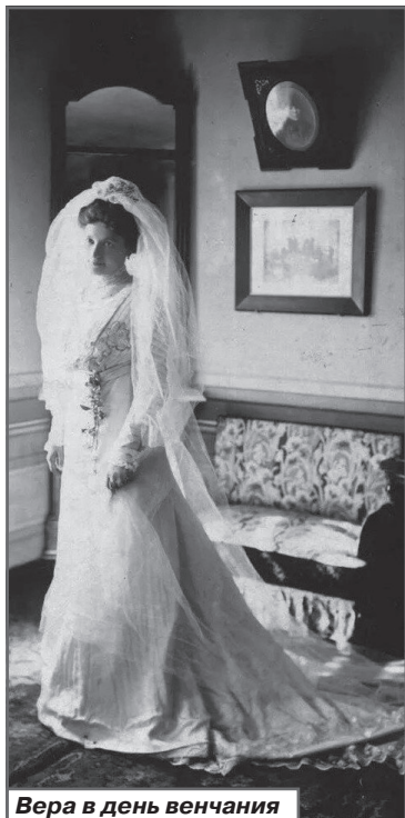
Вера в день венчания