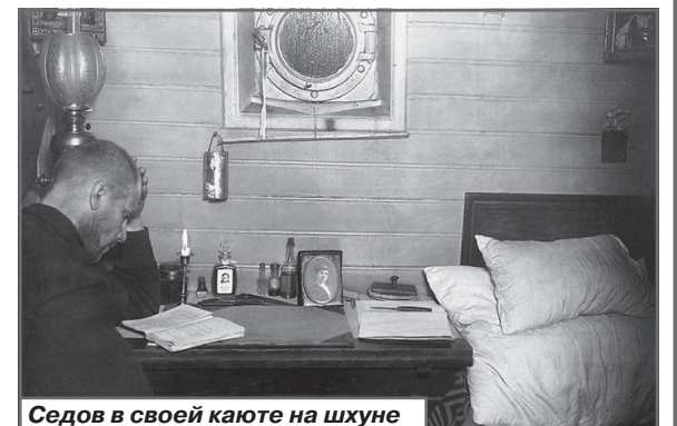
Седов в своей каюте на шхуне