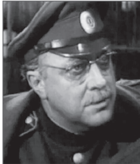
Владислав Стржельчик в образе Владимира Зеноновича Ковалевского в телефильме «Адъютант его превосходительства»