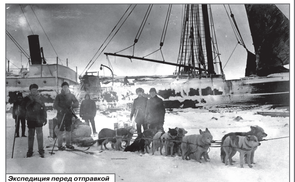
Экспедиция перед отправкой