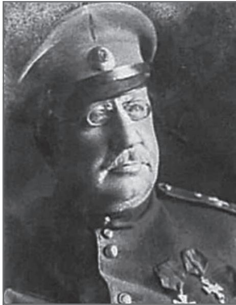
Владимир Зенонович Май-Маевский