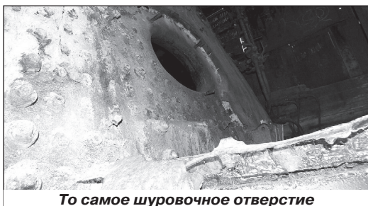
То самое шуровочное отверстие

А о размерах шуровочного отверстия, через которое в топку забрасывают уголь, вы можете составить представление сами, взглянув на фото.