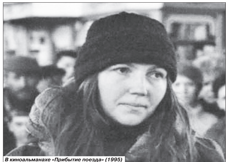
В киноальманахе «Прибытие поезда» (1995)

песни, но выбирать их нужно очень тщательно, ведь педагог, который поет народную песню, должен быть и сам одаренным и духовным человеком.