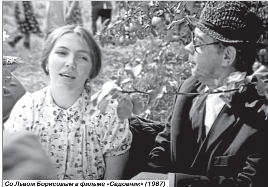
Со Львом Борисовым в фильме «Садовник» (1987)

только две маленькие иконки, при этом я знала, что это наше самое главное богатство. Когда была у бабушки на летних каникулах в Новосибирске, мне захотелось покреститься. Я была поражена красотой храма, и ещё мне очень хотелось получить крестик. Так к той радости, которую дарят лето, каникулы, добавилась ещё одна - крещение. В моём детском сознании с посещением храма были связаны очень яркие, ни на что не похожие впечатления. Мне приоткрылся мир, наполненный совсем другими реалиями, он был для меня радостным и таинственным.