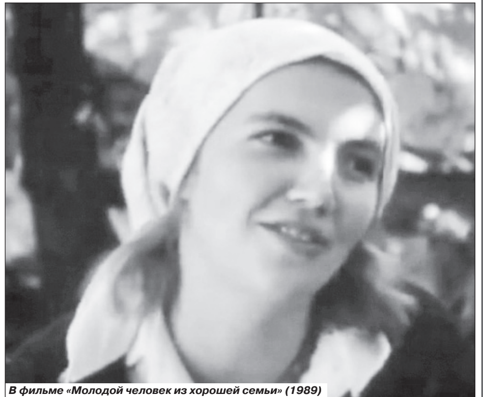
В фильме «Молодой человек из хорошей семьи» (1989)

- Это сделать очень сложно. Но если поинтересоваться, то можно узнать, что до сих пор есть фольклорные центры. Для детей есть кружки народной