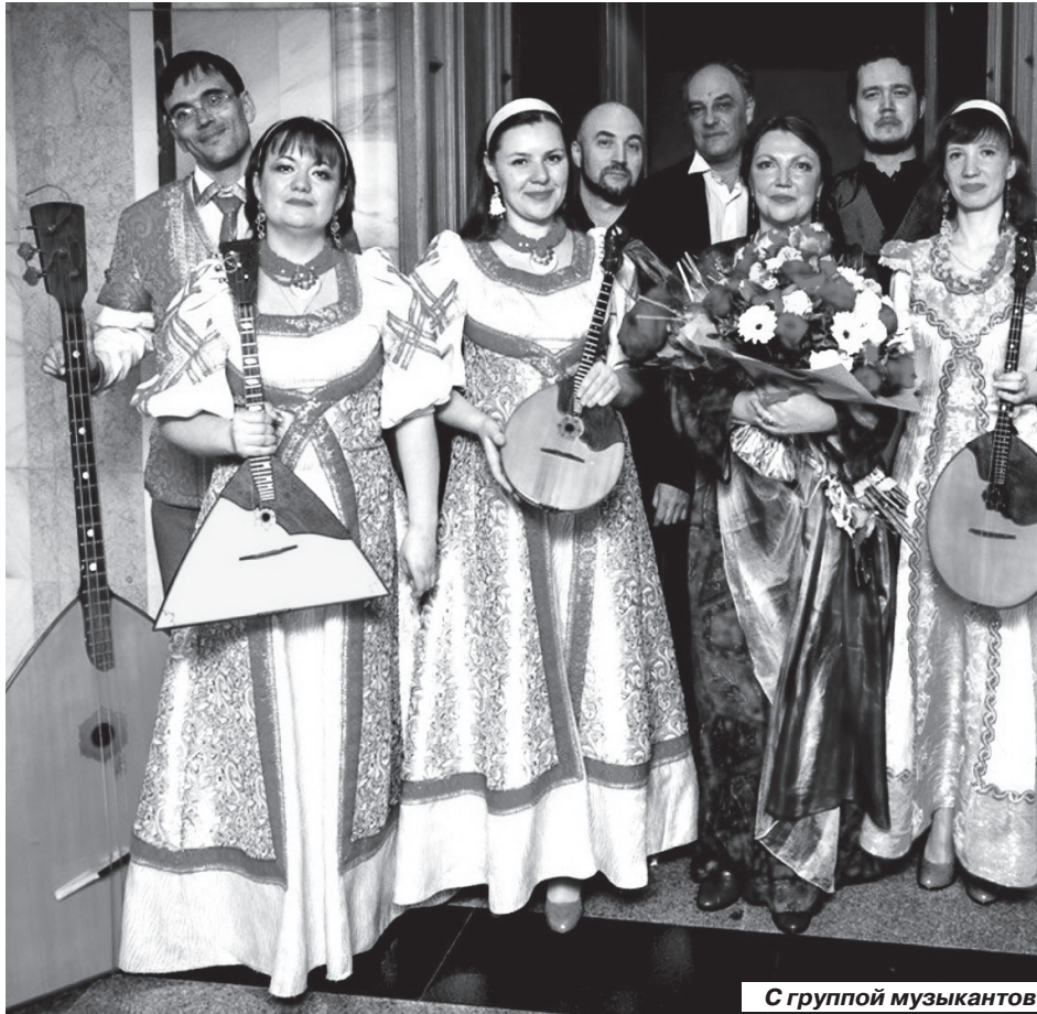
С группой музыкантов

- В советские времена никто особенно свою веру не манифестировал без необходимости. Дома у мамы были