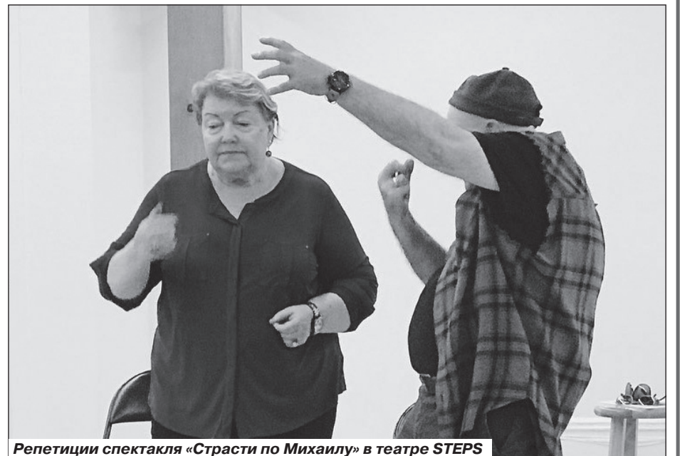
Репетиции спектакля «Страсти по Михаилу» в театре STEPS