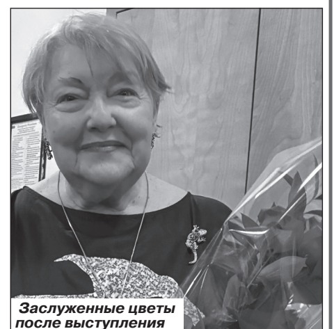
Заслуженные цветы после выступления