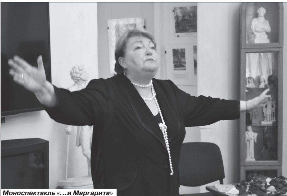
Моноспектакль «...и Маргарита»