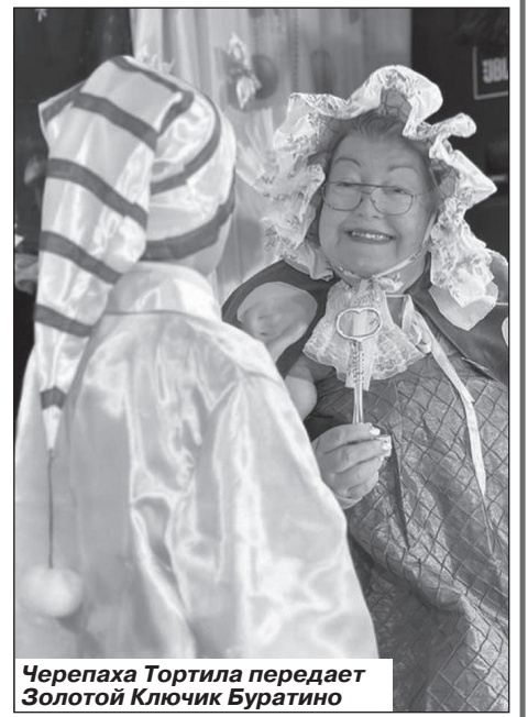
Черепаша Тортила передает Золотой Ключик Буратино