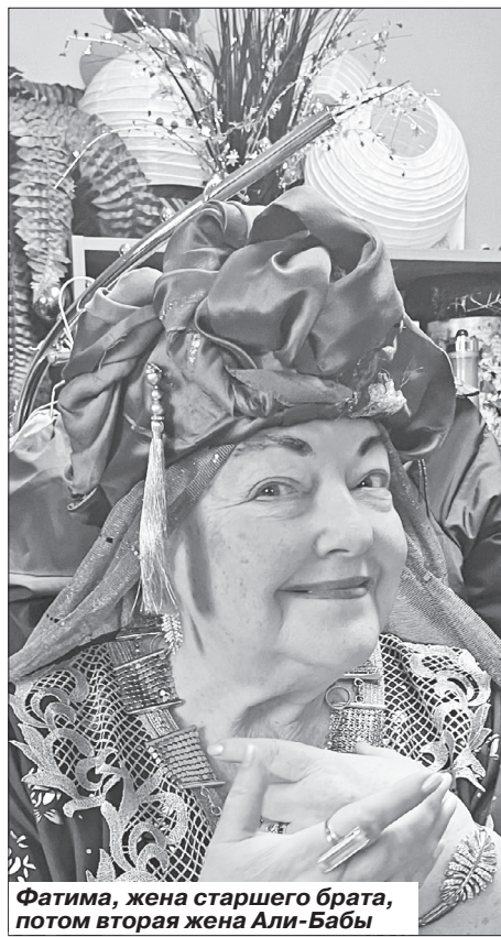
Фатима, жена старшего брата, потом вторая жена Али-Бабы