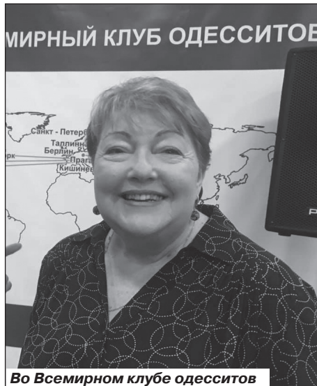
Во Всемирном клубе одесситов