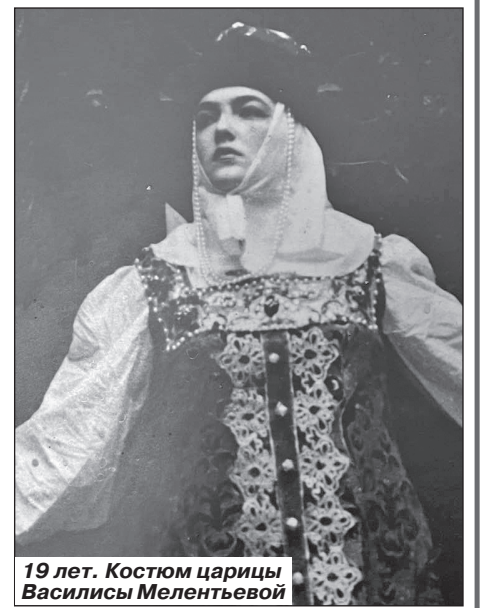
19 лет. Костюм царицы Василисы Мелентьевой