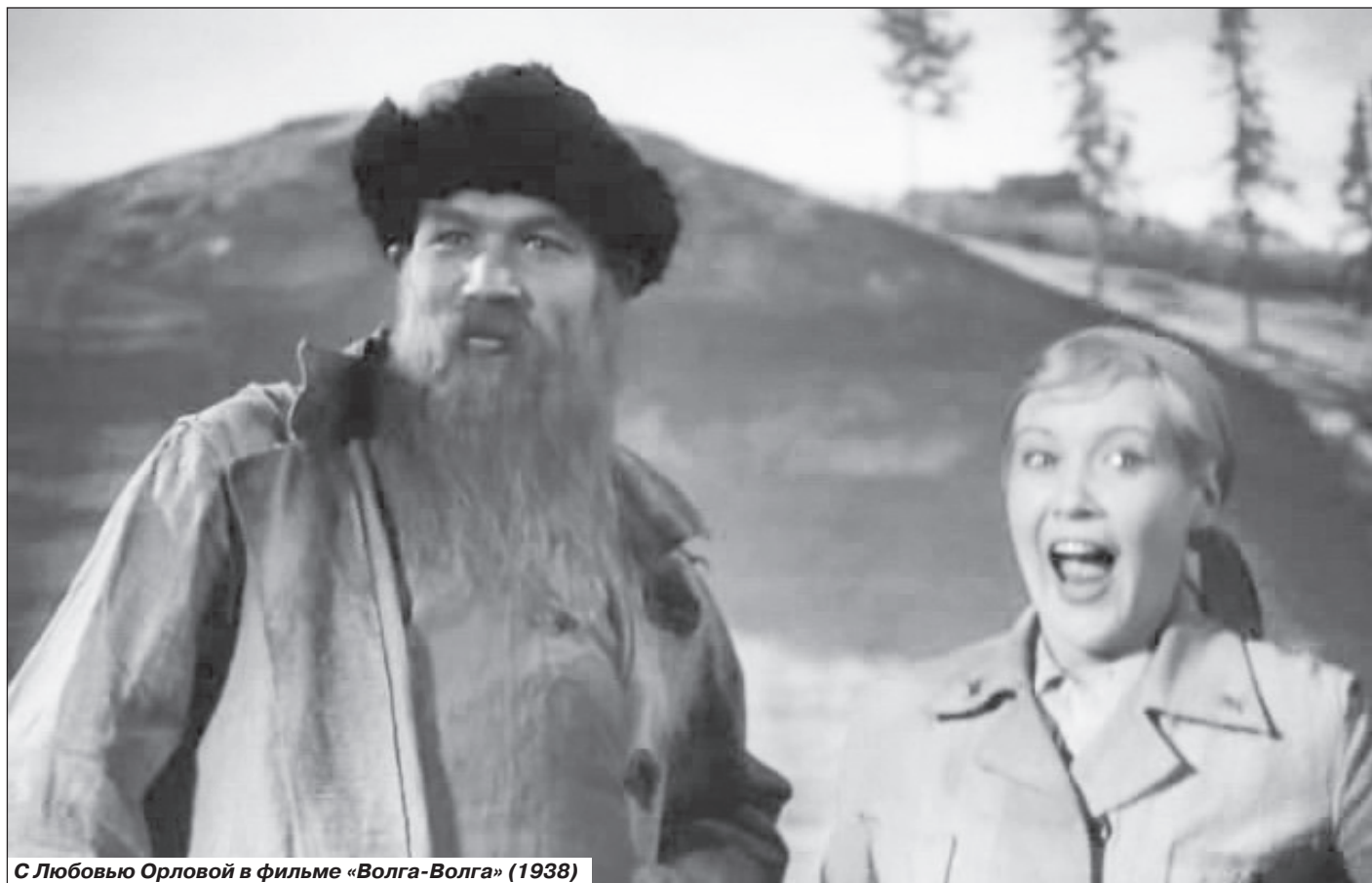
С Любовью Орловой в фильме «Волга-Волга» (1938)