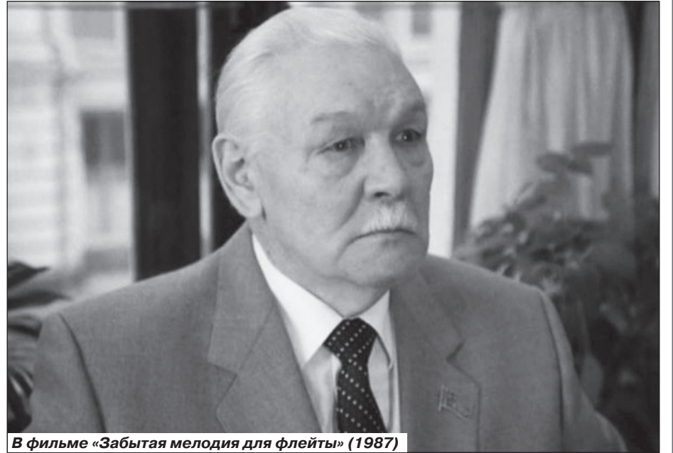
В фильме «Забывтая мелодия для флейты» (1987)

Это были люди одной кровеносной системы, сообщающиеся сосуды. Папа ей говорил: «Лида, я считаю, что всему, чего я в жизни добился, обязан тебе».