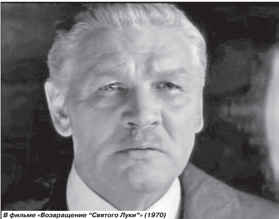
В фильме «Возвращение «Святого Луки»» (1970)

Василием Шукшиным, и очень гордился возникшей между ними дружбой и доверием.