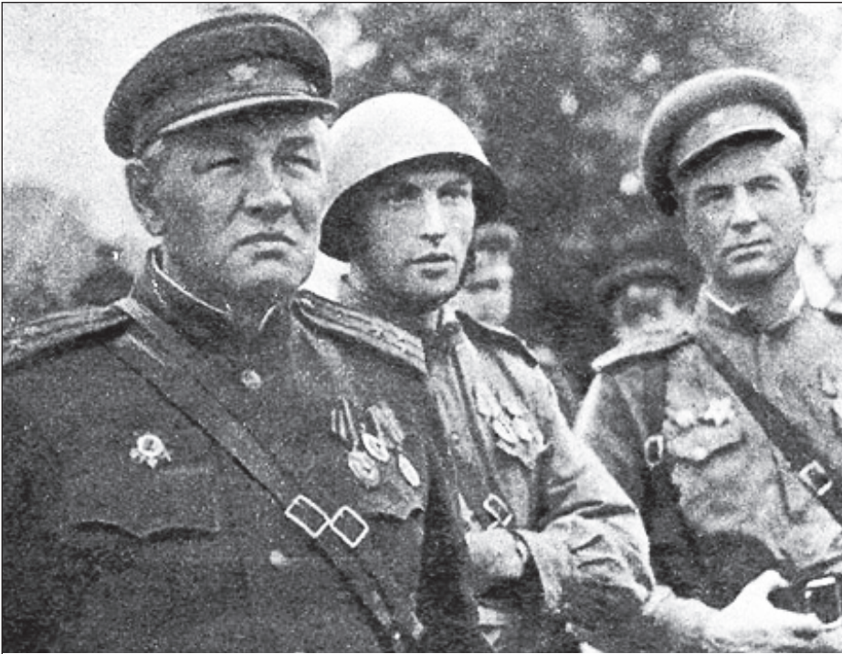
С Николаем Олялиным и Борисом Зайденбергом в киноэпопее «Освобождение» (1968-1971)

ной, работал осветителем. Потом ему доверили несколько слов со сцены сказать.