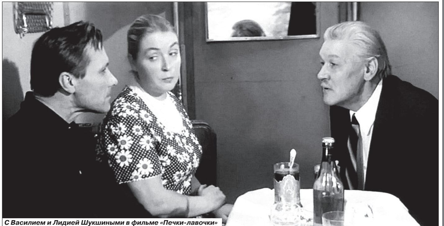
С Василием и Лидией Шукшиными в фильме «Печки-лавочки»

Папа писал домой родителям письма, что у него всё хорошо. Но жил он где-то в районе Собачьей площадки, поэтому адрес писал «До востребования». Не напишешь же «Собачья площадка», дома сразу скажут, что пропал парень. Хотя Собачья площадь была недалеко от американского