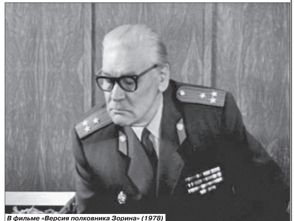
В фильме «Версия полковника Зорина» (1978)

- Знаю, что папа любил копировать людей, и у него это здорово получалось.