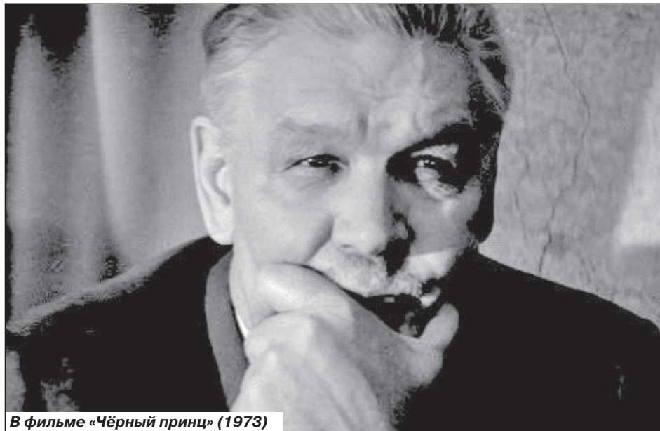
В фильме «Чёрный принц» (1973)

Теперь он уже не раздражался из-за ее приступов, старался уделять больше времени, гулять, ездить отдыхать куда-нибудь.