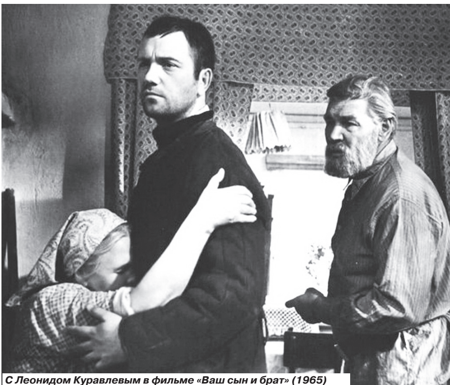
С Леонидом Куравлевым в фильме «Ваш сын и брат» (1965)

Он смирился, а со временем понял, что и сам не смог бы бросить женщину, подарившую ему свою молодость и родившую двоих детей. Он понял, что еще потеря сына дала толчок психическому заболеванию жены и отчаянно ее жалел.