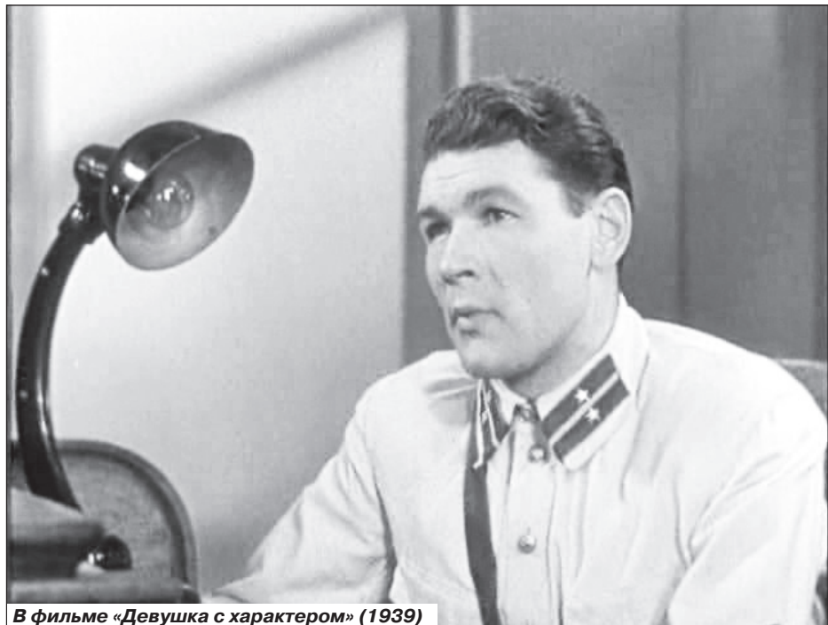
В фильме «Девушка с характером» (1939)