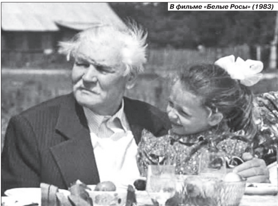
В фильме «Белые Росы» (1983)