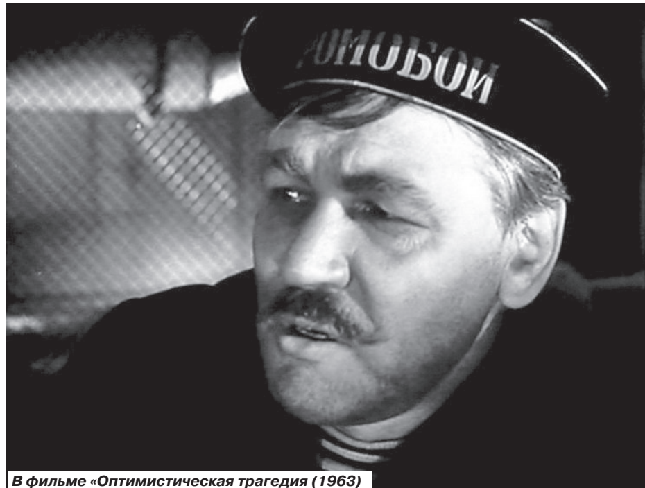
В фильме «Оптимистическая трагедия» (1963)