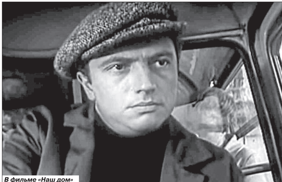
В фильме «Наш дом»