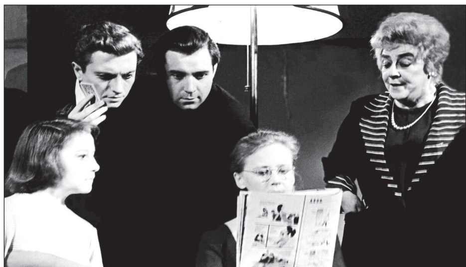
Вадим Бероев (слева), Ия Савина (в центре), Фаина Раневская (справа) в спектакле «Странная миссис Сэвидж», Театр имени Моссовета

ТИС Бероев поступил с первого раза. Закончил вуз в 1958 году.