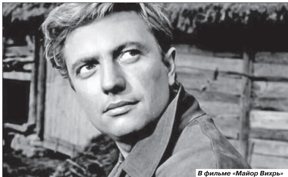
В фильме «Майор Вихрь»