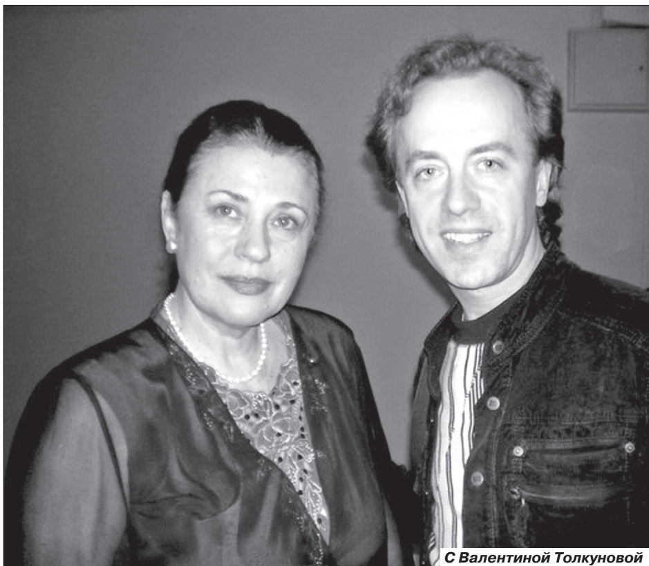
С Валентиной Толкуновой

- В какой-то степени методом «тыка». Ты же знаешь, что в наше время удивить чем-то или «выстрелить фишку» очень сложно. Я пою то, что сочетается с моим внутренним состоянием. Материал подбирается чисто интуитивно. Но всегда присутствует одно условие: текст и музыка должны быть гармоничны. Мне нравятся сюжетные песни, такие, чтобы можно было их обыграть. Ведь в прошлом я драматический актер.