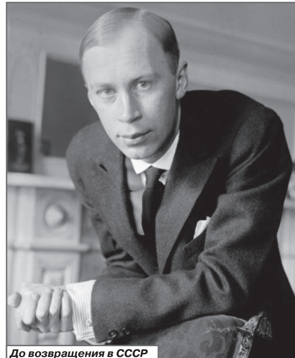
До возвращения в СССР