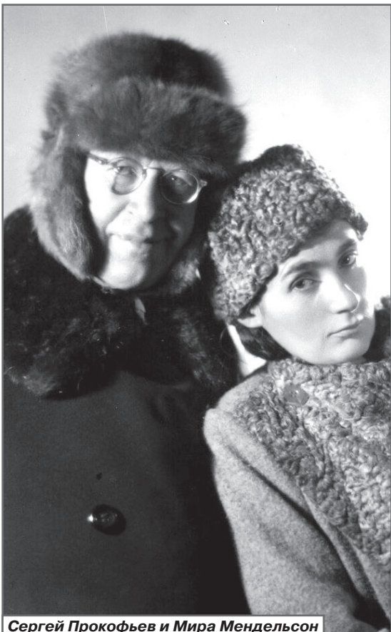
Сергей Прокофьев и Мира Мендельсон

Она никогда не рассказывала о том, что пережила в лагере, образно называя это «временем, проведенным на Севере».