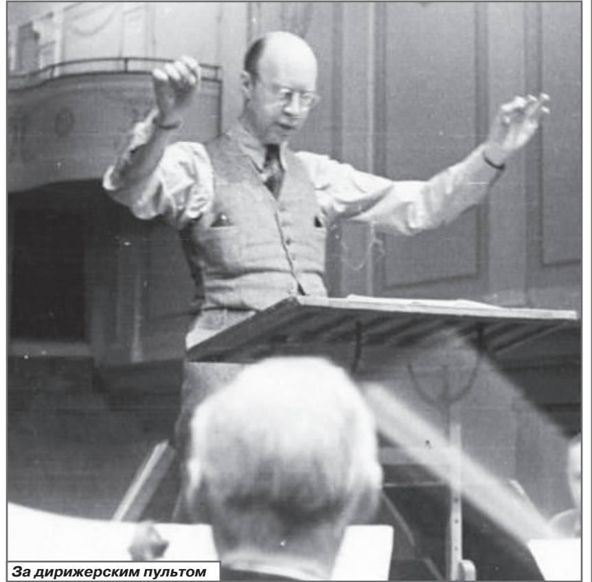
За дирижерским пультом