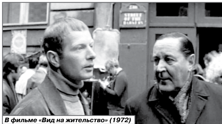
В фильме «Вид на жительство» (1972)