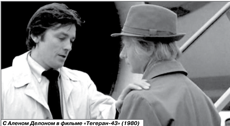
С Аленом Делоном в фильме «Тегеран-43» (1980)