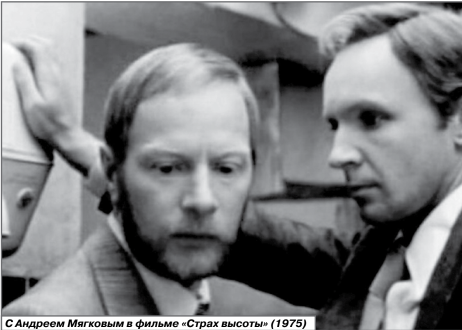
С Андреем Мягковым в фильме «Страх высоты» (1975)