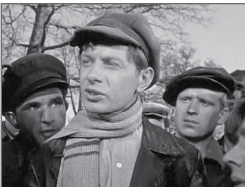
В фильме «Испытательный срок» (1960)