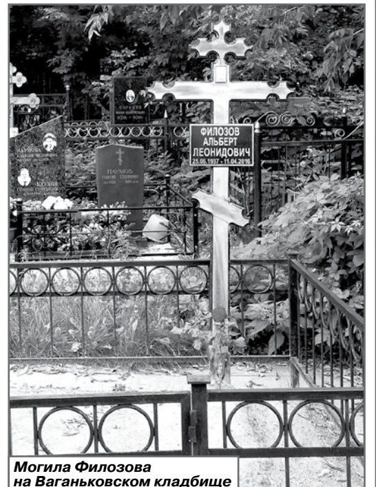
Могила Филозова на Ваганьковском кладбище