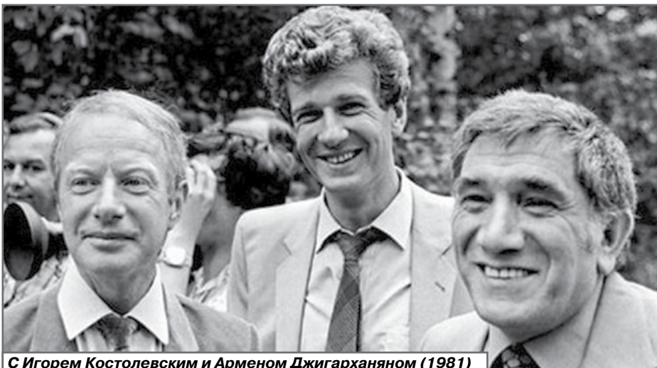
С Игорем Костолевским и Арменом Джигарханяном (1981)