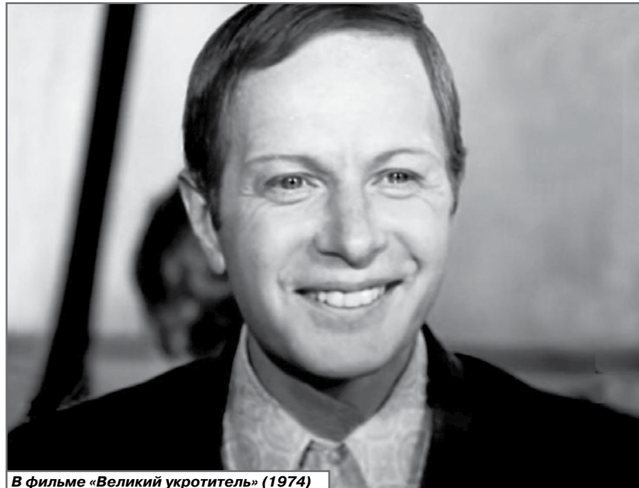
В фильме «Великий укротитель» (1974)