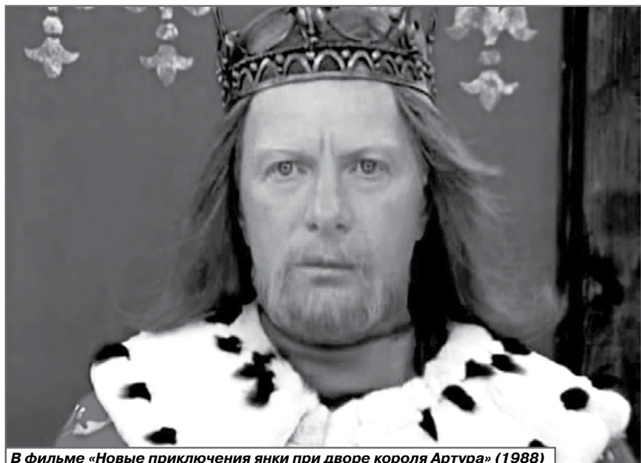
В фильме «Новые приключения янки при дворе короля Артура» (1988)