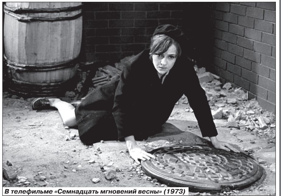
В телефильме «Семнадцать мгновений весны» (1973)