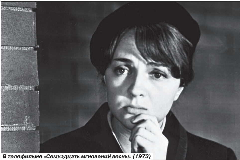
В телефильме «Семнадцать мгновений весны» (1973)