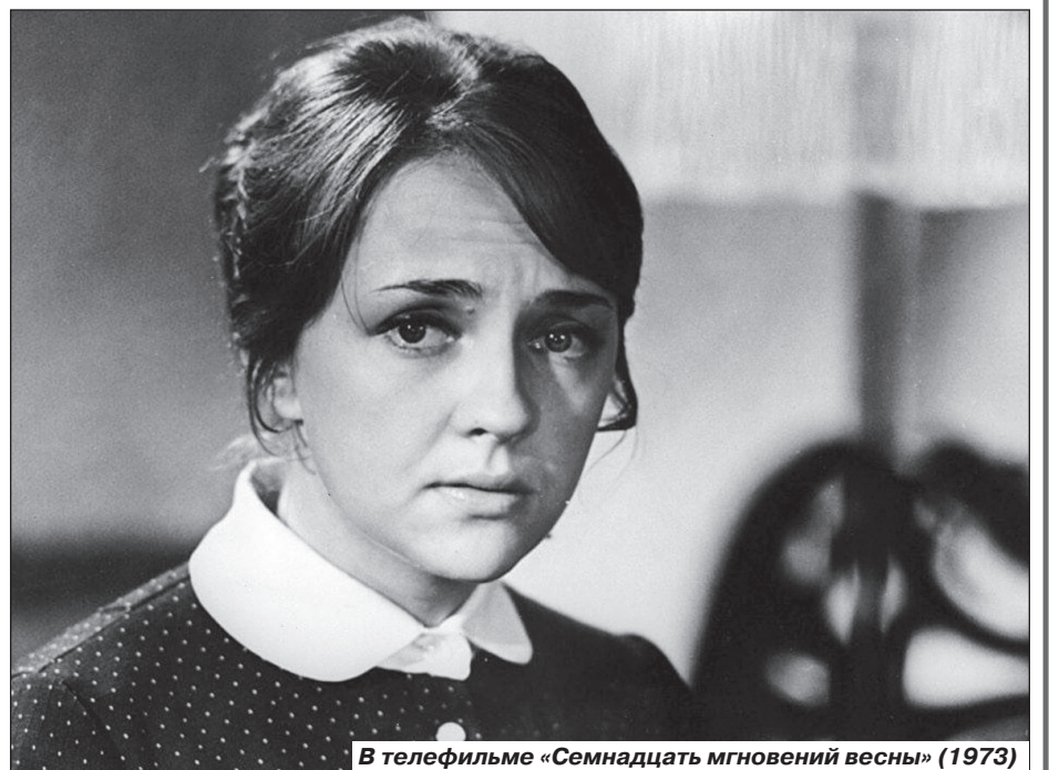
В телефильме «Семнадцать мгновений весны» (1973)