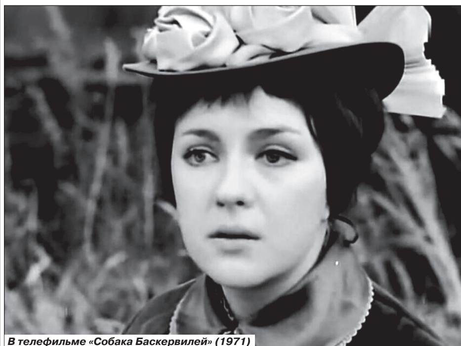
В телефильме «Собака Баскервиль» (1971)

это супруги никогда не ругались - с бабашкой Мироновым это было просто невозможно, и Екатерина всё ему прощала.