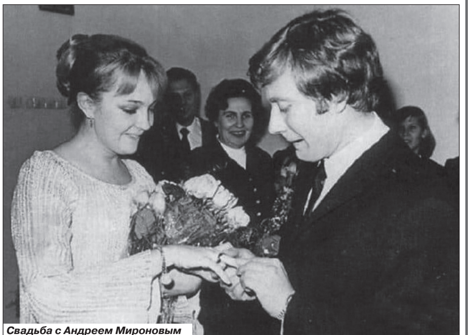
Свадьба с Андреем Мироновым

Мироновым, который был старше ее на пять лет. Несмотря на то, что Андрей был чертовски привлекателен, и все женщины млели от одного его взгляда, в Градову он влюбился, как мальчишка.