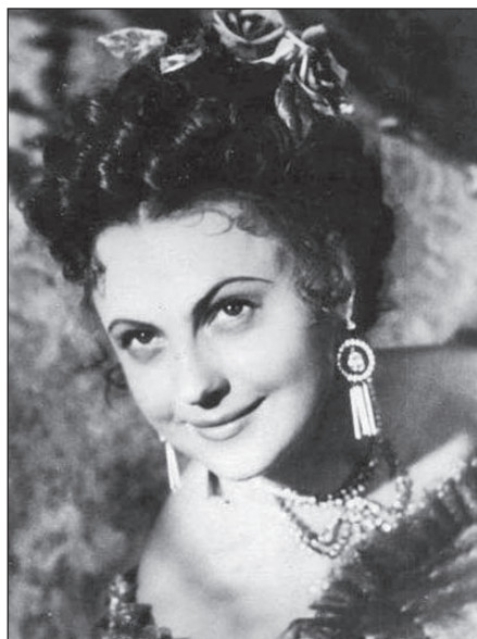
В фильме «Во власти золота» (1957)