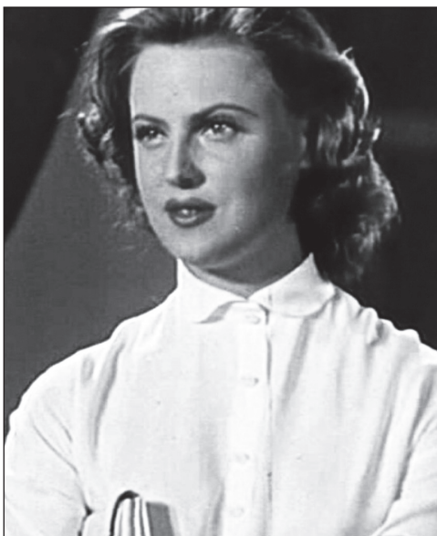
В фильме «Новый аттракцион» (1957)