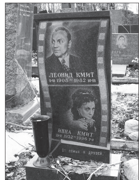
Памятник на могиле Леонида и Инны Кмит на Кунцевском кладбище Москвы