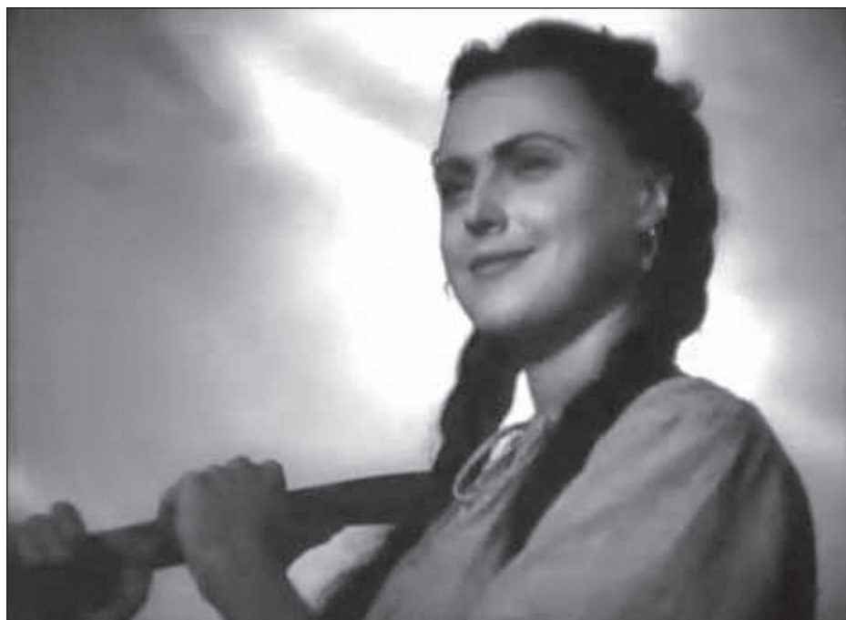
В фильме «Атаман Кодр» (1958)