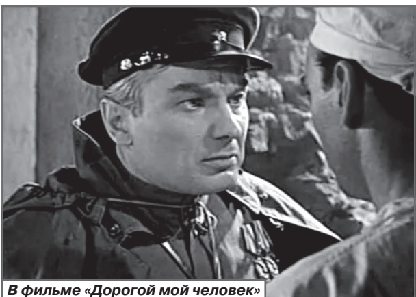
В фильме «Дорогой мой человек»

Интересно, что после выхода фильма в Херсоне уста-