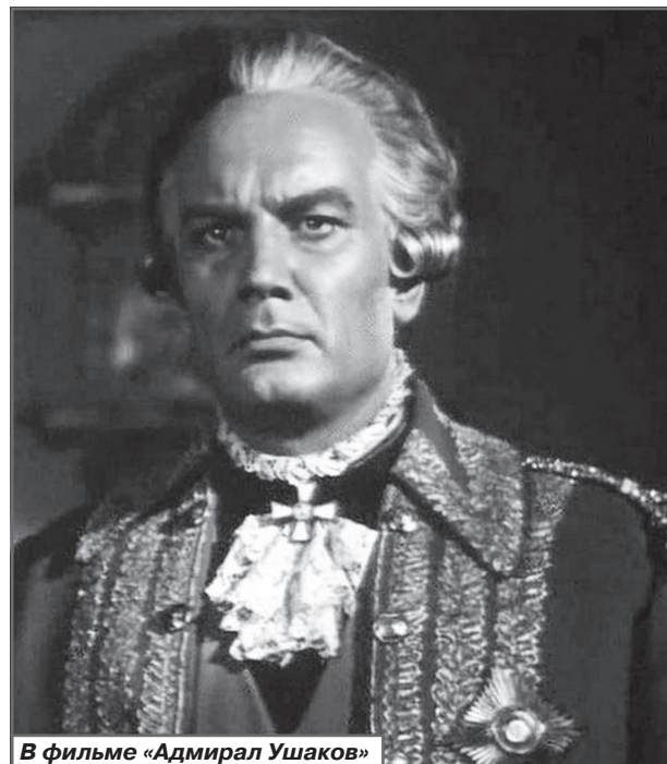
В фильме «Адмирал Ушаков»