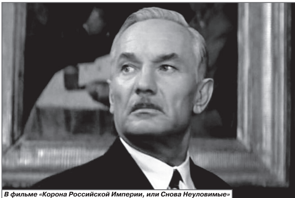
В фильме «Корона Российской Империи, или Снова Неуловимые»

новили памятник адмиралу, который скульптор слепил с актера, несмотря на то, что антропологу Михаилу Герасимову удалось к тому времени восстановить черты лица командующего русским флотом по найденным останкам.