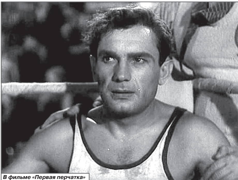
В фильме «Первая перчатка»