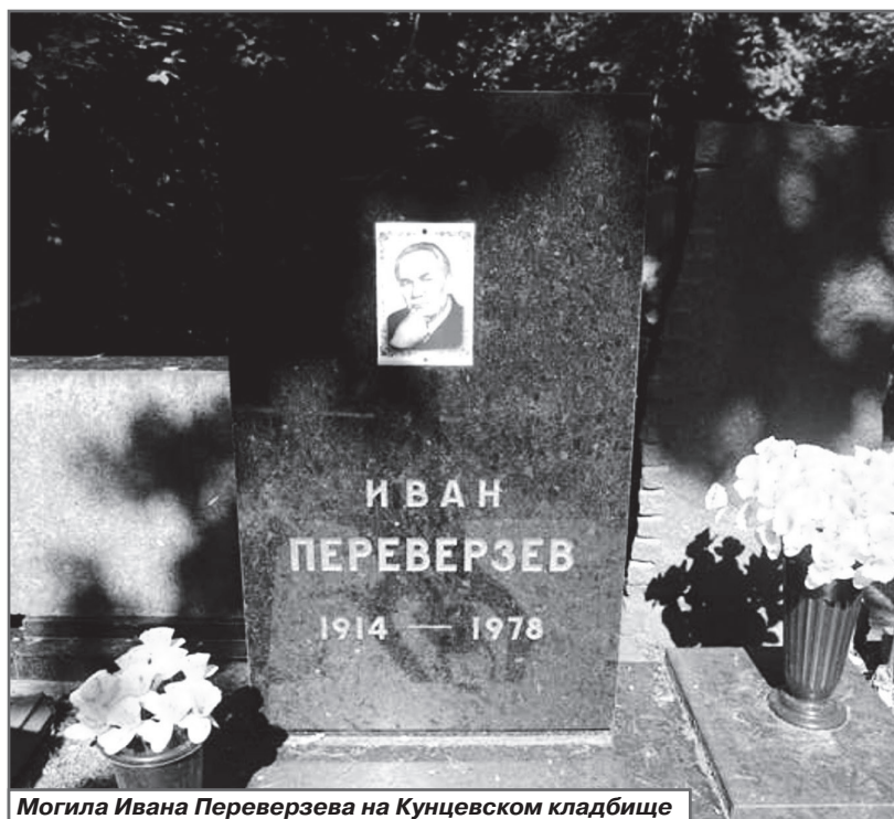
Могила Ивана Переверзева на Кунцевском кладбище