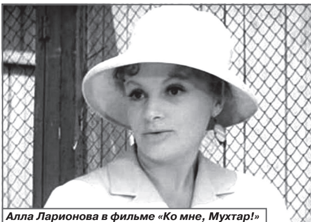
Алла Ларионова в фильме «Ко мне, Мухтар!»