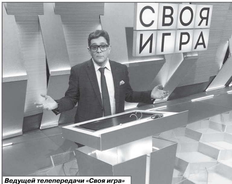
Ведущей телепередачи «Своя игра»