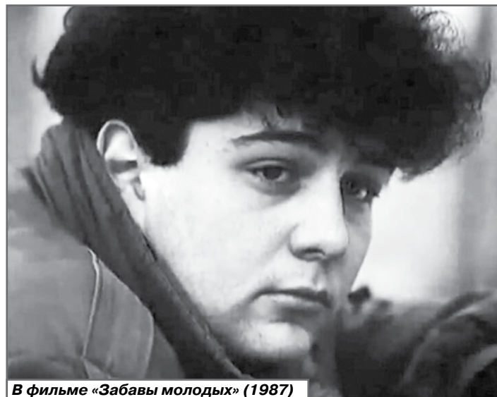
В фильме «Забавы молодых» (1987)