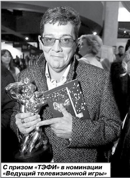
С призом «ТЭФИ» в номинации «Ведущий телевизионной игры»