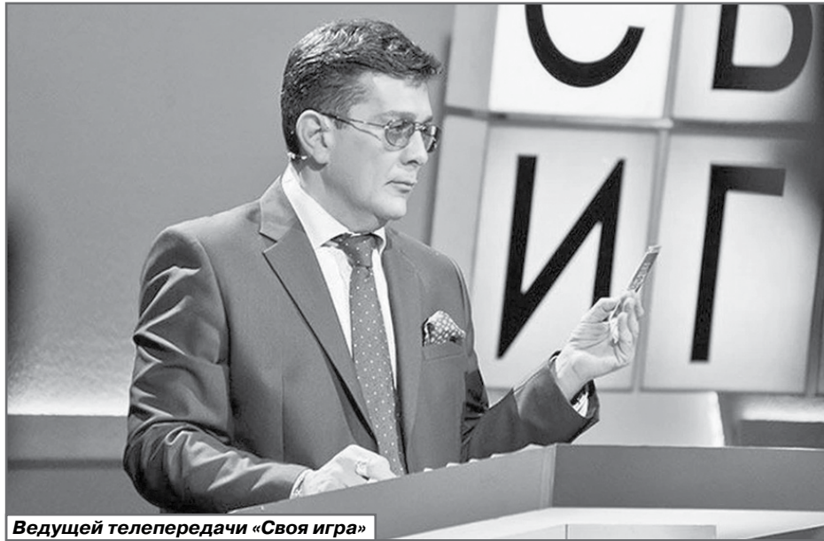
Ведущей телепередачи «Своя игра»