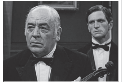
В фильме «Квартет Гварнери» (1978)

И в этих словах было то же, что в реплике великого танцовщика Вацлава Нижинского, назвавшего себя «клоуном Божиим» - исполнение воли Творца.