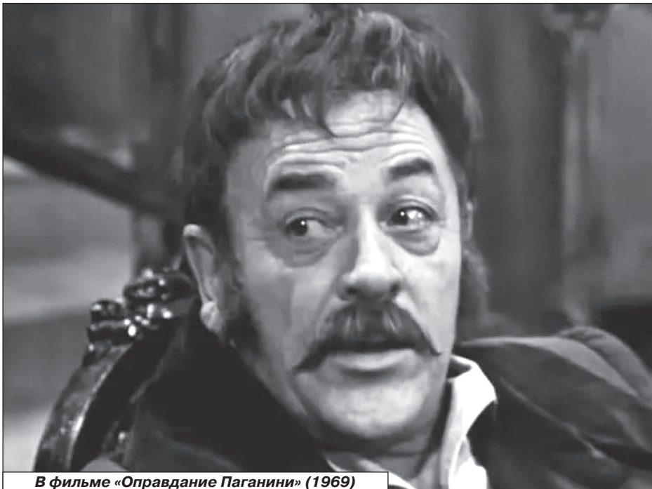
В фильме «Оправдание Паганини» (1969)