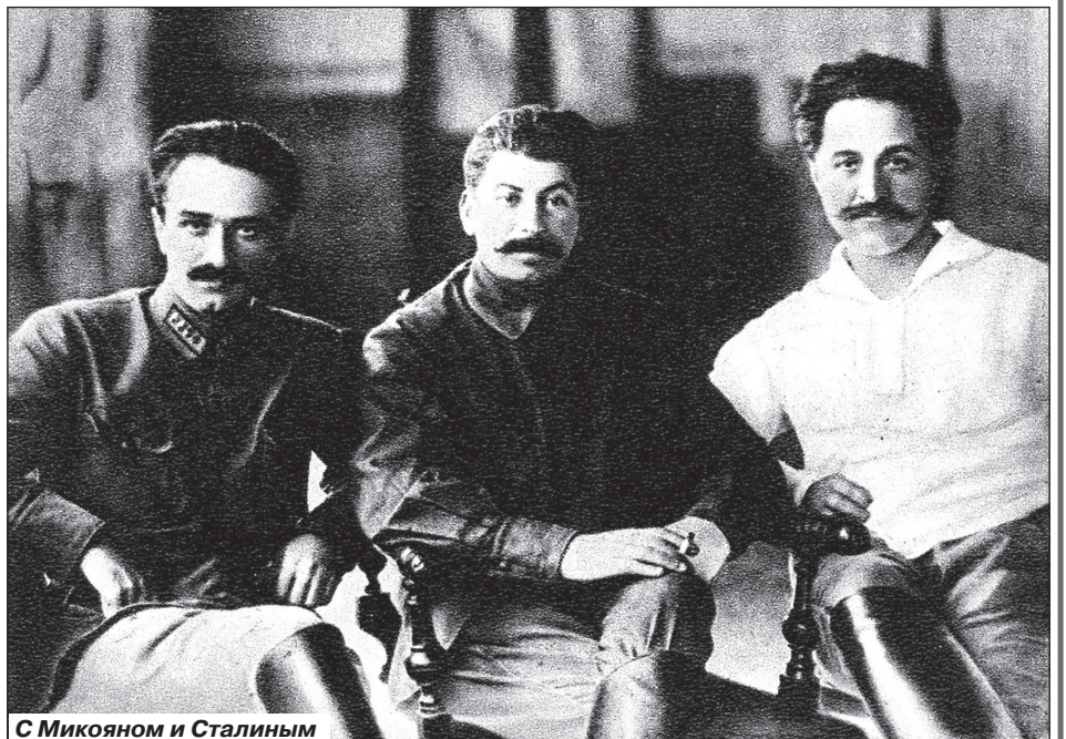
С Микояном и Сталиным