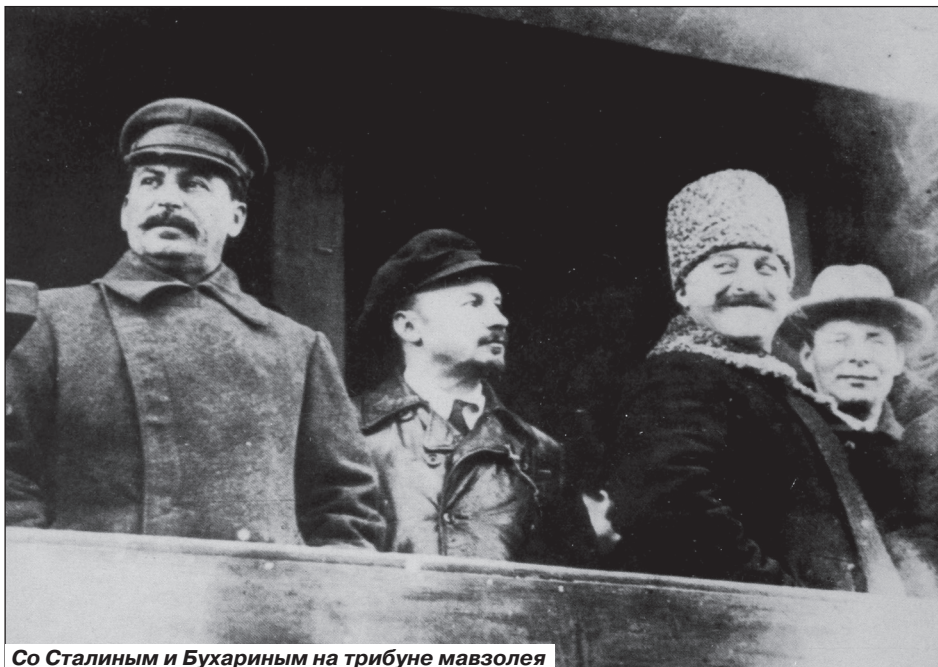
Со Сталиным и Бухариным на трибуне мавзолея