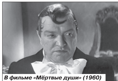
В фильме «Мёртвые души» (1960)