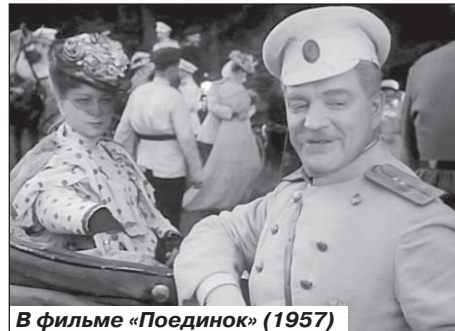
В фильме «Поединок» (1957)