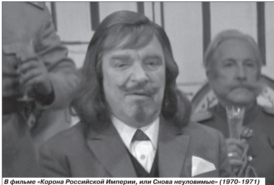
В фильме «Корона Российской Империи, или Снова неуловимые» (1970-1971)

роль водителя БелАЗа, а в фильме «Неуловимые мстители» священника-философа.