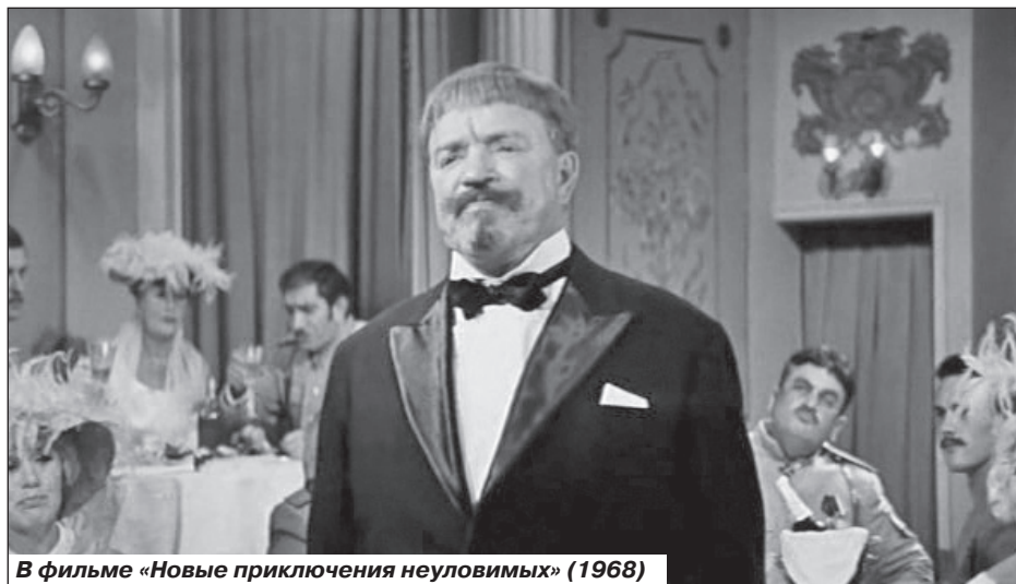
В фильме «Новые приключения неуловимых» (1968)