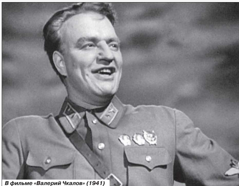
В фильме «Валерий Чкалов» (1941)

К примеру, в комедии «Королева бензоколонки» в 1962 году актер исполнил