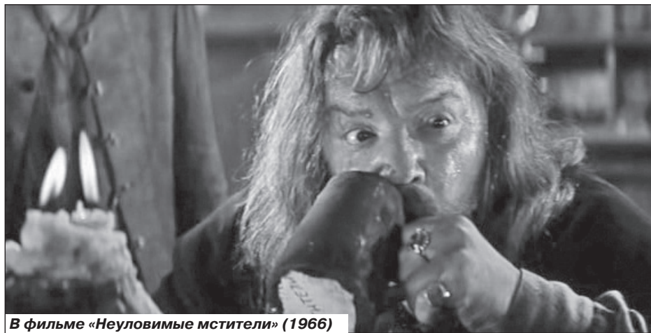
В фильме «Неуловимые мстители» (1966)