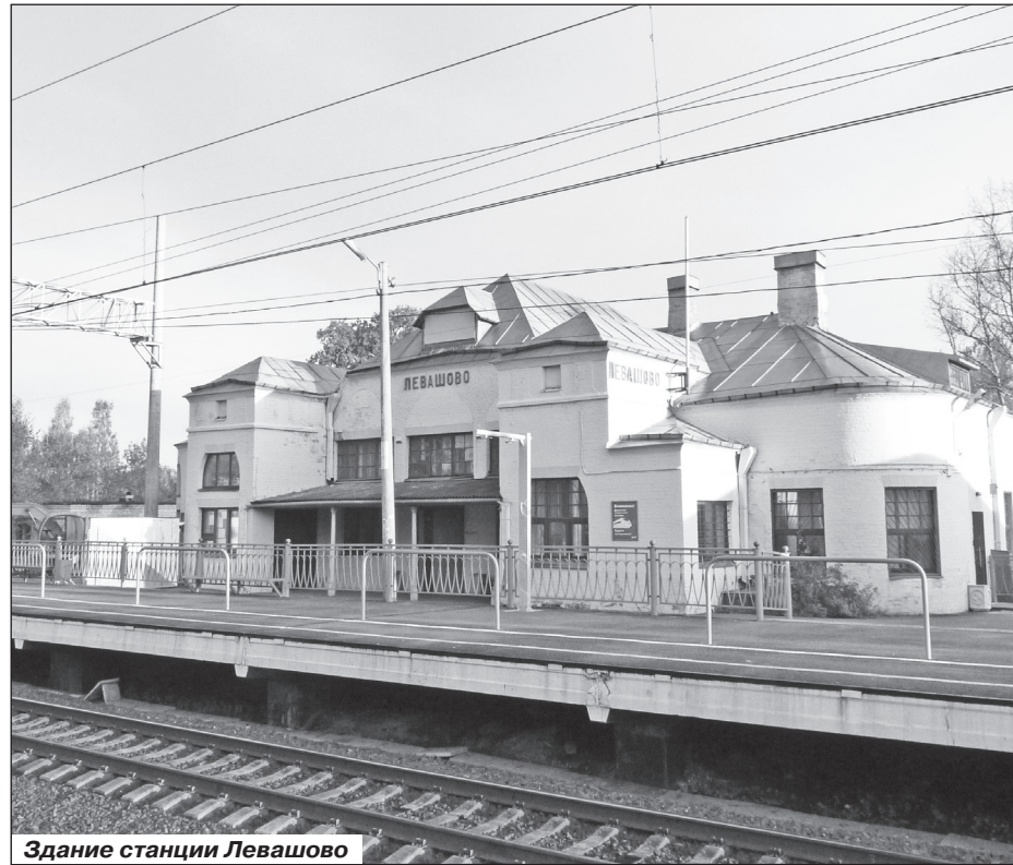
Здание станции Левашово