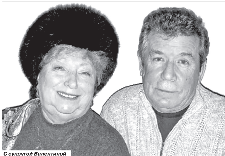
С супругой Валентиной