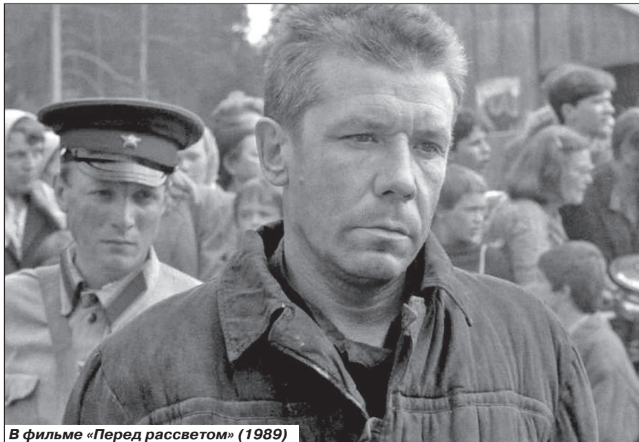
В фильме «Перед рассветом» (1989)

В последний путь актера провожали всего несколько близких людей. Это было его личное желание - уйти без лишнего шума.