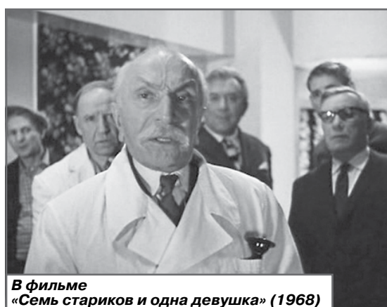
В фильме «Семь стариков и одна девушка» (1968)