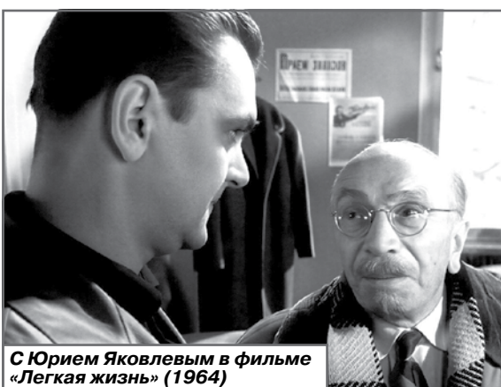
С Юрием Яковлевым в фильме «Легкая жизнь» (1964)

Как-то Илья Эренбург в своей пьесе за действовал Георгия. У его персонажа не