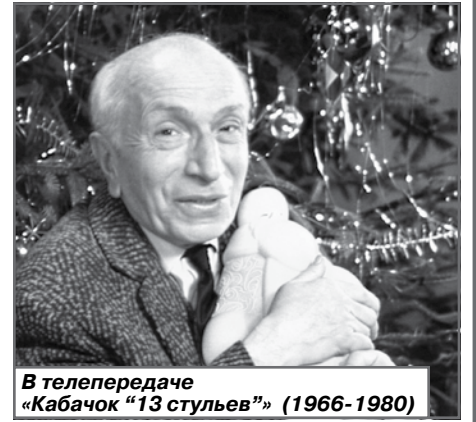
В телепередаче «Кабачок "13 стульев"» (1966-1980)