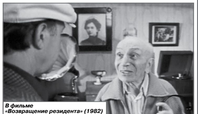
В фильме «Возвращение резидента» (1982)