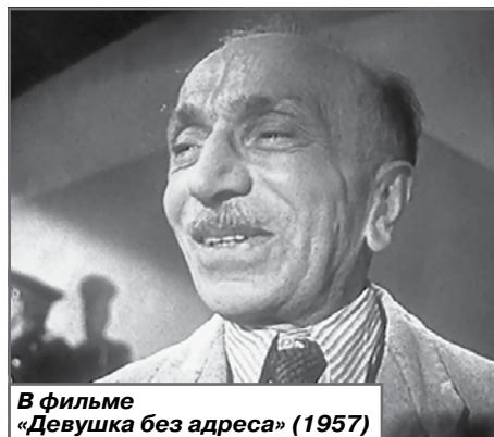
В фильме «Девушка без адреса» (1957)