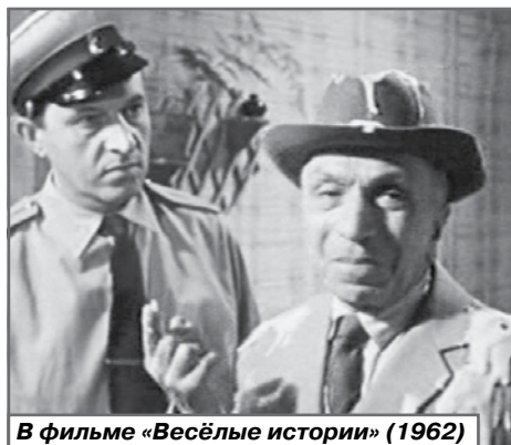
В фильме «Весёлые истории» (1962)