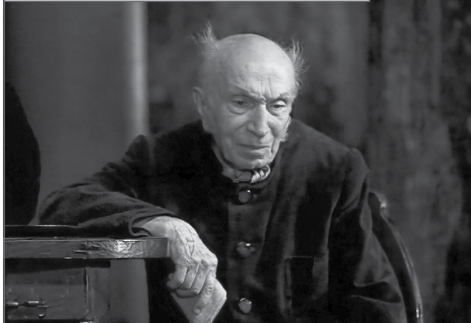
В телеспектакле «Ревизор» Московского театра Сатиры (1983)