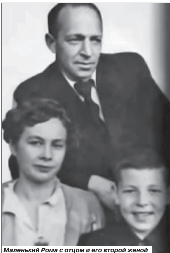
Маленький Рома с отцом и его второй женой

А фильмы, в которых он сыграл, идут. И роли его люди помнят. И будут помнить.