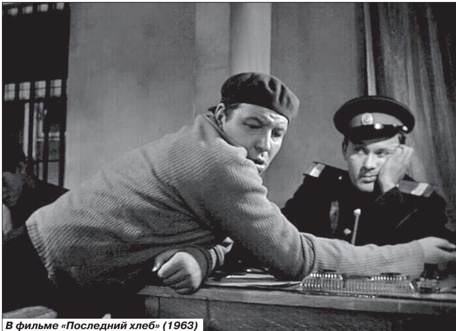
В фильме «Последний хлеб» (1963)

После войны люди жили тяжело, собрать денег для поездки ребенка в столицу многим было не под силу, и для