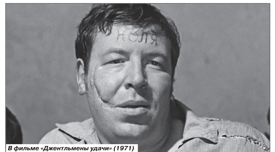
В фильме «Джентльмены удачи» (1971)

Начиная с 1982 года, страна, наряду с «Карнавальная ночь» «Иронией судьбы» и «Джентльменами удачи» встреча-