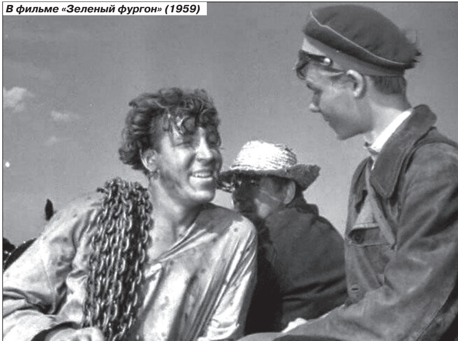
В фильме «Зеленый фургон» (1959)

будь для мужчины ростом под два метра и 46-м размером ноги. Выручала «фарца», добывавшая что-нибудь «под заказ», «завсклад, туваровед и директор магазин».