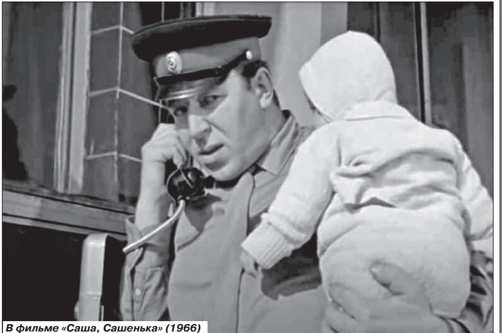
В фильме «Саша, Сашенька» (1966)

ла Новый год под «Чародеев». Филиппов сыграл там завхоза Юрия Дмитриевича Камнеедова, прихвостня главного негодяя Сатанеева. Все, что происходило в стенах Научного универсального института необыкновенных услуг - НУИНУ, снимали в «Останкино» по ночам, а там и днем черт ногу сломит - прав был Гость с юга. Филиппов заботился о Саше Яковлевой - она вечно была голодной, ночью буфеты не работали, группа питалась, как придется, и Филиппов кормил Яковлеву невестку где добытыми вкусностями.