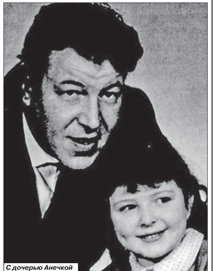
С дочерью Анейкой