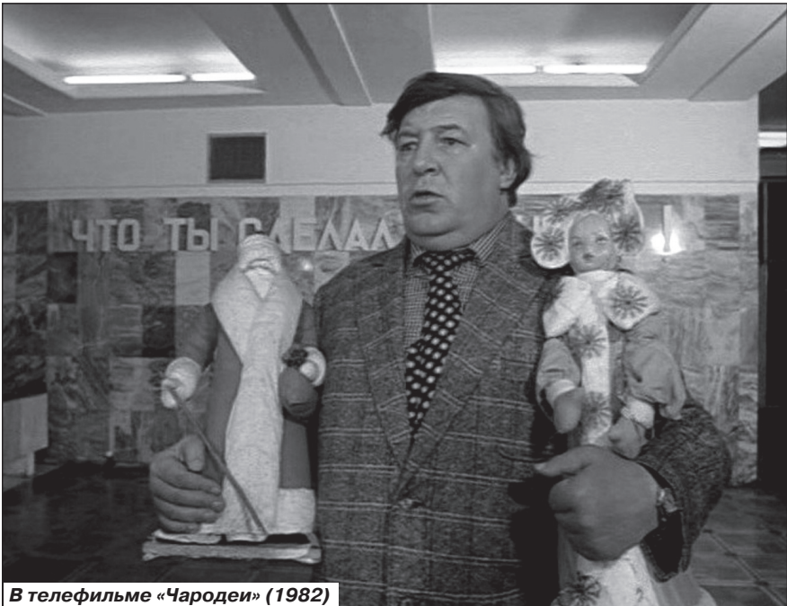
В телефильме «Чародеи» (1982)