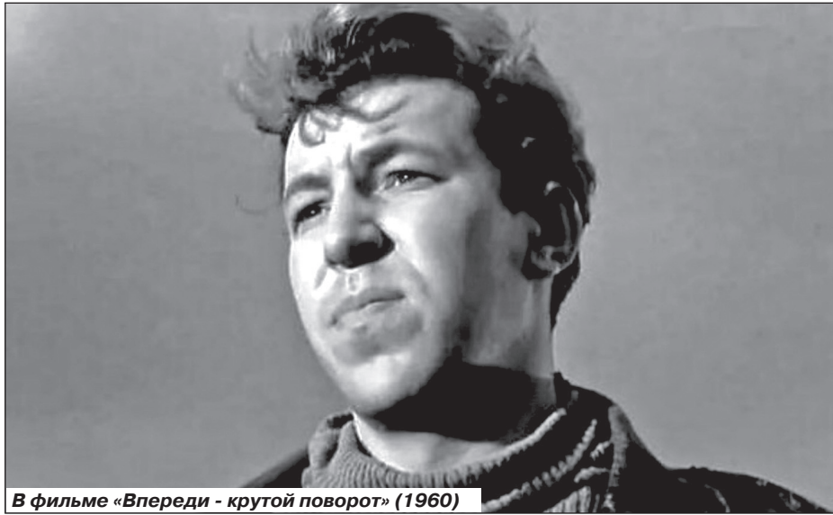
В фильме «Вперед - крутой поворот» (1960)