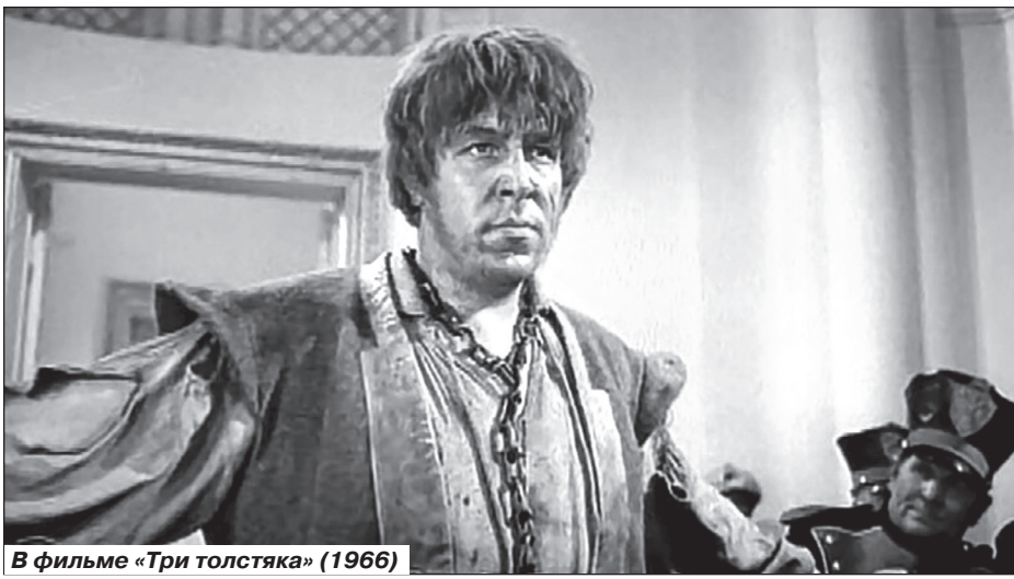
В фильме «Три толстяка» (1966)

отпускать ее не хотел, да и сама девушка не горела желанием уезжать далеко от родителей. Филиппов же не мог пока уехать из Москвы, и у них получилось что-то вроде железнодорожного романа: как только выдавалась пара-тройка свободных дней, он срывался в Минск. Сложнее это стало делать, когда Роман снимался на «Мосфильме» у Юрия Чулюкина в «Девчатах» и у Генриха Габая в картине «49 дней» - времени совсем не было.