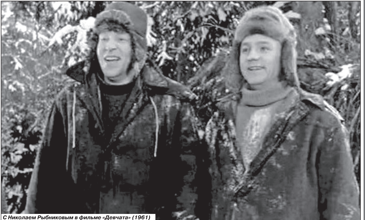
С Николаем Рыбниковым в фильме «Девчата» (1961)

отбора талантливой молодежи театрального училища посылали по стране что-то вроде выездных экзаменационных комиссий.