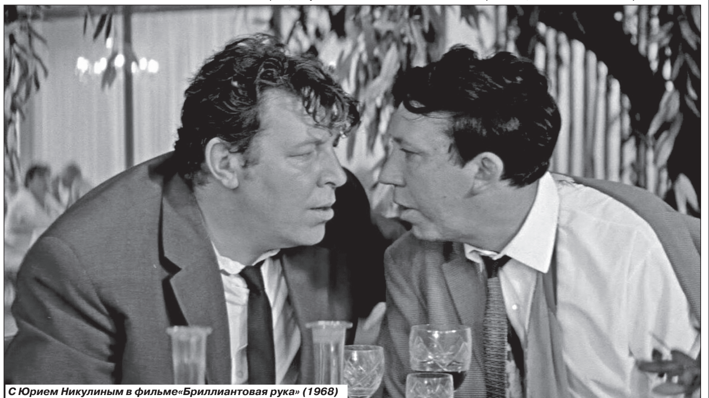
С Юрием Никулиным в фильме «Бриллиантовая рука» (1968)

В Национальном драматическом театре имени Янки Купалы зарплата была выше, чем в неакадемическом русском