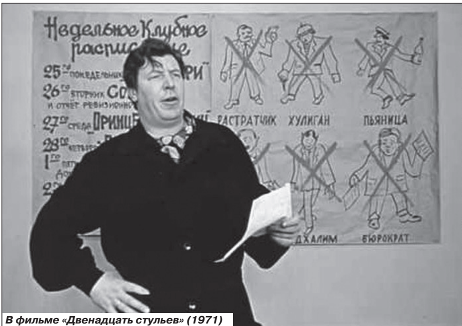
В фильме «Двенадцать стульев» (1971)

драматическом театре. И для того, чтобы туда устроиться, Филиппов быстро выучил белорусский язык.