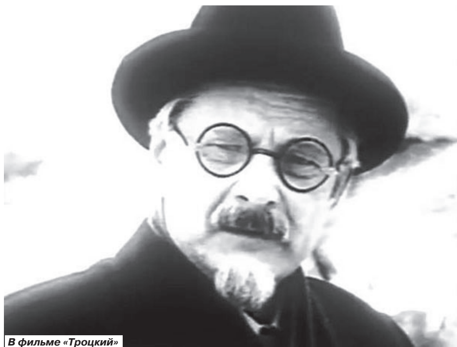
В фильме «Троцкий»