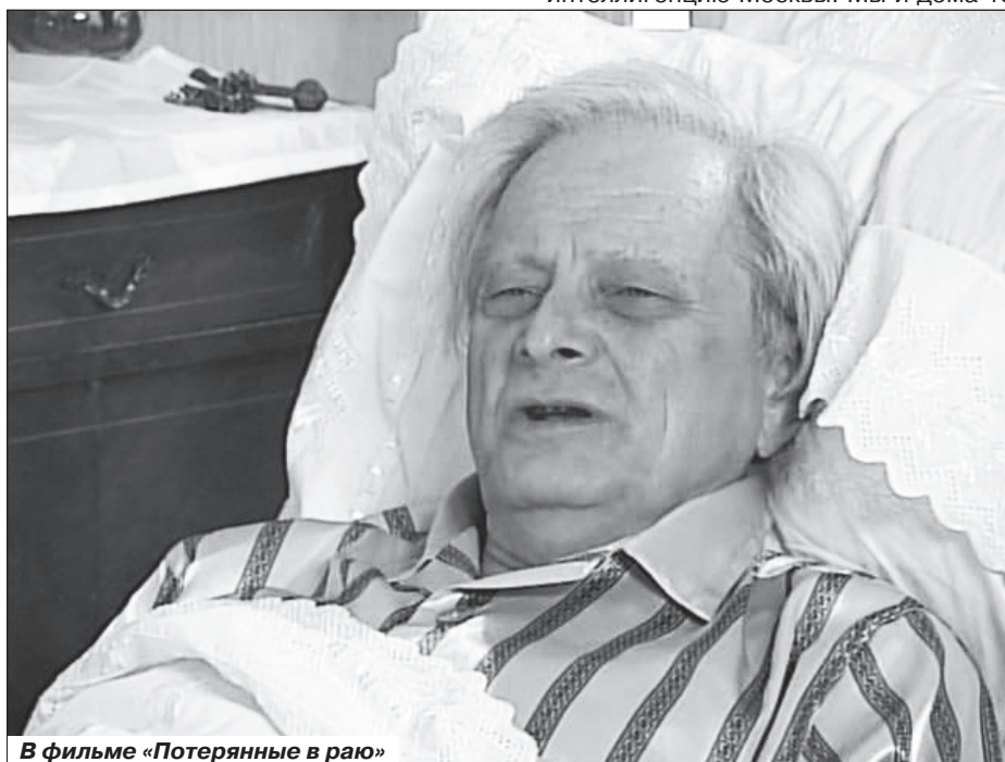
В фильме «Потерянные в раю»

Но в жизни - не знаю, может, кому-то со мной и нелегко.