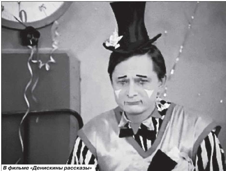
В фильме «Денискины рассказы»