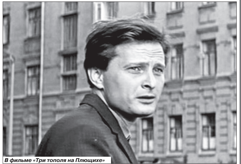
В фильме «Три тополя на Плющихе»