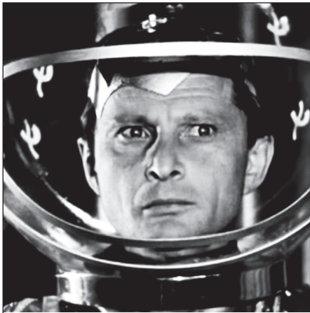
В фильме «Эта весёлая планета»

Родители, бывшие простыми рабочими, уделяли пристальное внимание воспитанию сына. Отец и мать следили за тем, чтобы из мальчика получился образованный, всесторонне развитый человек.