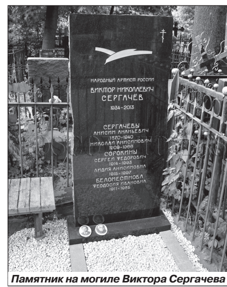
Памятник на могиле Виктора Сергачева

- Нет, не понимали. Мы были уверены, что так будет всегда. Но изменился-то не театр, не его эстетика, не его программа. Вероятно, изменились люди. Сейчас в нашей среде все разговоры ограничиваются банальными вопросами: «А ты что сейчас делаешь? С кем работаешь?»