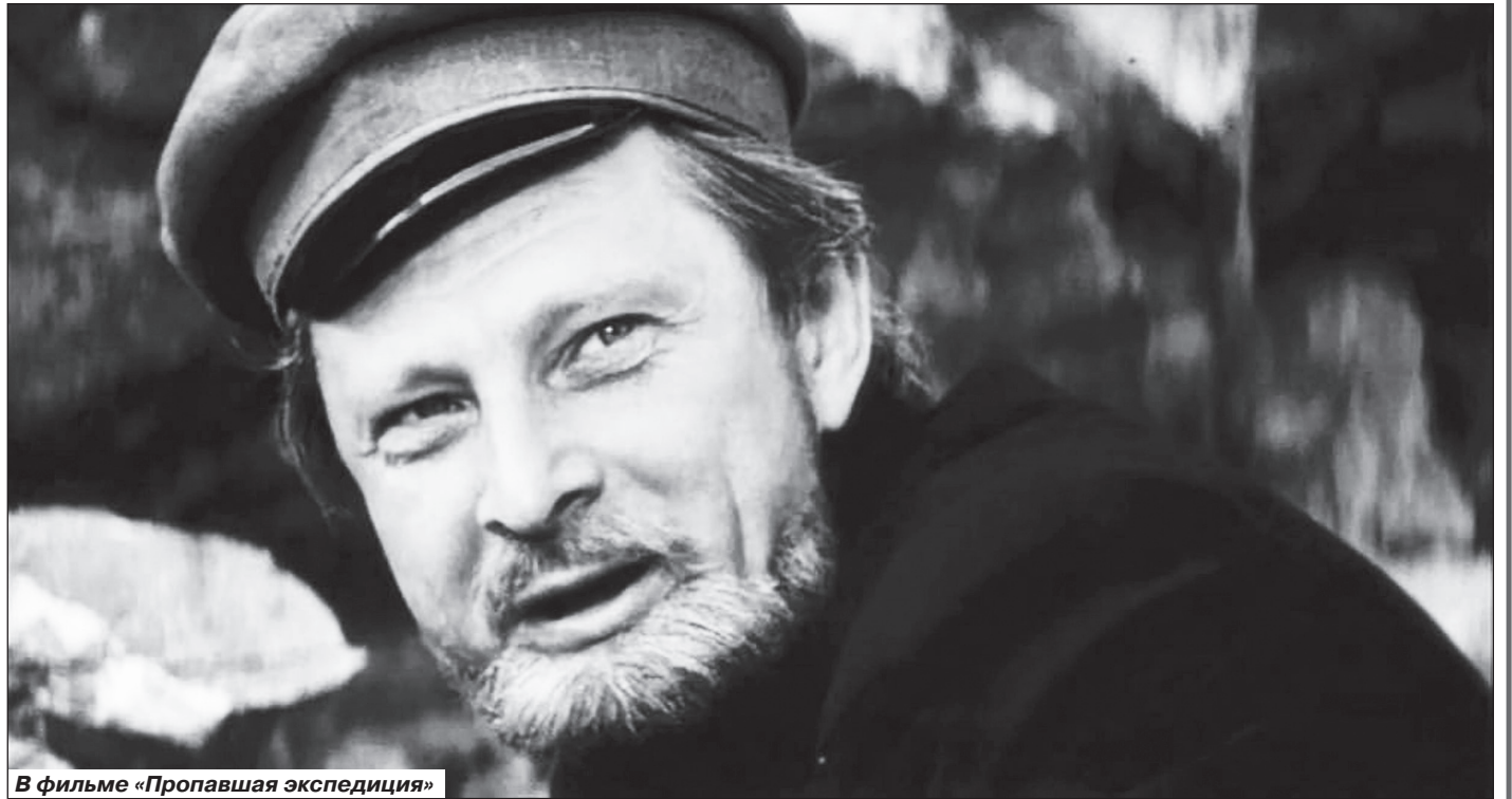
В фильме «Пропавшая экспедиция»

Знакомство с Олегом Ефремовым, жаждавшим создать в Москве нечто новое, перевернуло жизнь уроженца Забайкалья. Он вошел в число основателей