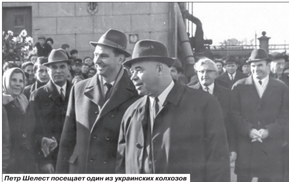
Петр Шелест посещает один из украинских колхозов

Знакомясь с архивными документами того периода, просто поражаешься накалу конкурентной борьбы в высших эшелонах власти, в которой действующие лица не брезговали никакими приемами - интригами и просчитываемыми комбинациями, направленными на под-