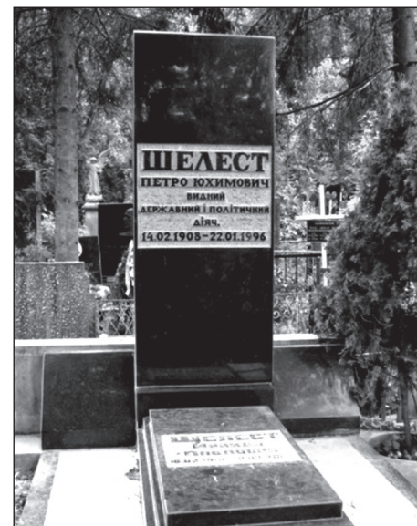
Могила Петра Шелеста на Байковом кладбище в Киеве

После своей отставки Шелест дал себе установку обязательно пережить виновников своей политической трагедии - Брежнева, Суслова и Щербицкого. И преуспел в этом, скончавшись лишь в 1996 году.