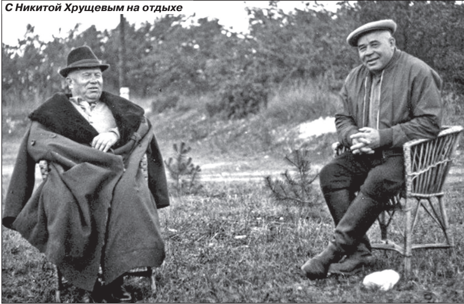
С Никитой Хрущевым на отдыхе