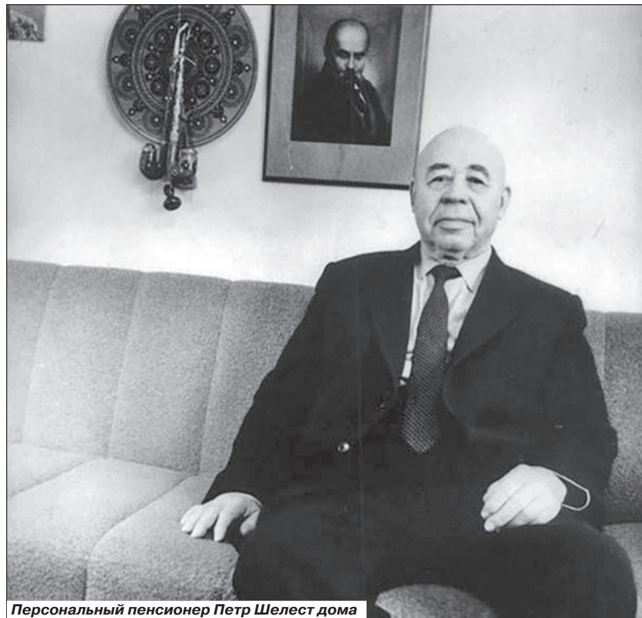
Персональный пенсионер Петр Шелест дома

И все-таки, думается, что версия об украинофильстве Шелеста сильно преувеличена. Да, он действительно был националистом, но не в плане сепаратизма и отделения Украины, а в плане продвижения особой самобытности республики, языка и культуры. Республику он действительно считал родной и средств на нее не жалел: построил роскошный по тем временам дворец искусств «Украина», заповедник «Хортица», музей на-