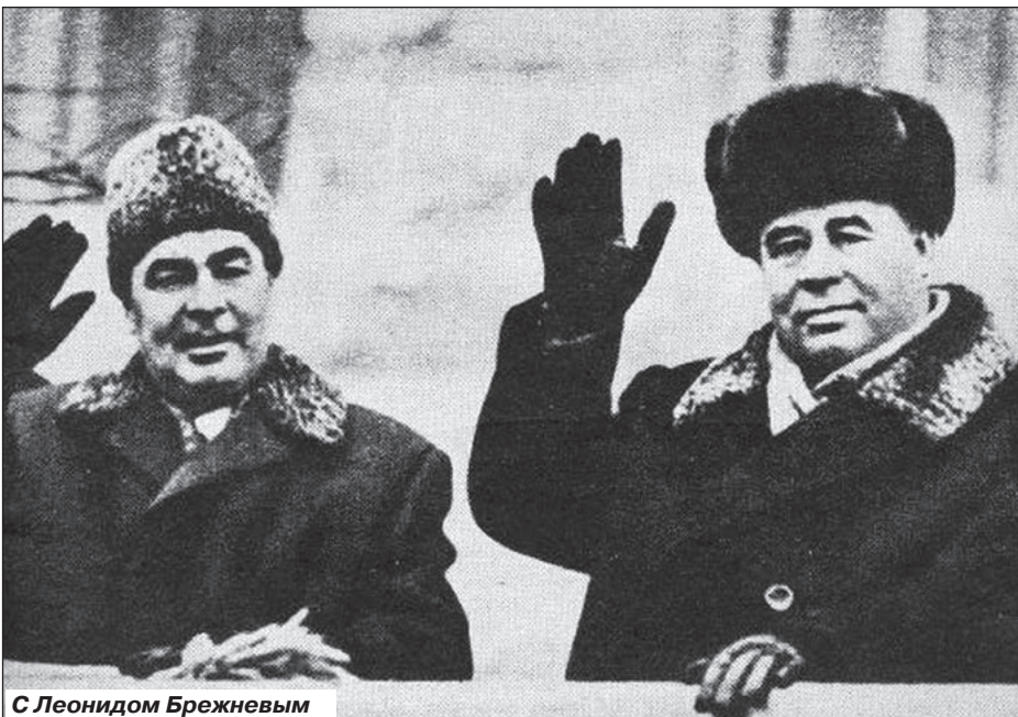
С Леонидом Брежневым