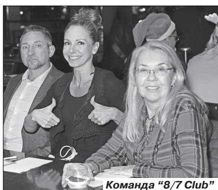
Команда «8/7 Club»