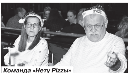
Команда «Нету Pizzy»