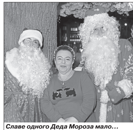
Славе одного Деда Мороза мало...