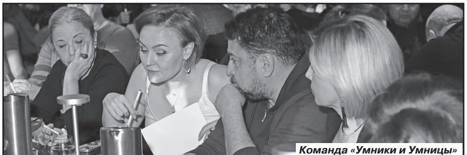
Команда «Умники и Умницы»