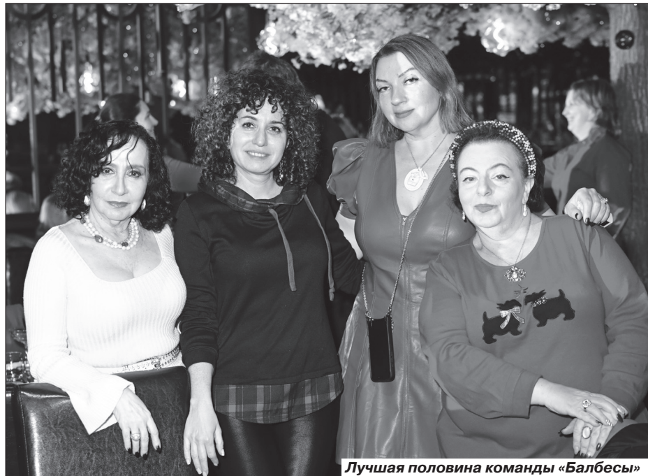
Лучшая половина команды «Балбесы»