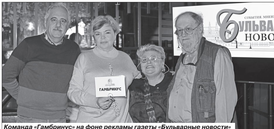
Команда «Гамбринус» на фоне рекламы газеты «Бульварные новости»