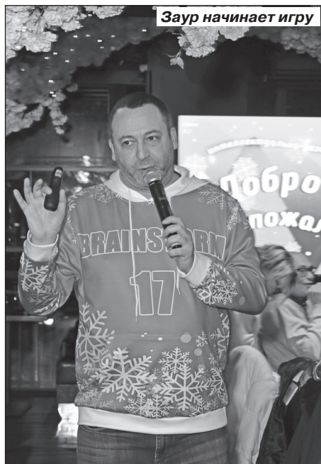
Заур начинает игру

Эдуард Амчиславский