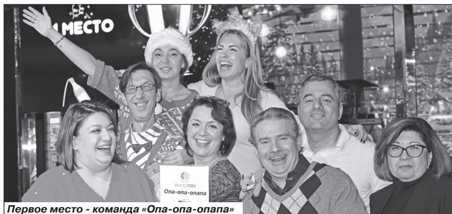
Первое место - команда «Опа-опа-опа»