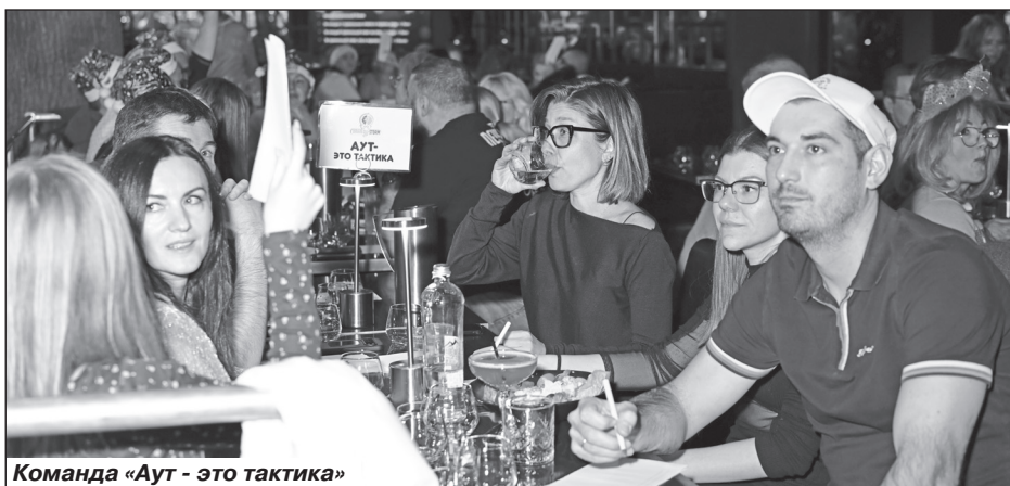
Команда «Аут - это тактика»