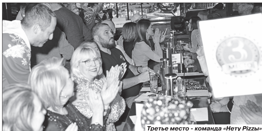
Третье место - команда «Нету Pizzy»