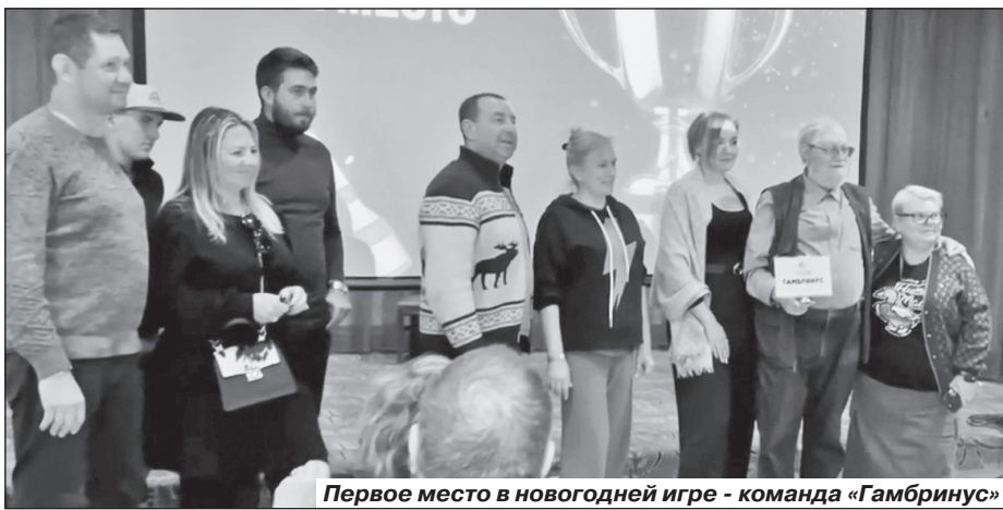
Первое место в новогодней игре - команда «Гамбринус»