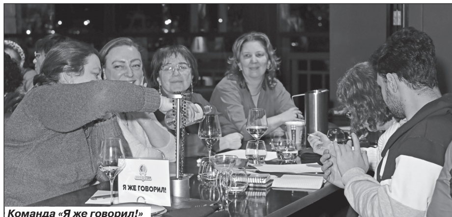
Команда «Я же говорил!»