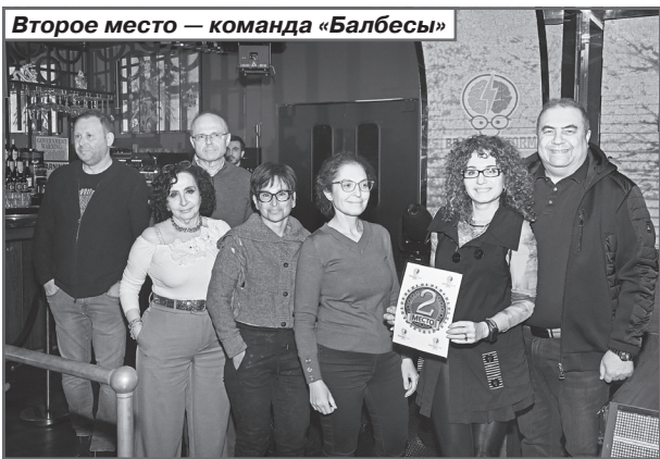
Второе место — команда «Балбесы»