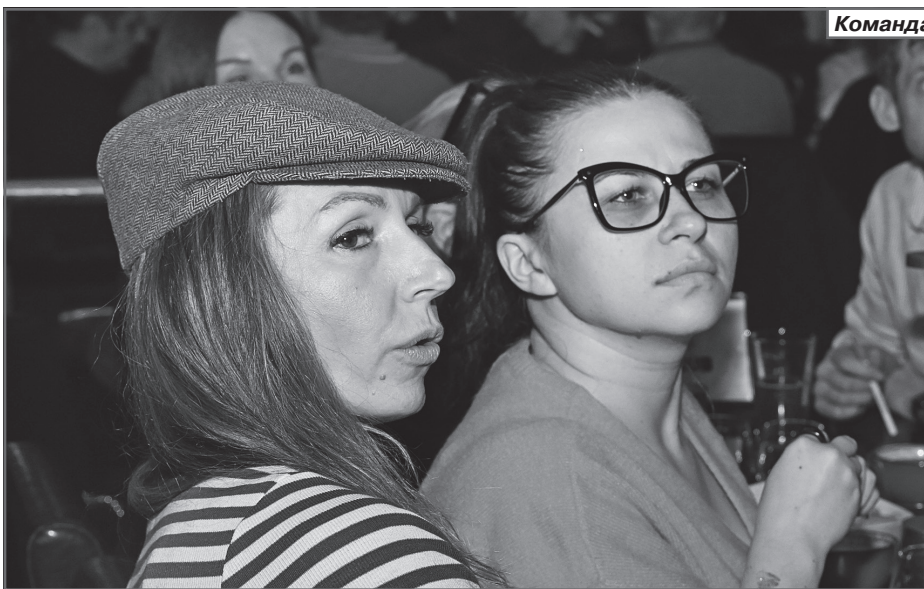
Команда «Club 8/7»