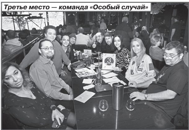
Третье место — команда «Особый случай»