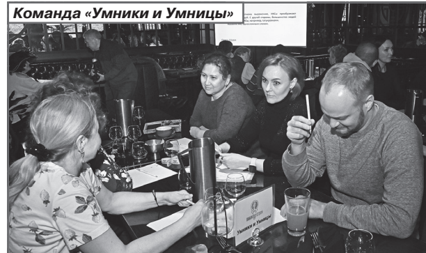
Команда «Умники и Умницы»