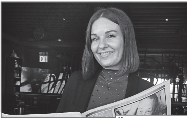
Игроки читают газету «Бульварные новости»

Таким образом вторую игру подряд выиграла команда «Нету Pizzy» (60 баллов), на втором месте команда «Балбесы» (59 баллов) и замыкает тройку призеров команда «Особый случай» (57 баллов).