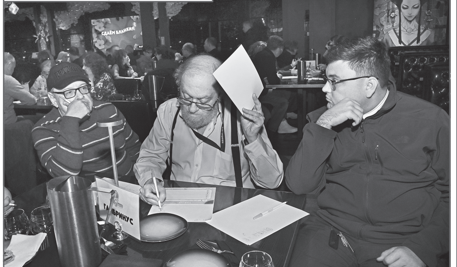
Команда «Гамбринус», ответы готовы