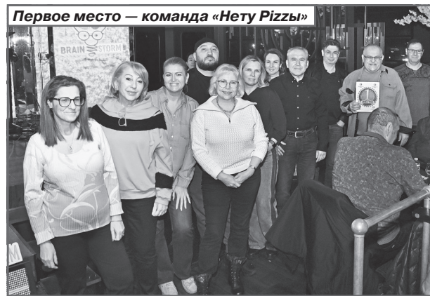
Первое место — команда «Нету Pizzy»