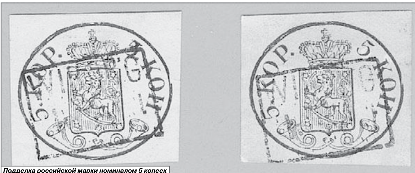
Подделка российской марки номиналом 5 копеек