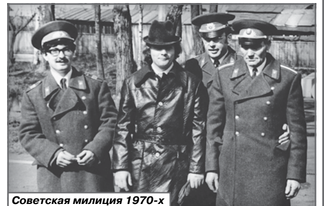
Советская милиция 1970-х