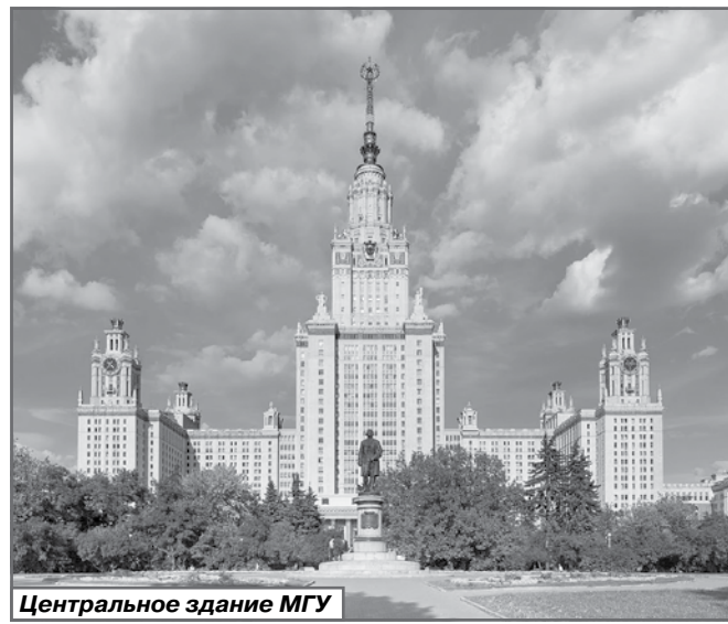
Центральное здание МГУ