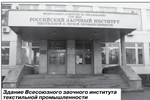
Здание Всесоюзного заочного института текстильной промышленности