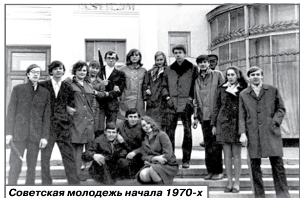
Советская молодежь начала 1970-х