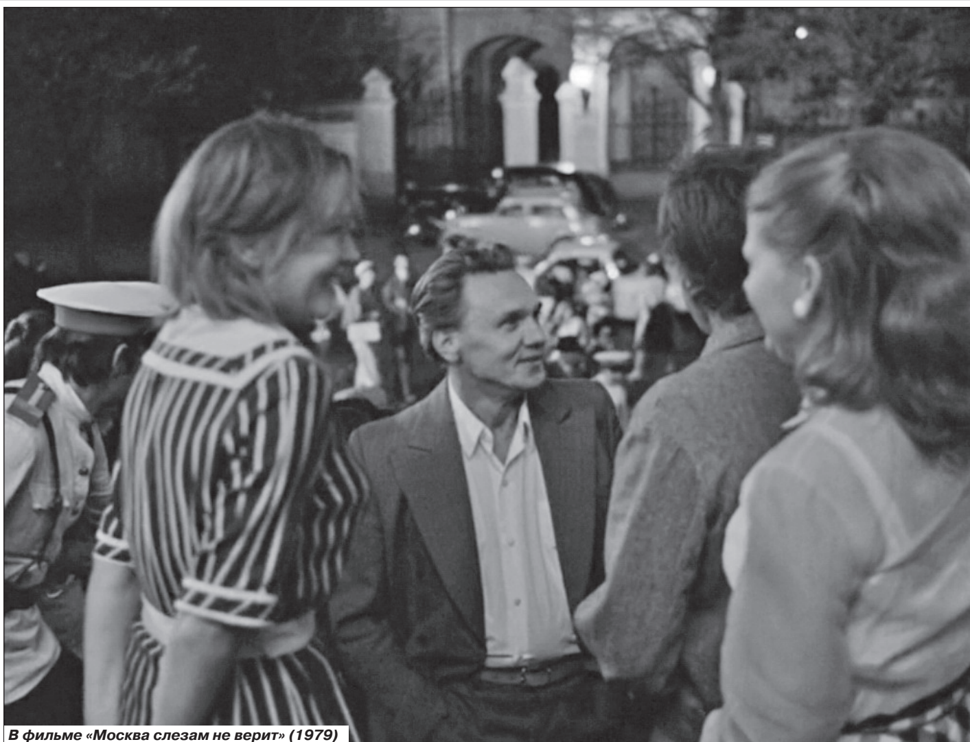
В фильме «Москва слезам не верит» (1979)

Так Георгий Юматов лишился яркой роли, которую он очень хотел сыграть.