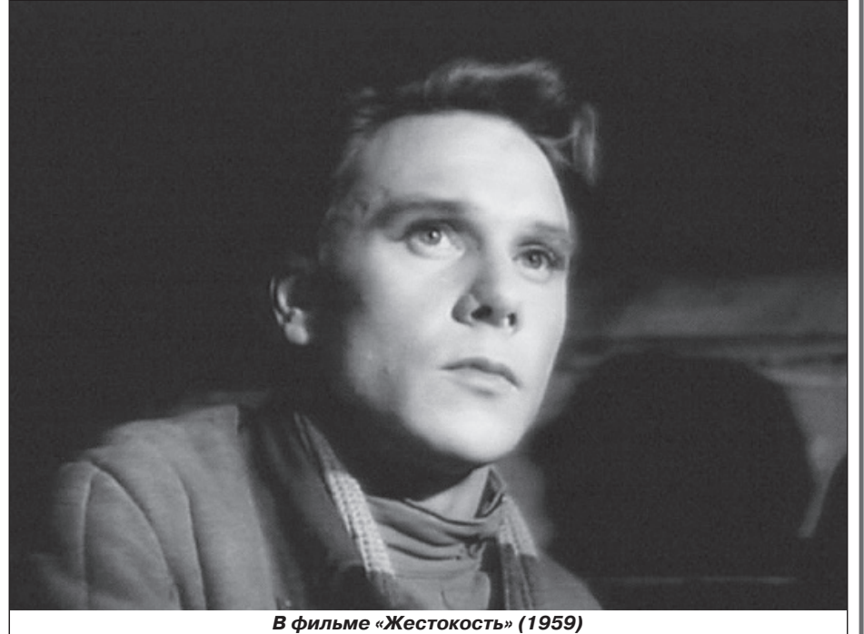
В фильме «Жестокость» (1959)

его рекомендации Юматов принял на работу в Театр-студию киноактера.