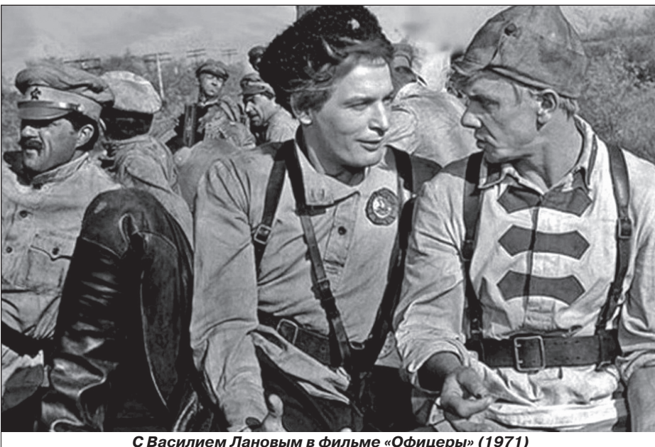
С Василием Лановым в фильме «Офицеры» (1971)

В надежде на скорую главную роль Муза Крепкогорская отказывалась ро-