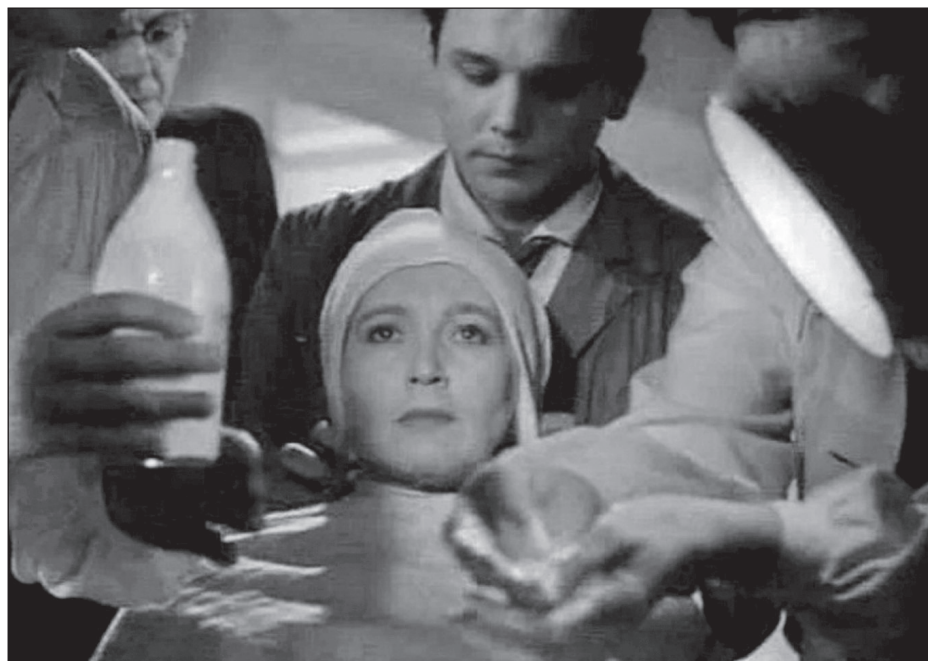
С Любовью Орловой в фильме «Весна» (1947)

На съемочную площадку юного Юматова привел не кто-нибудь, а лично Любовь Орлова, которая была в те годы в зените своей славы. Познакомились они случайно: вместе с другом Юматов пришел в Театр киноактера. Приличным гражданским костюмом он обзавестись еще не успел, поэтому явился в театр в морской форме, со всеми орденами и медалями. Выглядел он очень эффектно, и в буфете его издали заметила Любовь Орлова, оказавшаяся там вместе со своим мужем, известным режиссером Григорием Александровым. Тот как раз подыскивал актеров для своего фильма «Весна». «Морячок» режиссеру понравился. Он