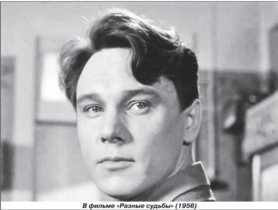
В фильме «Разные судьбы» (1956)