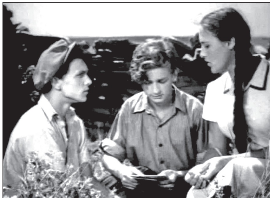
В фильме «Молодая гвардия» (1948)

Когда началась Великая Отечественная война, ученики всех военно-морских спецшкол были призваны на военную службу юнгами. Юматов попал на торпедный катер «Отважный», на котором служил все военные годы и прошел путь от юнга до рулевого. Его торпедный катер в составе Азовской, а потом и Дунайской флотилии принимал участие в освобождении нескольких городов, включая взятие Измаила, Будапешта, Бухареста и Вены. Во вре-