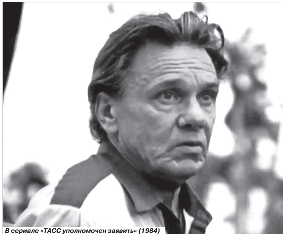
В сериале «ТАСС уполномочен заявить» (1984)

Поначалу съемочный процесс осложняло то, что у Георгия Юматова были натянутые отношения с исполнителем второй главной роли Василием Лановым. Когда-то они оба пробовались на главную роль в фильме «Павел Корчагин», которая досталась Лановому. С тех пор Юматов давнего конкурента недолюбливал. На съемках «Офицеров» они помирились после того, как