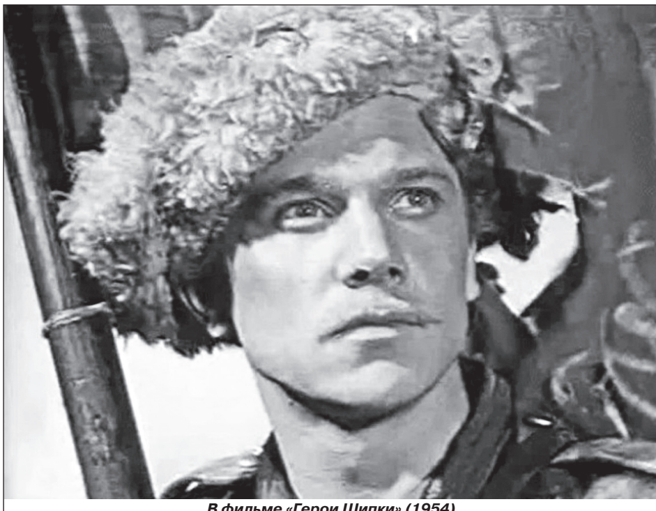
В фильме «Герои Шипки» (1954)