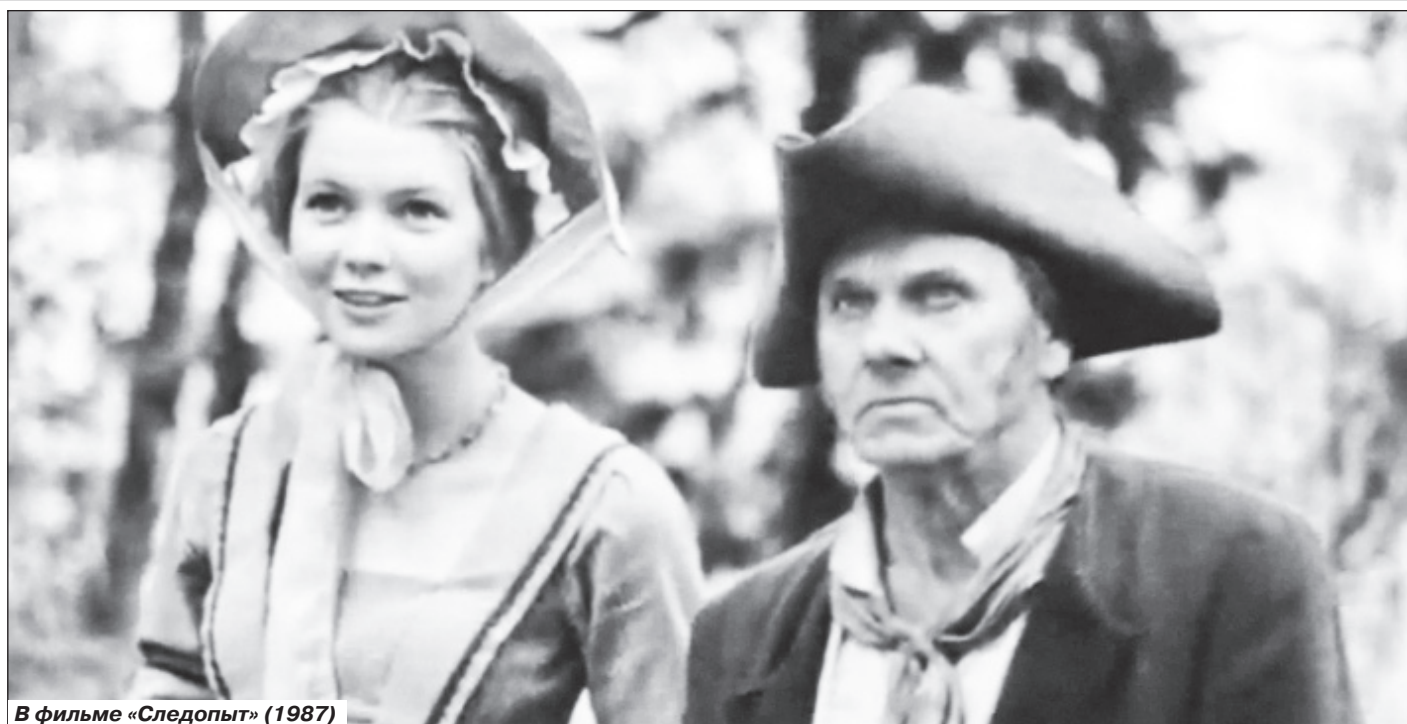
В фильме «Следопыт» (1987)