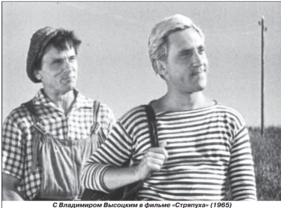
С Владимиром Высоцким в фильме «Стряпуха» (1965)

После «Молодой гвардии» Георгия Юматова постоянно приглашали сниматься в кино. Однако главных ролей у него в те годы почти не было. В 1948-