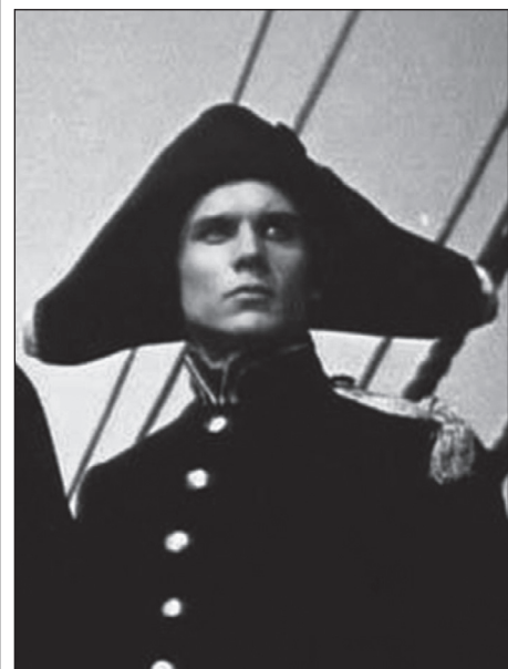
В фильме «Корабли штурмуют бастионы» (1953)