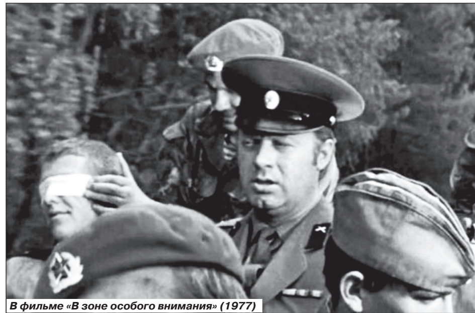
В фильме «В зоне особого внимания» (1977)

тяг. Одних шоферов он сыграл, по меньшей мере, в десяти фильмах: «Версия полковника Зорина», «Любовь с привилегиями».