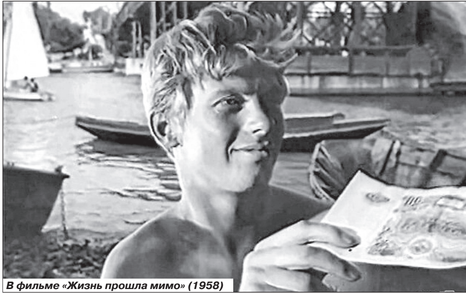
В фильме «Жизнь прошла мимо» (1958)