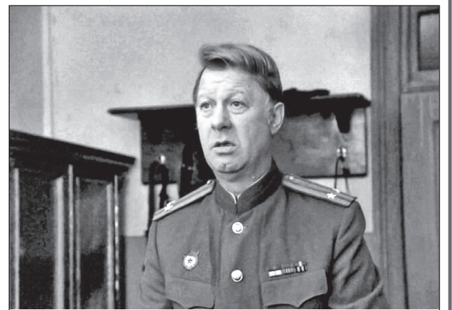
В фильме «Анкор, еще анкор!» (1992)

В ленте «О бедном гусаре замолвите слово» его безымянный персонаж, гость на губернаторском приеме, просит героиню Ирины Мазуркевич исполнить романс «Грезы любви». Но девушка поет другую песню.