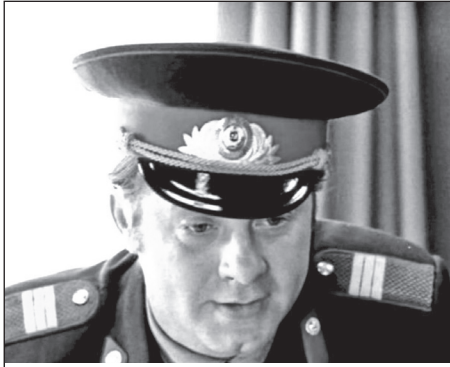
фильма «Три дня в Москве» (1974)