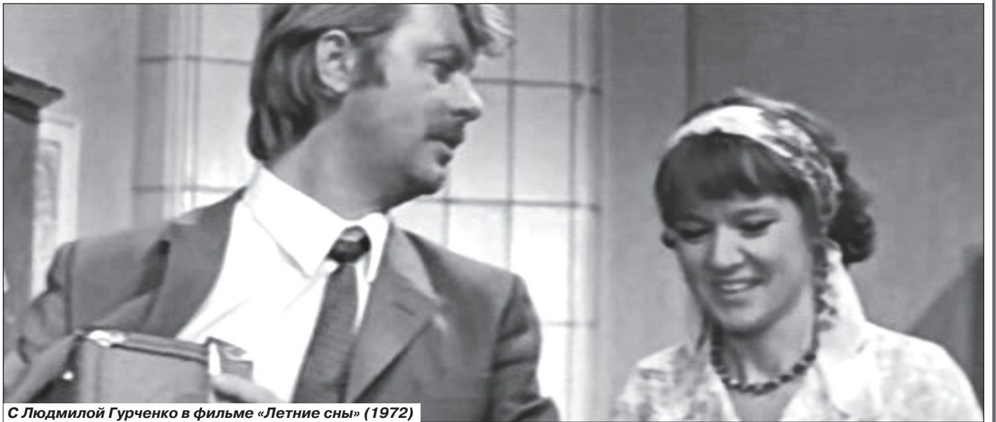
С Людмилой Гурченко в фильме «Летние сны» (1972)