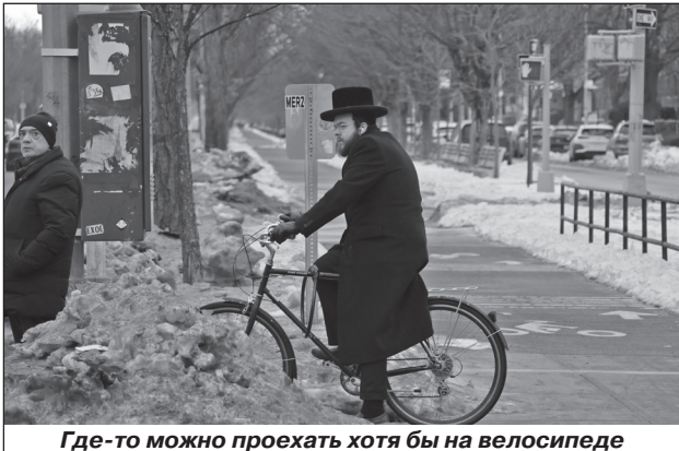
Где-то можно проехать хотя бы на велосипеде