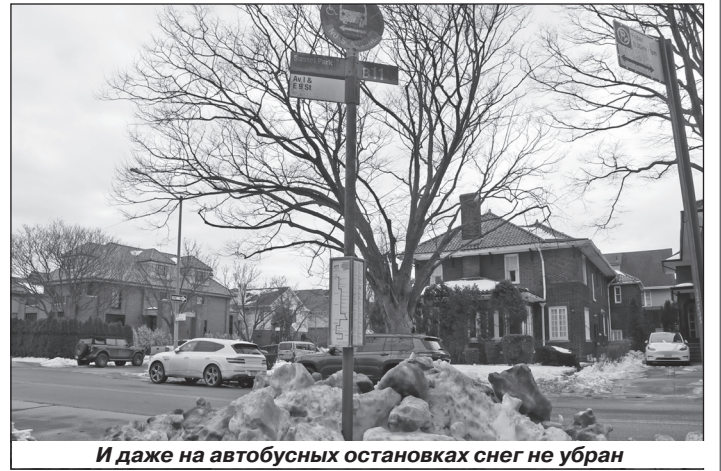
И даже на автобусных остановках снег не убран