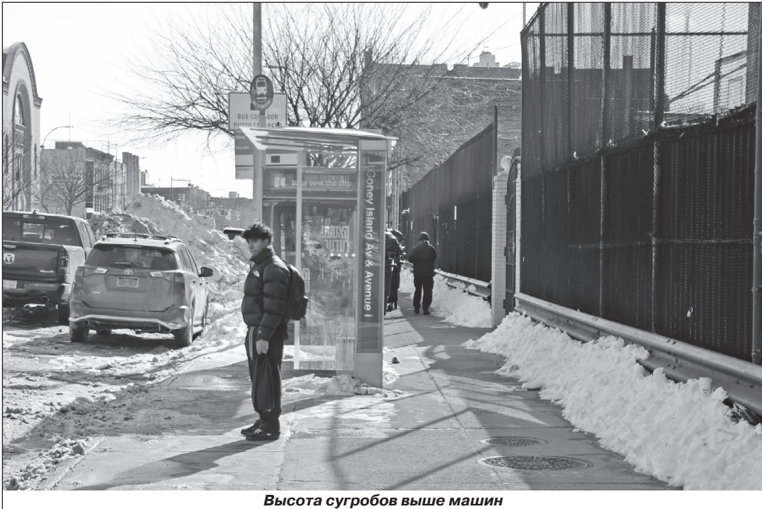
Высота сугробов выше машин