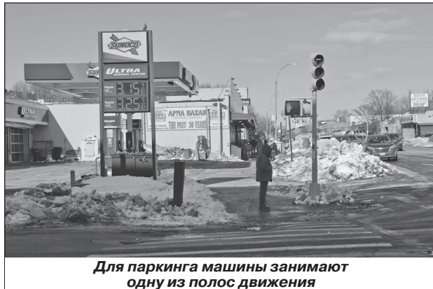
Для паркинга машины занимают одну из полос движения