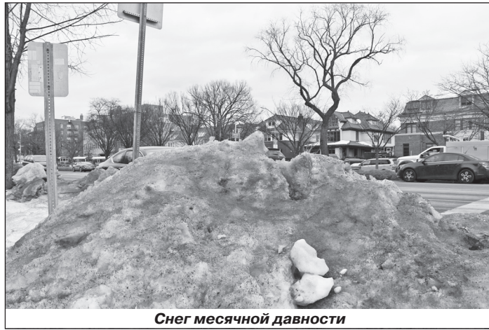
Снег месячной давности