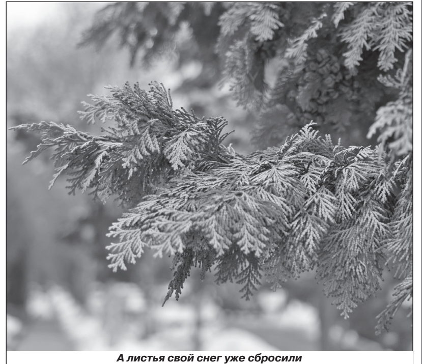
А листья свой снег уже сбросили