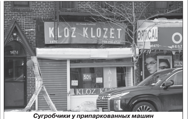
Сугробчики у припаркованных машин