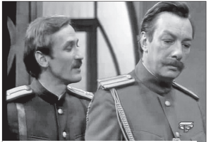
С Леонидом Филатовым в фильме «Любовь Яровая» (1977)