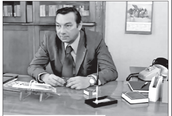
В фильме «Осенний марафон» (1979)