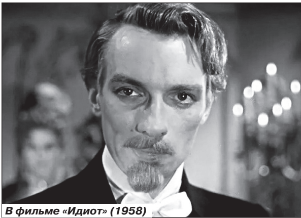
В фильме «Идиот» (1958)