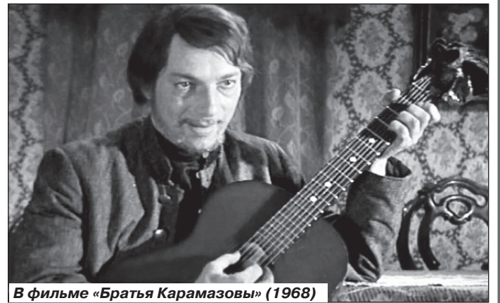
В фильме «Братья Карамазовы» (1968)