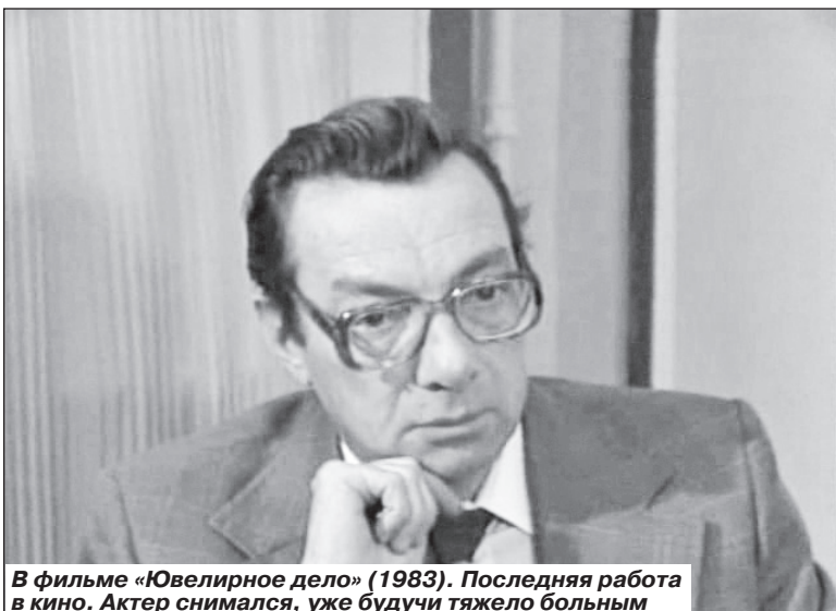
В фильме «Ювелирное дело» (1983). Последняя работа в кино. Актер снимался, уже будучи тяжело больным