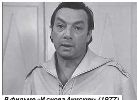
В фильме «И снова Анискин» (1977)