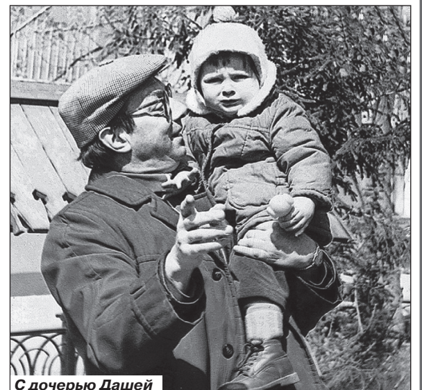
С дочерью Дашей