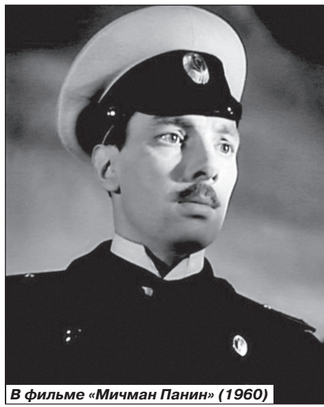
В фильме «Мичман Панин» (1960)

ворили, а потом он уехал в Москву, она осталась в Горьком.