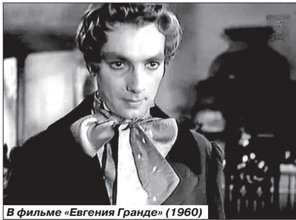
В фильме «Евгения Гранде» (1960)