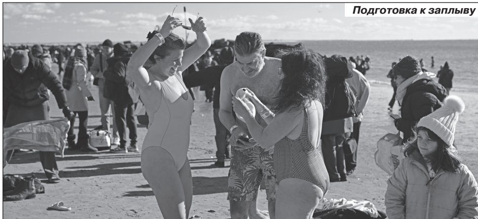
Подготовка к заплыву