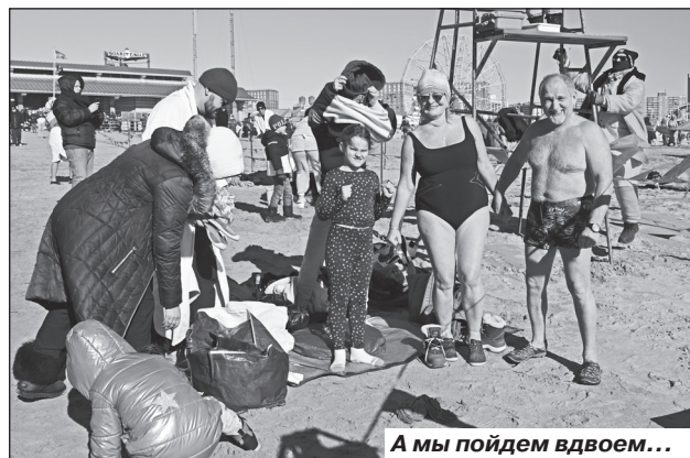
А мы пойдем вдвоем...