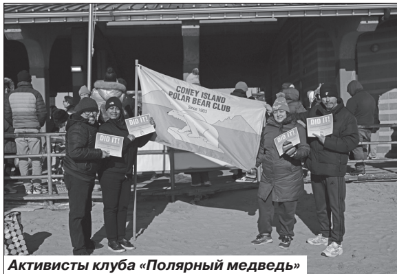
Активисты клуба «Полярный медведь»