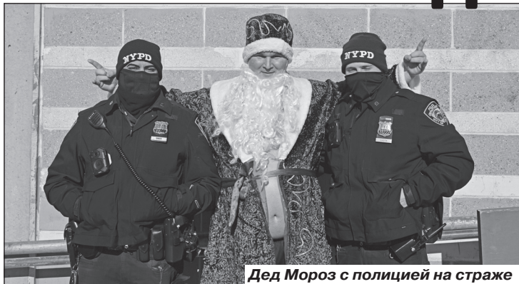
Дед Мороз с полицией на страже