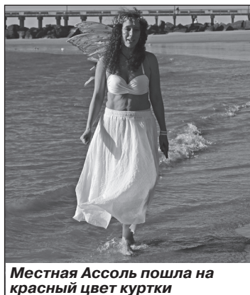
Местная Ассоль пошла на красный цвет куртки