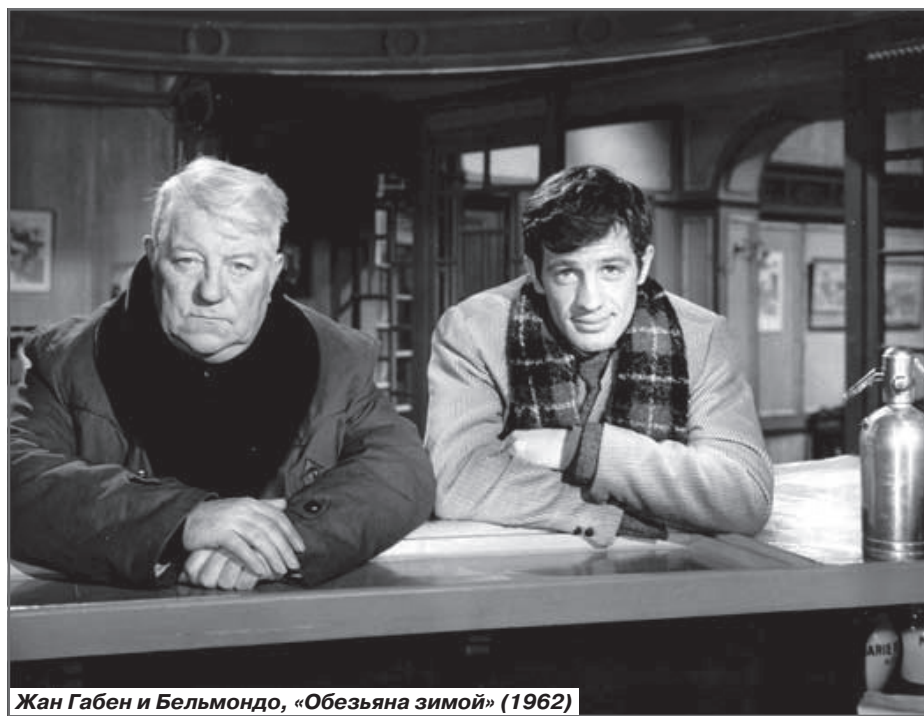
Жан Габен и Бельмондо, «Обезьяна зимой» (1962)

очередное увлечение. И не утешал факт, что измены в обычном понимании не было. Зато невыносимо раздражало, что верный Лепорелло Габена, его бессменная костюмерша Мишлен - настоящий серый кардинал, благоволила Мишель. Дориан Мишлен, естественно, терпеть не могла.