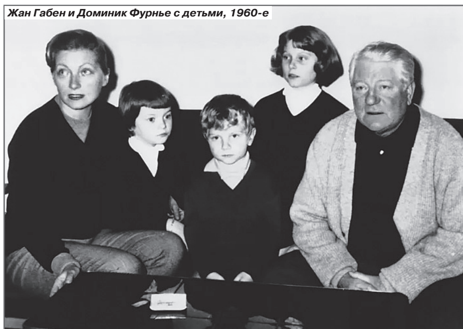
Жан Габен и Доминик Фурнье с детьми, 1960-е