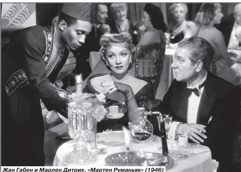
Жан Габен и Марлен Дитрих, «Мартен Руманьяк» (1946)