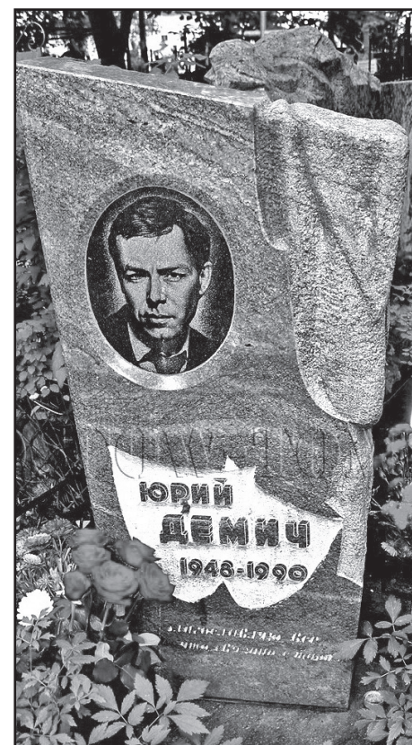
Памятник на могиле Юрия Демича на Ваганьковском кладбище Москвы