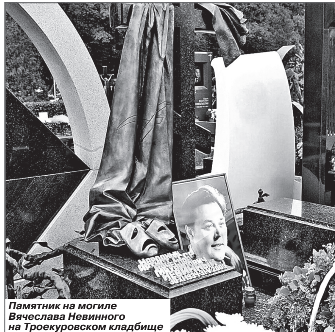
Памятник на могиле Вячеслава Невинного на Троекуровском кладбище