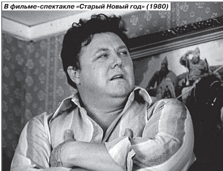
В фильме-спектакле «Старый Новый год» (1980)