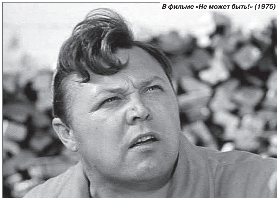
В фильме «Не может быть!» (1975)