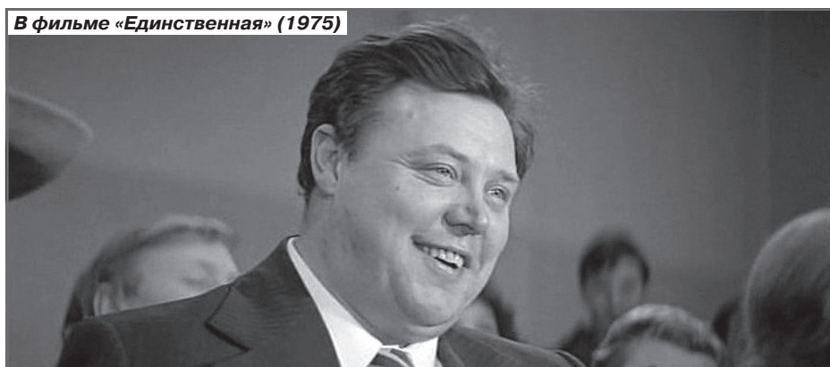
В фильме «Единственная» (1975)

детей у них не было. Да и как они могли появиться, когда в их доме постоянно шумные пьяные компании? Она пыталась его кодировать, но это не помогало.