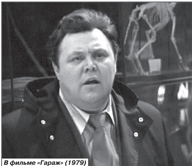
В фильме «Гараж» (1979)