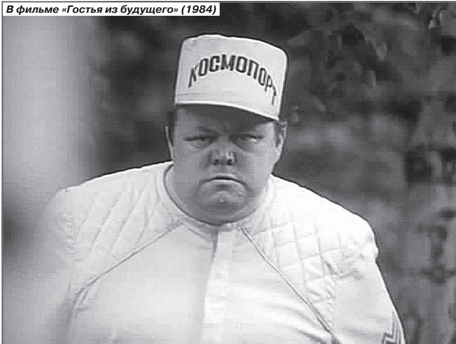
В фильме «Гостя из будущего» (1984)