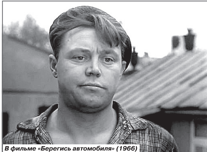
В фильме «Берегись автомобиля» (1966)

Нине было приятно, что у нее появился новый поклонник, но виду она не подавала. Когда он провожал ее до дома, то они много разговаривали, гуляя по ночной столице. Один раз Нина решила рассказать ему о своей горькой судьбе, говорила, что очень несчастлива от постоянных пьяных загулов мужа. Как это тяжело и горько, ждать его у окна, гадая, в каком состоянии он заявится домой в этот раз. А еще ее огорчало то, что своих