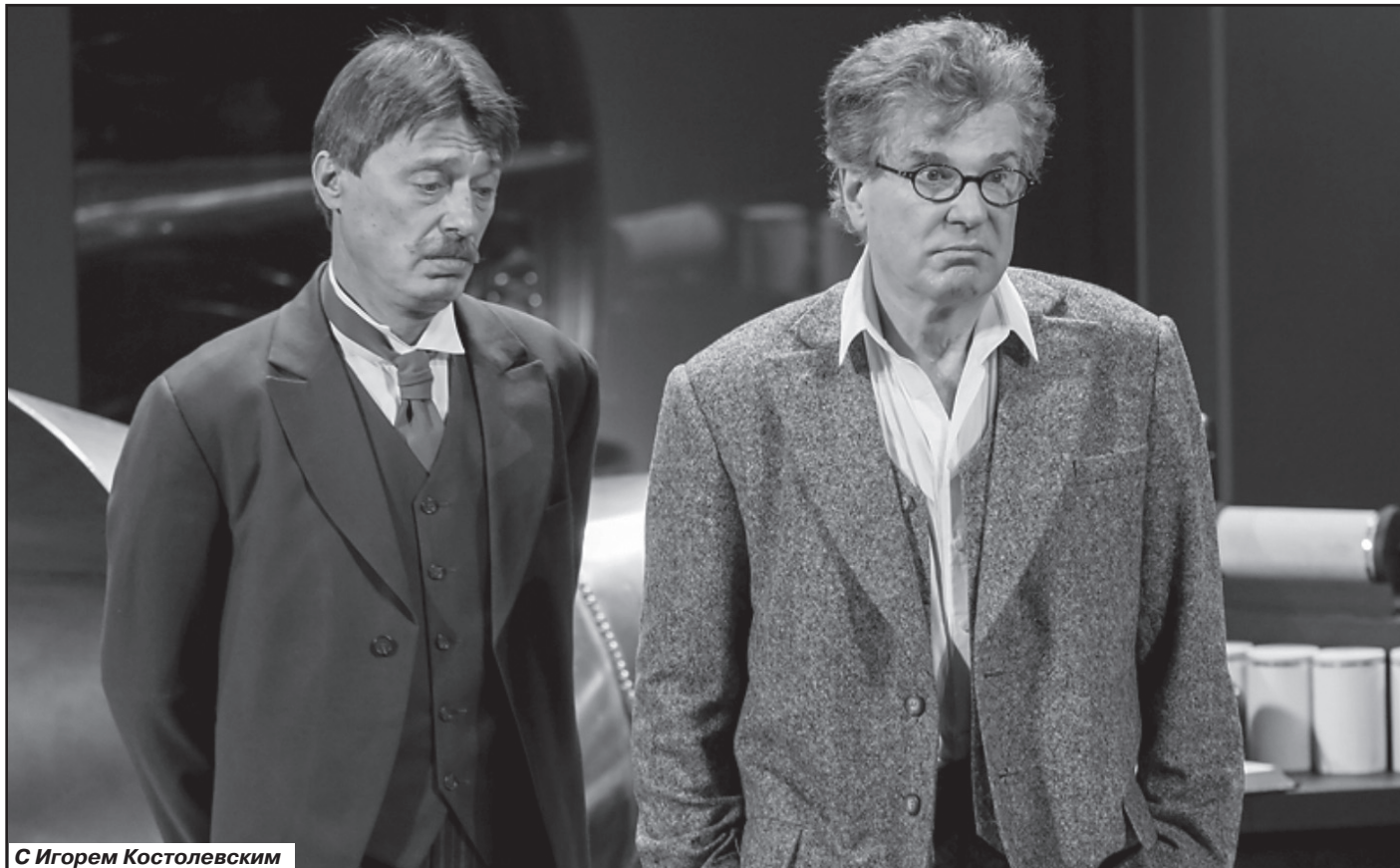
С Игорем Костолевским