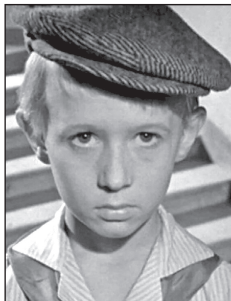
В фильме «Добро пожаловать, или Посторонним вход воспрещен» (1964)