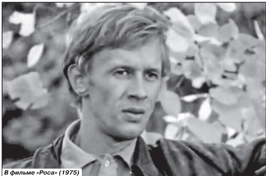
В фильме «Роса» (1975)

Но именно он познакомил приемного сына с актерской профессией и, скорее всего, под его влиянием 13-летний Витя поднял руку, когда в их класс пришел начинающий режиссер Элем Климов и спросил, кто из ребят умеет плавать. По другой версии, шепотной школьник всего лишь не хотел идти на скучные предметы, а потому и откликнулся на вопрос непонятного взрослого человека.