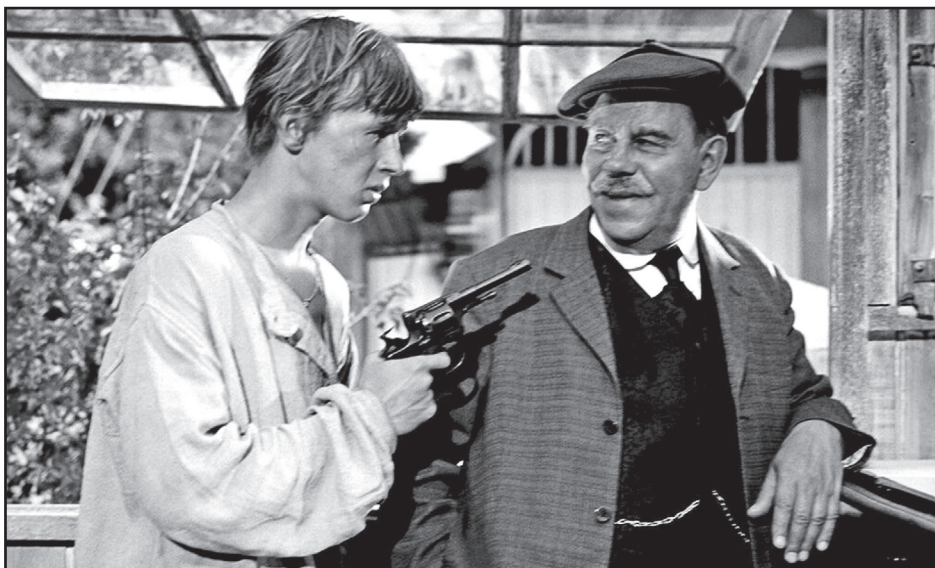
С Константином Сорокиным в фильме «Новые приключения неуловимых» (1968)

Он несколько раз попадал в аварии, получал серьезные травмы, и организм не выдержал. По официальной версии Виктор Косых умер от сердечной недостаточности в 2011-м на 61-м году жизни.