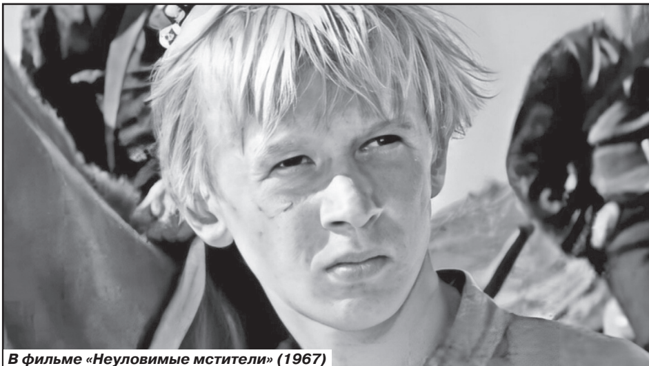
В фильме «Неуловимые мстители» (1967)