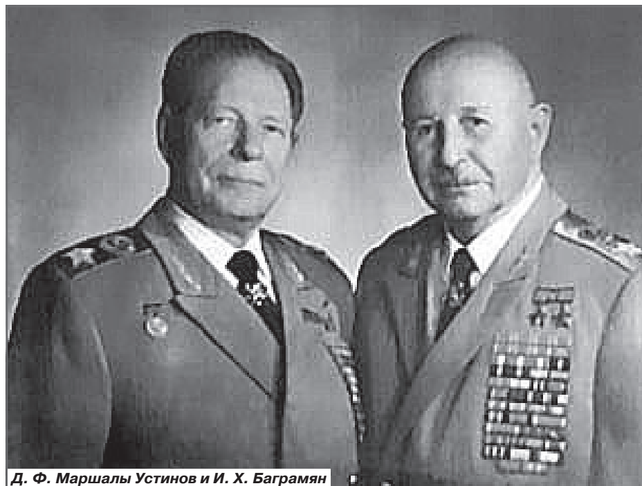
Д. Ф. Маршалы Устинов и И. Х. Баграмян