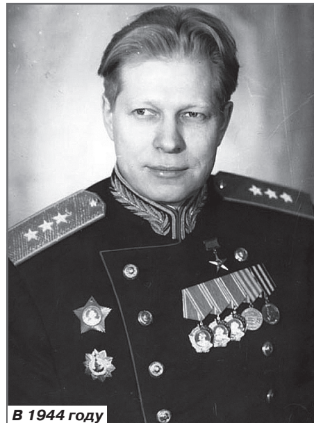
В 1944 году

род прибыла комиссия из ЦК партии. Директоров, в том числе и Устинова, вызвали на ковер в Москву на заседание Совнаркома, которое вел сам Сталин. Там комиссия показала фотоснимки пустых цехов и груды нераспакованного оборудования. Сталин потребовал ответа. Вместо этого молодой директор Устинов продемонстрировал всем свои фотографии, сделанные через день после отъезда комиссии. На них станки и агрегаты стояли в цехах и давали продукцию. Ста-