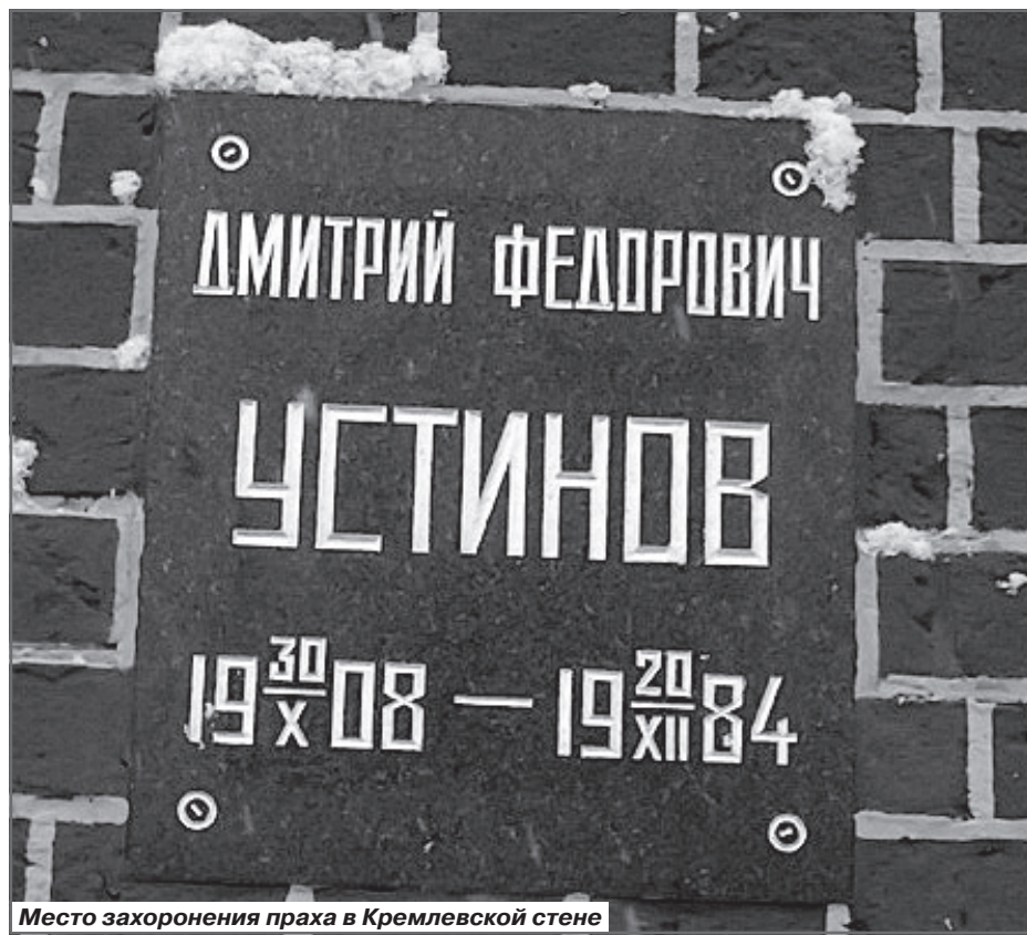
Место захоронения праха в Кремлевской стене