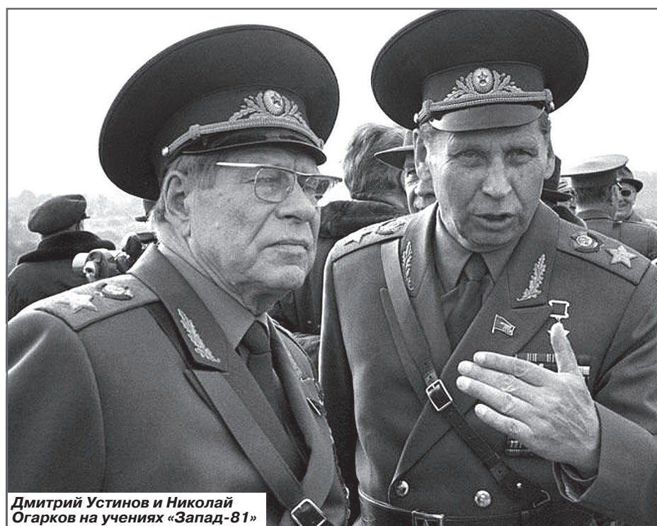
Дмитрий Устинов и Николай Огарков на учениях «Запад-81»

Она и уговорила. Устинова госпитализировали в ЦКБ, откуда он больше не вышел.