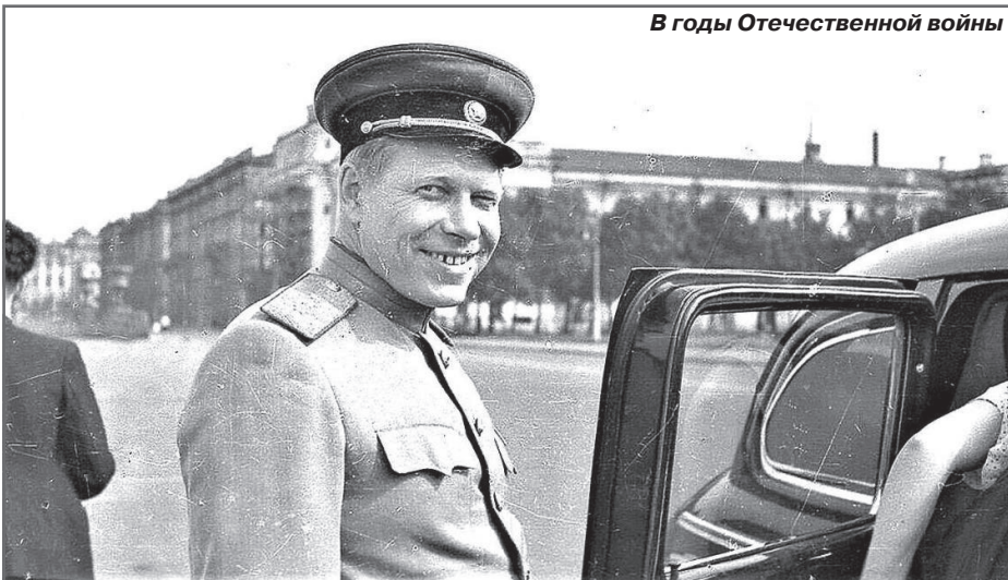
В годы Отечественной войны