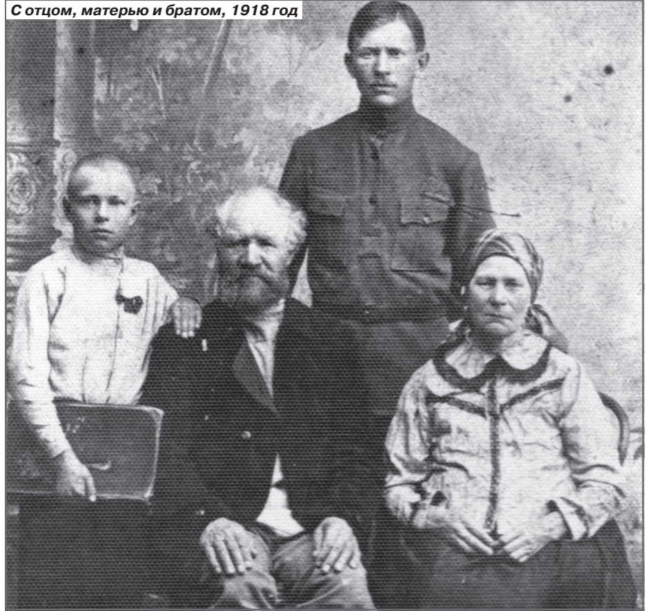
С отцом, матерью и братом, 1918 год

отправила в лагеря и тюрьмы тысячи руководителей, но и на социальном лифте вознесла наверх совсем молодых.