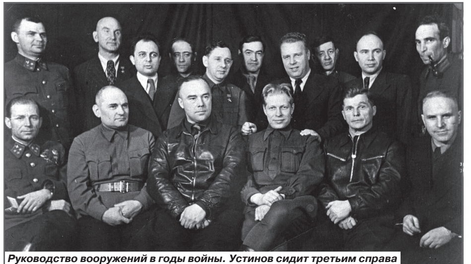
Руководство вооружений в годы войны. Устинов сидит третьим справа