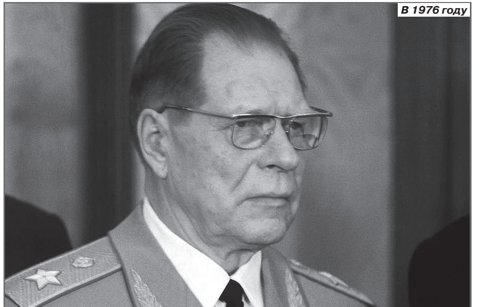
В 1976 году