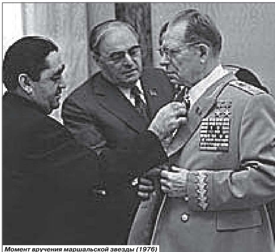
Момент вручения маршальской звезды (1976)

лину такая оперативность понравилась, он запомнил директора завода «Большевик» и, когда возник вопрос о кандидатуре наркома вооружений, назначил на этот пост Устинова.