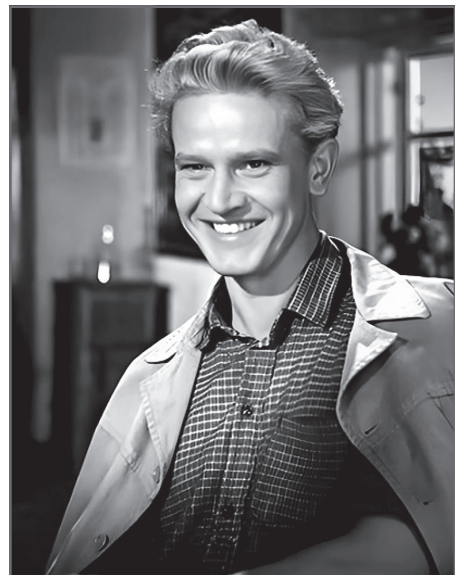
В фильме «Наш общий друг» (1961)