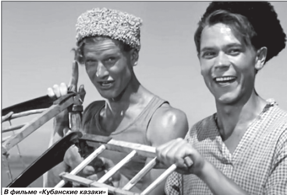
В фильме «Кубанские казаки»