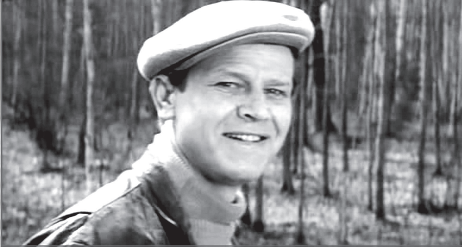
В фильме «День и вся жизнь» (1969)