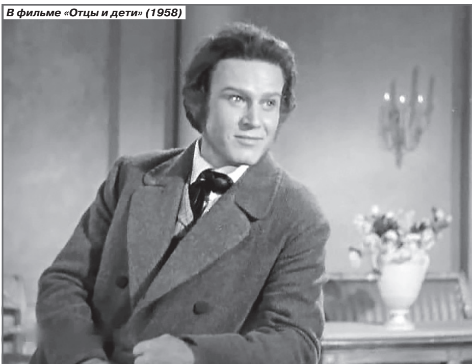
В фильме «Отцы и дети» (1958)