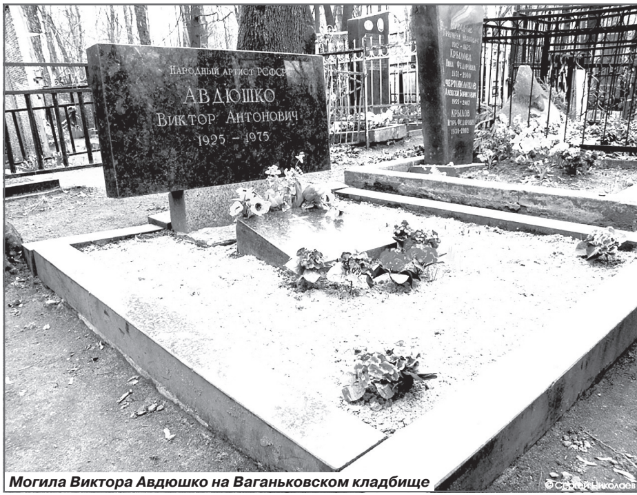
Могила Виктора Авдюшко на Ваганьковском кладбище