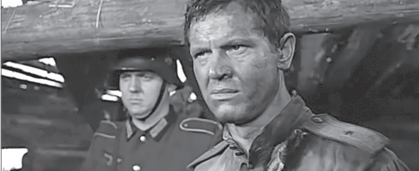
В фильме «Освобождение» (1968-1971)

союза. Он стал переживать пуще прежнего. Снова развод, снова несостоявшееся отцовство и снова предательство.