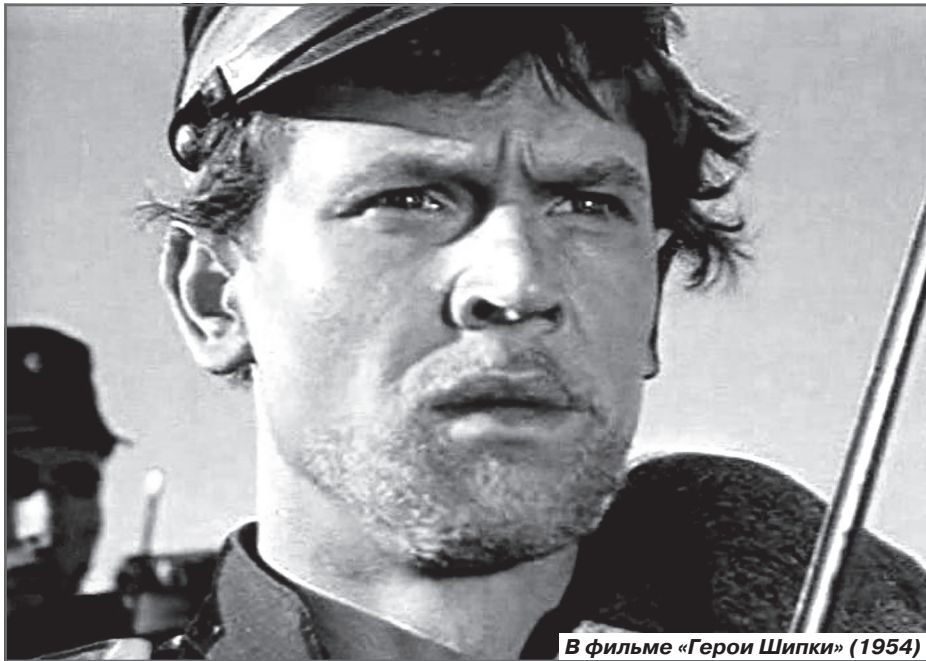
В фильме «Герои Шипки» (1954)

Тому подтверждение драмы «Мир входящему», «Живые и мертвые», «Освобождение», «Звезды и солдаты», «Солдаты свободы».