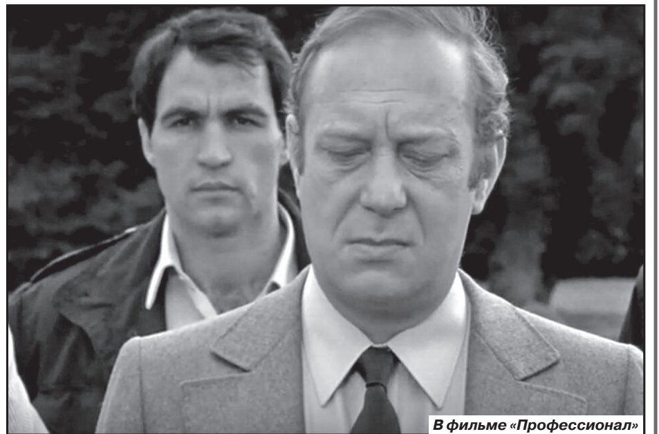
В фильме «Профессионал»