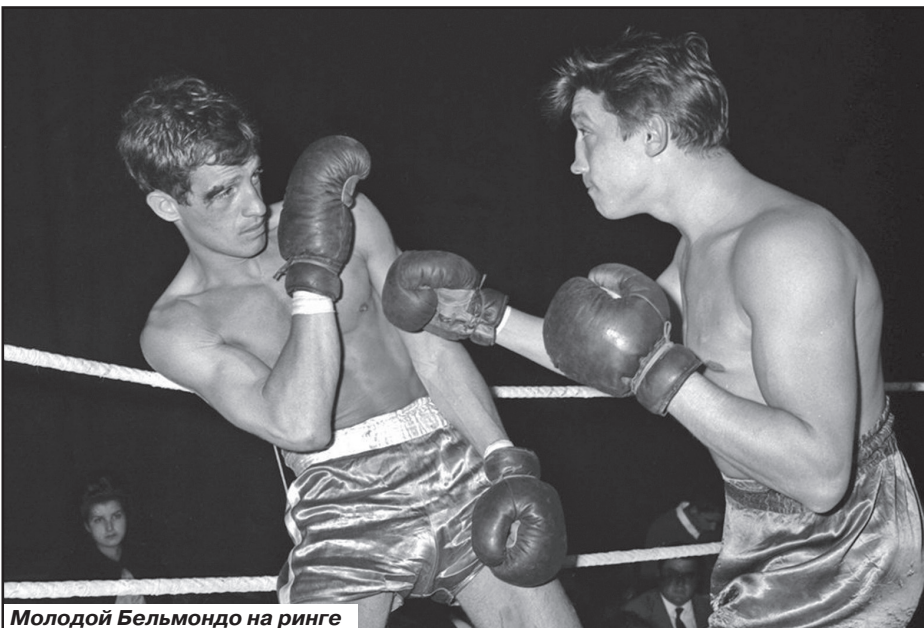
Молодой Бельмондо на ринге

Что касается Бруно Сулака, то он пережил своего друга ровно на год: 18 марта 1985 года при попытке к бегству он упал со второго этажа. По официальной версии - выпрыгнул сам, спасаясь от погони. По слухам, доведенные его наглостью до белого каления полицейские вытолкнули его из окна.