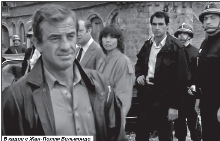
В кадре с Жан-Полем Бельмондо

именем. Он прекрасно понимал, что находясь рядом со звездой такого уровня, он рано или поздно окажется на газетных снимках. Он справил себе поддельные документы - так появился Стивен (Юго) Йованович.