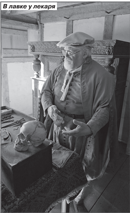
В лавке у лекаря