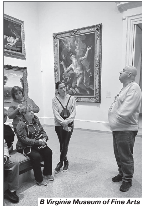
В Virginia Museum of Fine Arts

Колонисты пережили страшный голод, когда ели буквально всё, что могли найти.