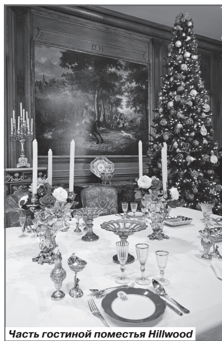
Часть гостиной поместья Hillwood