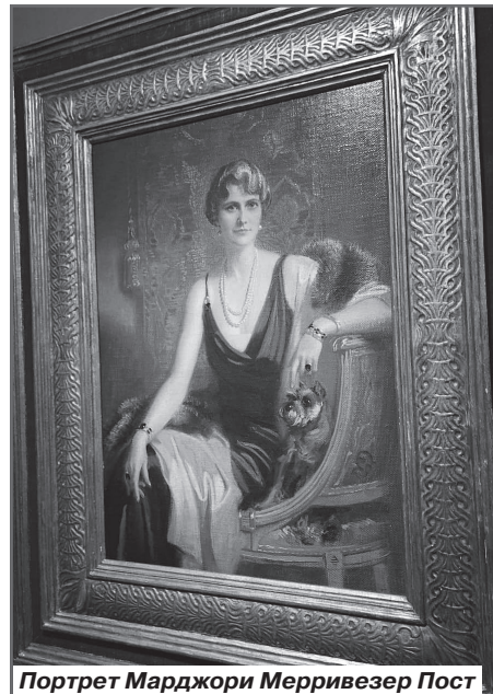
Портрет Марджори Мерривезер Пост

Так что путешествуйте с агентством «Тур-Шмур». Это не только интересные и увлекательные экскурсии, но и множество неожиданных и приятных сюрпризов!