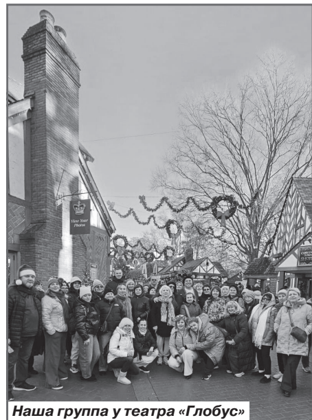
Наша группа у театра «Глобус»