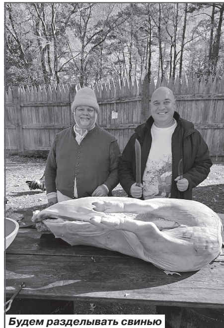
Будем разделывать свинью